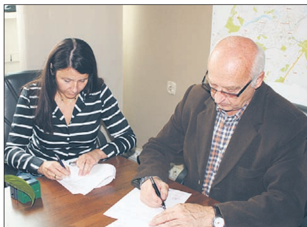
Dokumentacja wykonawcza ma być gotowa za cztery miesiące

25 września podpisana została umowa na projekt wykonawczy budynku Centrum Edukacyjno-Multimedialnego, które ma powstać pomiędzy ulicami Jana Pawła II, Nadarzyńską oraz Dworcową.