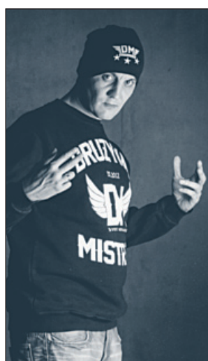
Roman Bosski Foto arch. Drużyna Mistrzów

Kolejnym etapem będą zaplanowane na październik szkolenia dla rodziców prowadzone w szkołach, do udziału w któ-