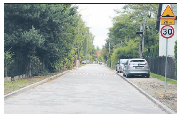
W połowie września zakończyły się prace remontowe na ulicy Zielnej w Kamionce.