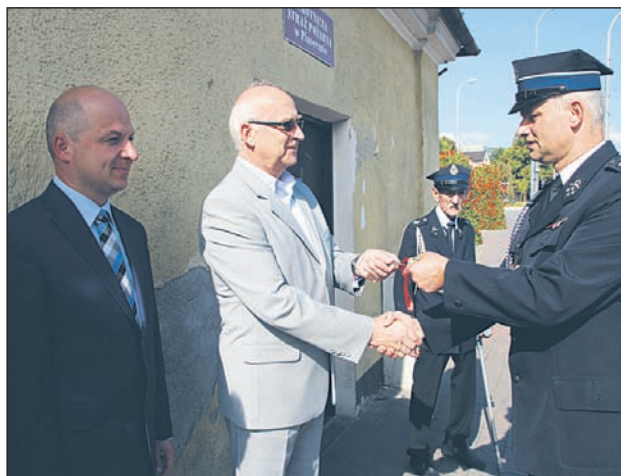
Zamknięcie i symboliczne przekazanie burmistrzowi kluczy do dawnej siedziby OSP

Po ponad 100 latach jednostka Ochotniczej Straży Pożarnej przeniosła się z historycznego budynku przy ul. Puławskiej do nowej siedziby przy ul. Dworcowej.