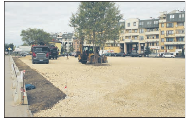
14 września rozpoczęła się budowa parkingu u zbiegu ulic Jarząbka i Czyżyków

zynowe oraz węzeł ciepły. Strażnicę wybudowano łącznie z infrastrukturą towarzyszącą, taką jak: przyłącze wodociągowe, kanalizacje sanitarne i deszczowe, przyłącze energetyczne, plac manewrowy z parkingiem, ogrodzenie i oświetlenie terenu wraz z bramami wjazdowym i zbiornik retencyjny. Dodatkowym atutem jest system powiadamiania GSM, z którego korzystać będą strażacy.