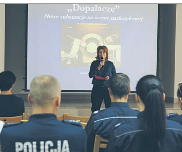
Akcję antydopalaczową rozpoczęła konferencja w urzędzie miasta

Zwienieniem akcji edukacyjnych będzie impreza plenerowa, która odbędzie się 24 paź-