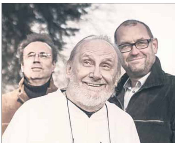
Jedna z ikon polskiego jazzu wystąpi ze swoim zespołem w najbliższą niedzielę w Piasecznie

muzyka to poezja, romantyzm, refleksja, język niedefiniowalny i nieprzewidywalny. Jego życiorys to niemal cała historia polskiego jazzu. Od samego początku kariery wzbudza powszechne uznanie. Wybitny, niepowtarzalny kompozytor, jeden z pierwszych polskich multiinstrumentalistów. Jego idiom to pojęcie tak szerokie, jak nieskończony jest wachlarz