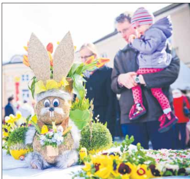
Tradycyjne życzenia od władarzy miasta i wspólne dzielenie się jajkiem planowane jest na godz. 12.30

W Niedzielę Palmową, jak co roku, na piaseczyńskim rynku staną kolorowe stragany.