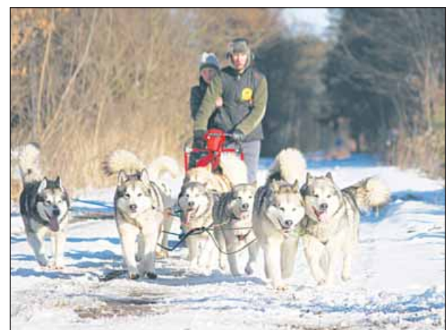
Przewidziane są konkursy, nagrodą w których będzie przejażdżka psim zaprzęgiem.

Dla seniorów organizatorzy zaplanowali gry planszowe i karciane, a także, wraz z Fundacją Żyć Aktywnie po 50-tce, zostanie przeprowadzony nordic walking po lesie Chojnowskim. Na miejscu dostępna będzie limitowana ilość kijków do wypożyczenia.