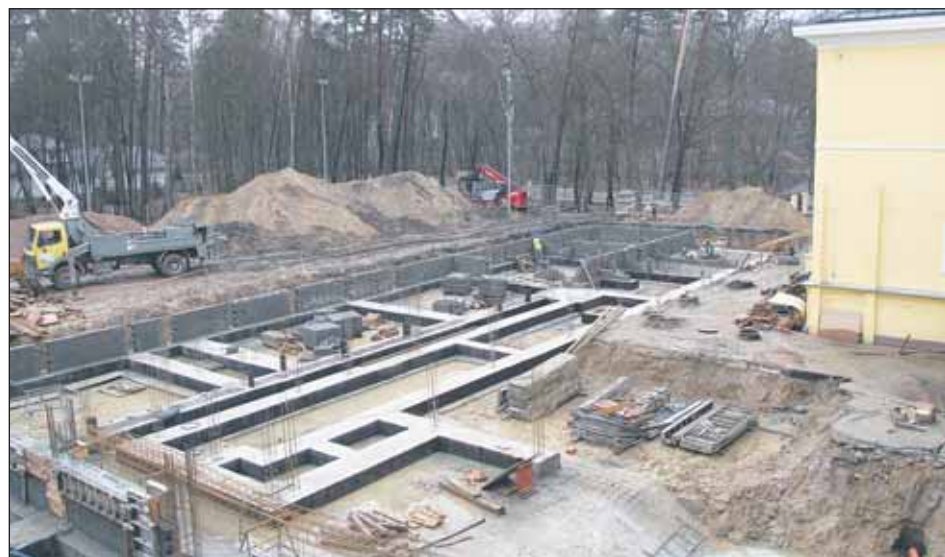
Rozpoczęto już wznoszenie ścian przy budowie nowej części szkoły

Budowa pomieszczeń zaplanowanych w nowym skrzydle budynku to jednak nie jedynym wyzwaniem, jakie postawiono przed wykonawcą projektu. Sporą część prac stanowią będą remonty, takie jak osuszenie i izolowanie ścian fundamentowych, adaptacja pomieszczeń piwnicznych na potrzeby szatni, gruntowna odnowa sanitariatów czy montaż platformy dla osób niepełnosprawnych.