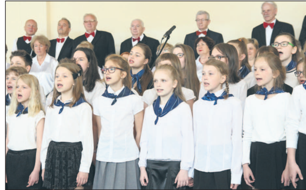
Wspólny występ uczniów Szkoły Podstawowej nr 5 i Chóru Lira

Z okazji rocznicy Święta Konstytucji odbyły się specjalne uroczystości w szkołach i przedszkolach.