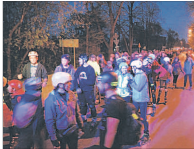
Pierwszy Nightskating w Piasecznie przyciągnął ponad 200 miłośników rolek

Organizatorem nocnych przejazdów jest Fundacja Vio-