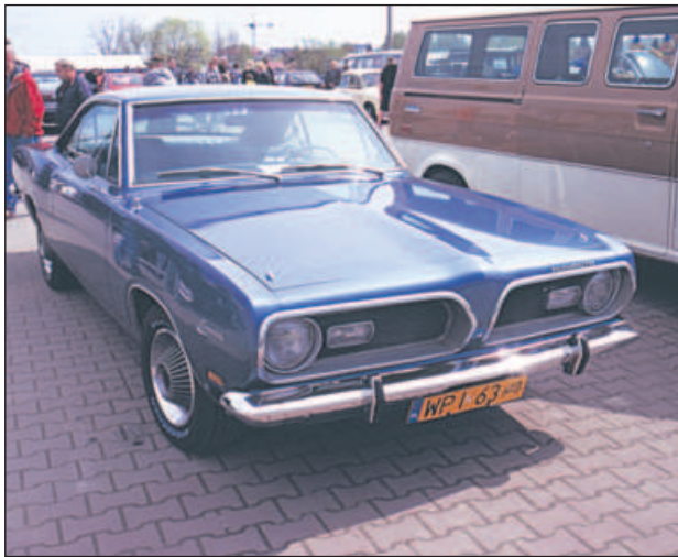
Takie auta można było podziwiać na zeszlórocznym zlocie

Ponad sto zabytkowych pojazdów będzie można zobaczyć podczas trzeciej edycji piaseczyńskiego Zlotu, organizowanej 5 czerwca na targowisku miejskim.