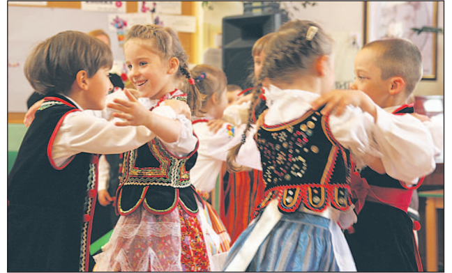
Tańce ludowe w wykonaniu przedszkolaków z Nefrytowego Zakątka