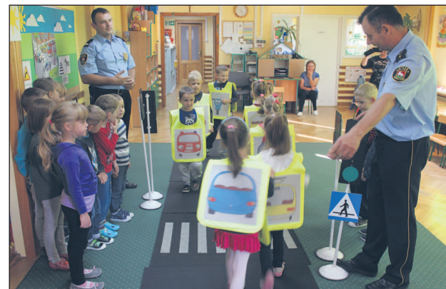
z bezpiecznymi zachowaniami dzieci, rozróżnianie najważniejszych znaków drogowych, przechodzenie przez jezdnię, korzystanie z sygnalizacji świetlnej. Teoria to jednak nie wszystko, dlatego strażnicy dysponują również minimiasteczkiem drogowym, w którym symulują różne sytuacje mogące się zdarzyć na drodze, często bardzo skrajne, po to, aby zaciekać dzieci i sprawić, by zapamiętały tę naukę.

Od połowy 2014 roku piesi poruszający się poza terenem zabudowanym po zmroku zobowiązani są do noszenia odblasków. Ekspert od bezpieczeństwa w ruchu drogowym przyznają, że to bardzo pozytywna zmiana. Światła samochodu oświetlają jedynie 40–60 metrów. Osoba ubrana na czarno, która idzie poboczem lub na skraju drogi, jest zauważana przez kierowcę właściwie w ostatniej chwili. Często jest zbyt późno na jakąkolwiek reakcję.