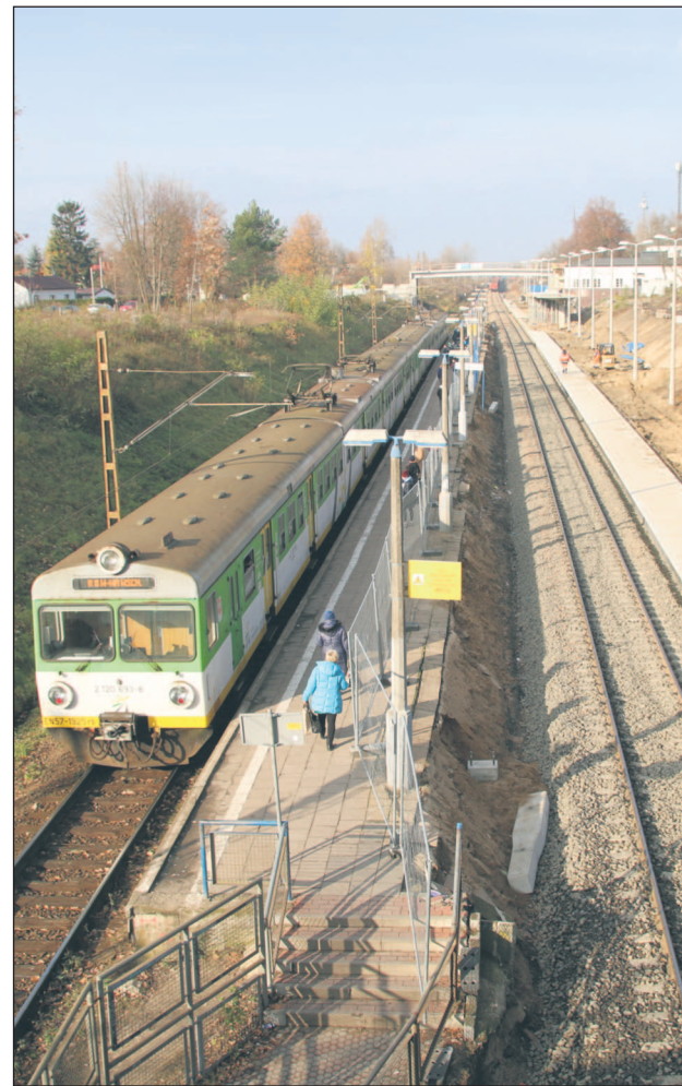
Widok na przebudowywane perony na stacji w Piasecznie

Dlatego zarówno władze Piaseczna, jak i ZTM będą rozmawiać z KM oraz samorządem województwa mazowieckiego jako organizatorem przewozów realizowanych przez KM, aby uzgodnić możliwości zwiększenia ilości połączeń dla naszych mieszkańców.