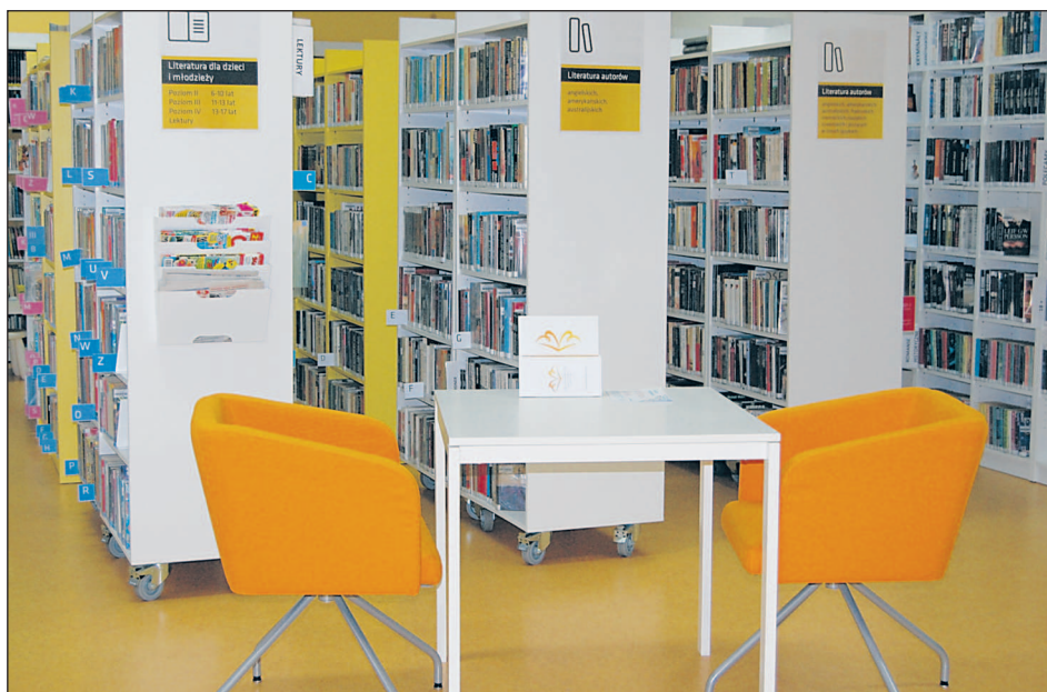
Filia biblioteki w Głoskowie po remoncie

– Dzięki temu możliwe jest oglądanie filmów, dyskusje literackie itp. Ponadto udostępniane są audiobooki, filmy oraz e-booki na platformie IBUK Libra. Poprawa infrastruktury sprawiła, że biblioteka stała się bardziej przyjazna i bezpieczna zwłaszcza dla dzieci, osób starszych i niepełnosprawnych. Kolor wyróżniający filię to morski. Zmiany, które nastąpiły, mają wpływ na rozwój czytelnictwa – podniosły jakość i standard działań, znacznie zmieniły warunki lokalowe oraz wyposażenie i przekształciły filię w nowoczesne miejsce z dostępem do wiedzy, kultury, a zarazem miejsce dla rozwoju życia lokalnego, otwarte na współpracę ze stowarzyszeniami i grupami działającymi na terenie Zalesia.