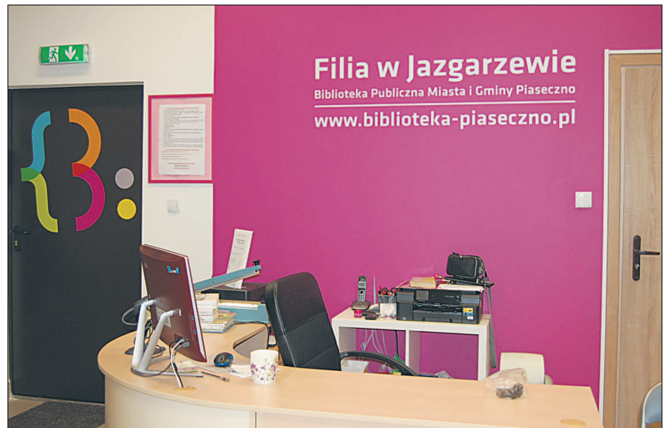
Nowoczesny i przyjazny wystrój biblioteki w Jazgarzewie

W filii został przeprowadzony remont, wymieniono meble biblioteczne, ładę, utworzono kąciak dla najmłodszych. Celem modernizacji prowadzonych w filii było dostosowanie obiektu do nowoczesnych standardów i zmieniających się potrzeb różnych grup czytelników. Wykonane prace modernizacyjne i nowoczesna aranżacja wnętrza stworzyły odpowiednie warunki lokalowe do wprowadzania oferty wykraczającej poza tradycyjne funkcje biblioteki, w tym umożliwiły podnoszenie kompetencji cyfrowych mieszkańców. W filii prowadzone są zajęcia komputerowe dla seniorów, cykliczne spotkania z muzyką, lekcje biblioteczne dla dzieci i spotkania autorskie. Dzięki dodatkowemu wyposażeniu (ekran, rzutnik) możliwe jest przeprowadzanie różnorodnych zajęć. Użytkownicy filii mają dostęp do wysokiej jakości sprzętu komputerowego, wyposażenie jest dostosowane do wieku, potrzeb i udostępnianych zbiorów.