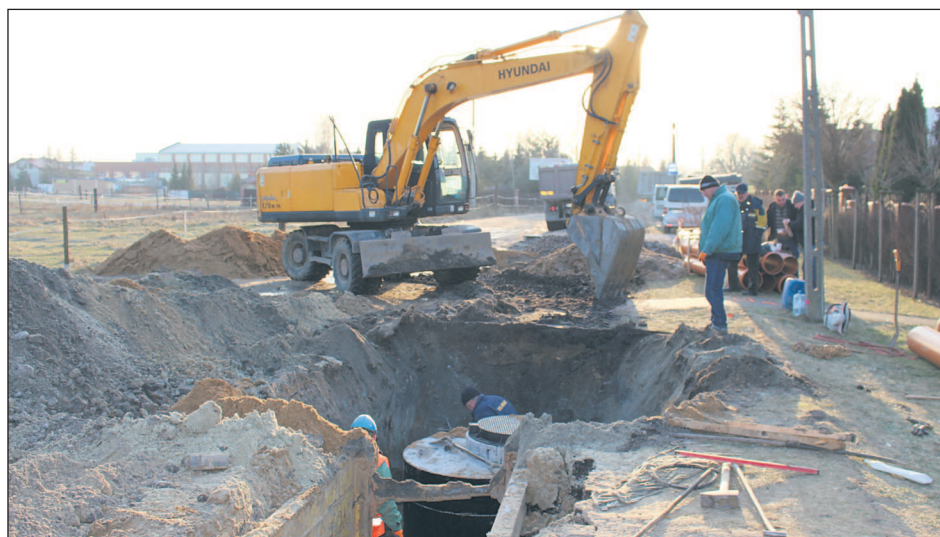
Trwa budowa kanalizacji deszczowej w górnym odcinku ul. Wilanowskiej

W ramach prac budowlanych zostanie przebudowana podziemna infrastruktura techniczna. Na całym objętym inwestycją odcinku powstanie kanalizacja deszczowa odwadniająca drogę, po