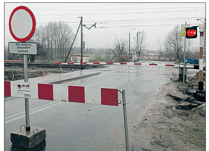
PKP PLK nie podały dokładnego terminu otwarcia przejazdu