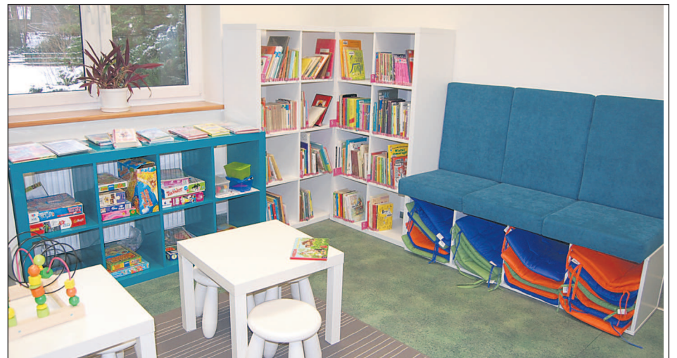
Kąciak dla najmłodszych w bibliotece w Zalesiu Górnym

– Dzięki temu możliwe jest oglądanie filmów, dyskusje literackie itp. Ponadto udostępniane są audiobooki, filmy oraz e-booki na platformie IBUK Libra. Poprawa infrastruktury sprawiła, że biblioteka stała się bardziej