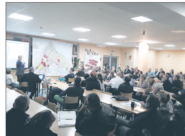
Trwają konsultacje społeczne dotyczące opracowywanego planu zagospodarowania przestrzennego Józefosławia.

Porządkowanie ładu przestrzennego w miejscowości, w której liczba mieszkańców w przeciągu kilkunastu ostatnich lat zwiększyła się dziesięciokrotnie, jest wielkim wyzwaniem dla samorządu.