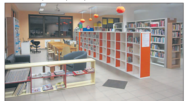
W filii w Józefosławiu dokupiono m. in. nowe regały oraz stanowiska komputerowe