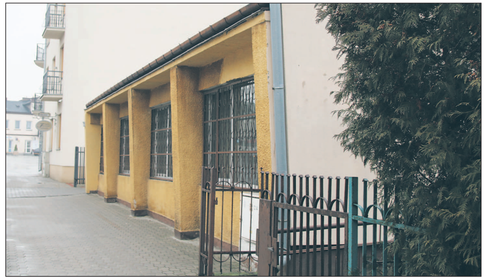
Trwa już rozbiorczy dawnej siedziby MOPS

Wybrany w przetargu wykonawca rozbiorczy, firma APG Invest, deklaruje, że wykona