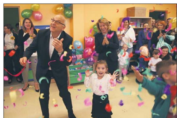
We wrześniu 2017 r. odbyło się uroczyste otwarcie nowej placówki przedszkolnej w Piasecznie