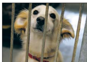
Czworonogom z Piaseczna opiekę zapewni teraz schronisko „Na Paluchu”