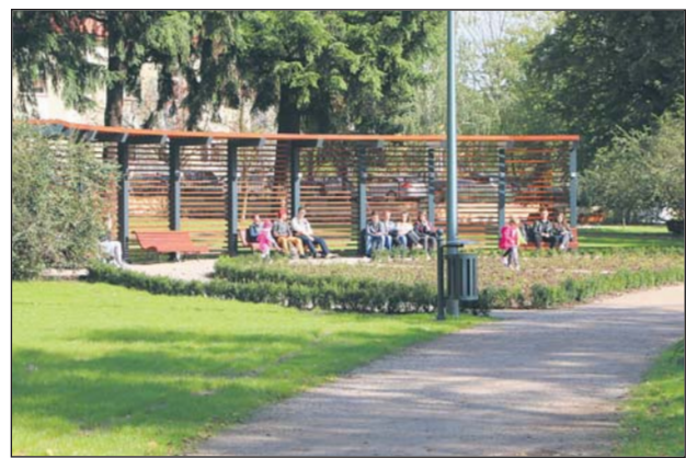
Nowa pergola w centralnej części parku

– W niedalekiej przyszłości planujemy także stworzenie ścieżek tematycznych i histo-