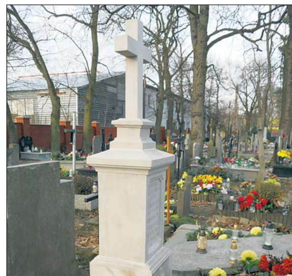
Do 30 września 2017 r. można składać wnioski na rok budżetowy 2018 na przyznanie dotacji z gminy Piaseczno.

Dotacja dotyczy obiektów znajdujących się w Wojewódzkim Rejestrze Zabytków. Obiekty objęte jedynie Gminną Ewidencją Zabytków, bez wpisu do Rejestru Zabytków, aktualnie nie mają możliwości otrzymania dotacji z budżetu gminy Piaseczno.