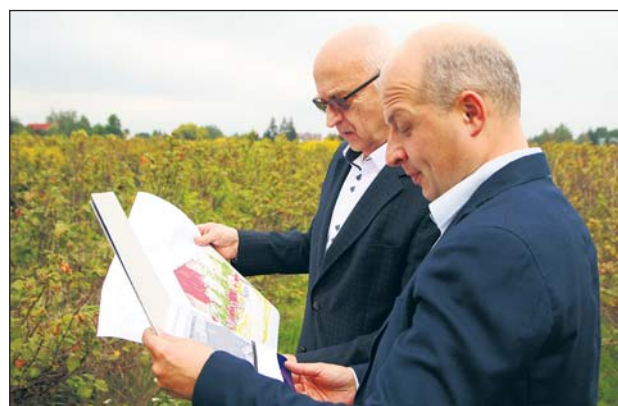
Burmistrzowie oceniają jak będzie można wykorzystać nową nieruchomość

– W najbliższym czasie gmina planuje przeprowadzenie zmian w miejscowym planie zagospodarowania przestrzennego tego terenu, aby dostosować go do swoich potrzeb i stworzyć miejsce pod zaplanowany obiekt. Niezbędna będzie także rezerwacja środków w budżecie na przygotowanie koncepcji zabu-