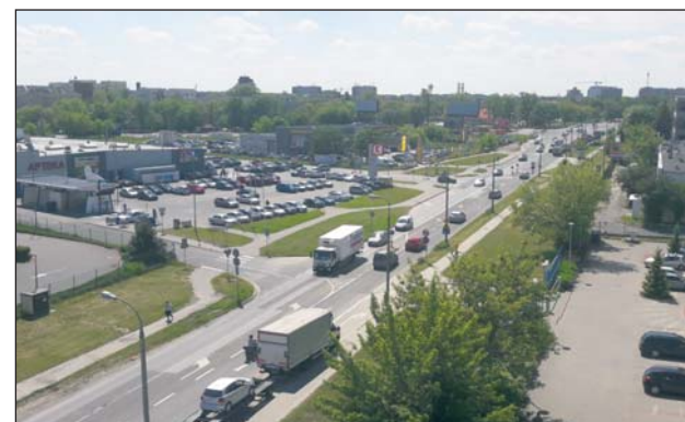
Ulica Okulickiego przed rozbudową

Na razie ruch pojazdów na ul. Okulickiego odbywa się po zawężonych pasach ruchu, jednak cały czas możliwy jest ruch pojazdów w obu kierunkach. W pierwszym etapie inwestycji wykonywana będzie jezdnia północna, której budowa już się