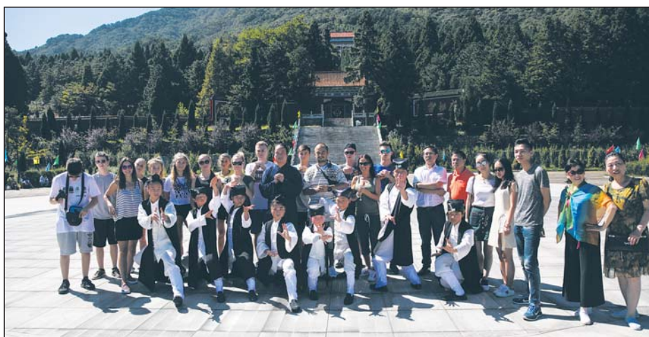
Tancerze z Grawitacji z wizytą w szkole Kung-Fu

Przed wyjazdem do kolejnego miasta – Huanggang – Grawitacja nie odwiedziła Szkoły Sztuk Walk – Kung-Fu, która prezentowała się razem z nimi podczas występów. Adepti szkoły przyjęli grupę z polski bardzo ciepło i zaprezentowali wspaniały pokaz. Był też czas na