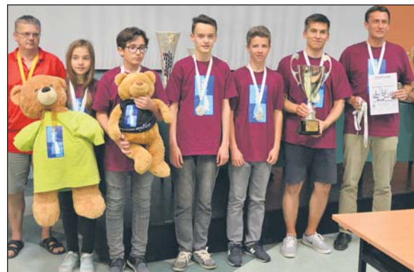
Klub Sportowy Laura Chyllice zdobył drużynowe wicemistrzostwo Polski juniorów w szachach podczas zawodów, które odbyły się w dniach 22-30 lipca w Szczyrku.