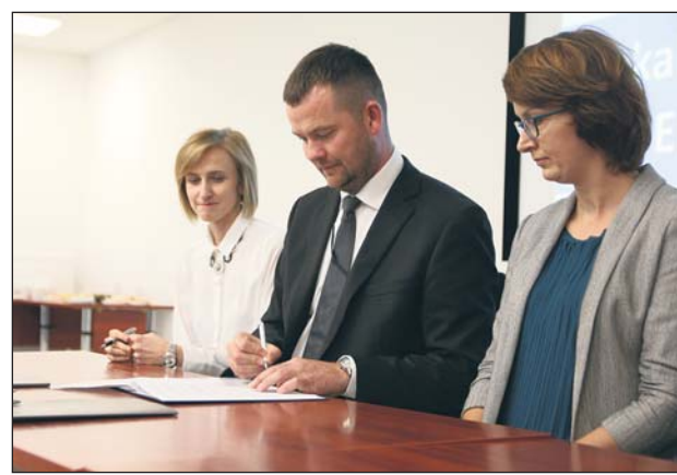
Sygnatariusze listu intencyjnego podczas składania podpisów

Dzięki wspólnym działaniom zakłada się: radykalną poprawę stanu środowiska w obszarze jakości powietrza i ograniczenia niskiej emisji, zrównoważenie zapotrzebowania na energię, wykorzystanie potencjału lokalnych odnawialnych źródeł energii, wdrażanie przedsięwzięć z zakresu elektromobilności i edukacji ekoenergetycznej. Inicjatywa pozwoli decydować