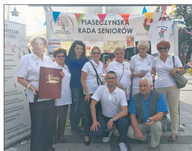
Przed stoiskiem Piaseczyńskiej Rady Seniorów podczas Jarmarku Piaseczyńskiego – 10 września 2017 r.

Połąknęliśmy bakcyła z entuzjazmem. Już myślimy o atrakcyjnym zaprezentowaniu się na