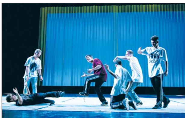
Jeden z występów na deskach chińskiego teatru

Ostatnie dwa dni w Państwie Środka to przejazd do Szanghaju i zwiedzanie największego i najbardziej spektakularnego chińskiego miasta. Polska młodzież była zachwycona przyjęciem przez chińską stronę, gościnnością gospodarzy, ich otwartością i życzliwością, którą okazywali na każdym kroku. W przyszłym roku gmina Piaseczno, przy współpracy z klubem, planuje zaprosić chińskich tancerzy do naszego miasta, aby pokazali się piaseczyńskiej publiczności.