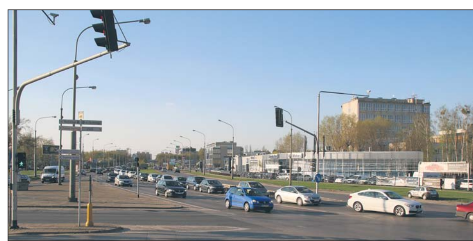
Prace na skrzyżowaniu potrwają do końca października

– Nie rozumiem decyzji o zawężeniu prac, gdyż sfinansowany i zaproponowany przez nas projekt przebudowy był zgodny z docelowym kształtem skrzyżowania planowanym przez GDDKiA – mówi wiceburmistrz Piaseczna