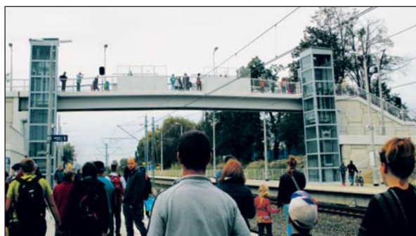
Dobiegają końca prace modernizacyjne przy przebudowie piaseczyńskiego odcinka linii kolejowej Warszawa – Radom