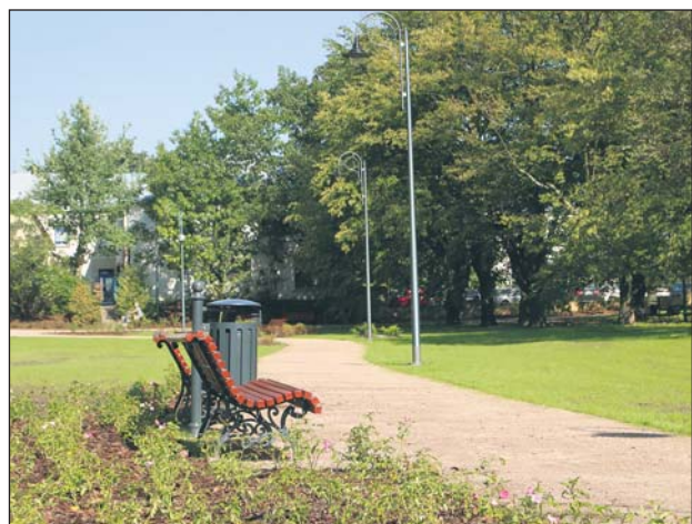
Alejki parkowe po modernizacji

Prace przy rewaloryzacji Parku Miejskiego w Piasecznie dobiegają końca. W wakacje pojawiły się nowe alejki, latarnie, ławki oraz kosze. Park zazielenił się dzięki dużej ilości planowych nasadzeń.