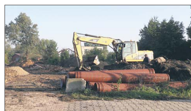
Nowy przebieg ul. Julianowskiej poprawi płynność ruchu na skrzyżowaniu z ul. Chyliczkowską

Przebudowa skrzyżowania ul. Chyliczkowskiej z ul. Armii Krajowej (DK 79) również powinna rozpocząć się w tym roku. Jednak termin rozpoczęcia tych prac nie jest jeszcze dokładnie ustalony – obecnie trwa doprecyzowywanie harmonogramu prac z GDDKiA.