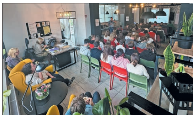
Warsztaty z przedsiębiorczości dla młodzieży – Klub Integracji Społecznej

„Piaseczyńskie Integracje” to natomiast doskonała okazja do nawiązania nowych kontaktów zawodowych oraz wymiany doświadczeń. Sesja networkingowa odbędzie się 11 czerwca w godz. 18.00–20.00. Spotkanie w nieformalnej atmosferze będzie stanowiło doskonałą platformę do swobodnej wymiany kontaktów i pomysłów przez przedstawicieli biznesu, administracji oraz sektora pozarządowego.