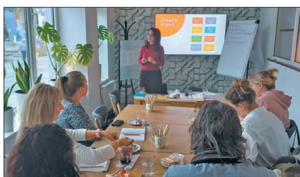
Warsztaty dla rodziców w ramach Akademii Rodziny

Z pełną ofertą Centrum Przedsiębiorczości w Piasecznie można zapoznać się na stronie internetowej https://przedsiębiorcze.piaseczno.eu/ w zakładce „Aktualności” oraz w siedzibie Centrum przy ul. Warszawskiej 1 w Piasecznie. Informacje o organizowanych szkoleniach, warsztatach, konsultacjach oraz spotkaniach można również znaleźć na profilach Centrum w serwisach społecznościowych Facebook oraz LinkedIn.