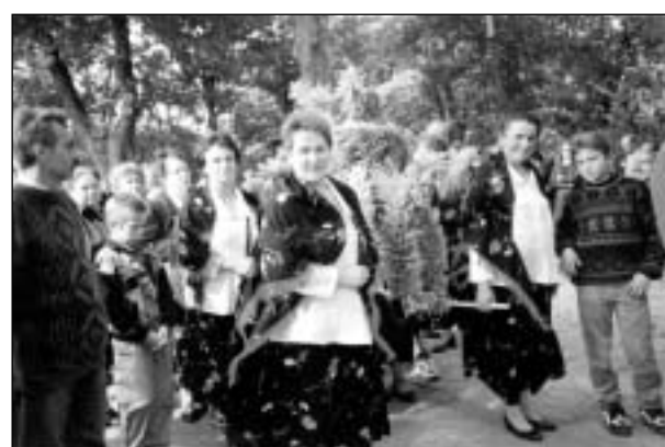
Gospodynie ze Złotokłosu z wieńcem dożytkowym