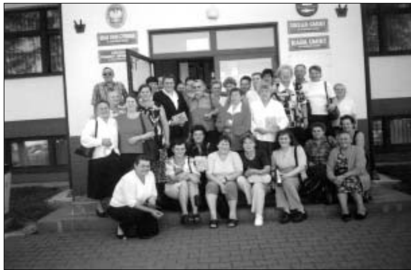
Wspólne zdjęcie przed Urzędem Gminy w Łososinie Dolnej

Gospodynie z Łososiny odwiedzą naszą gminą w weekend 12-14 września. - Powitamy je w Złotokłosie, a główną atrakcją jaką dla nich