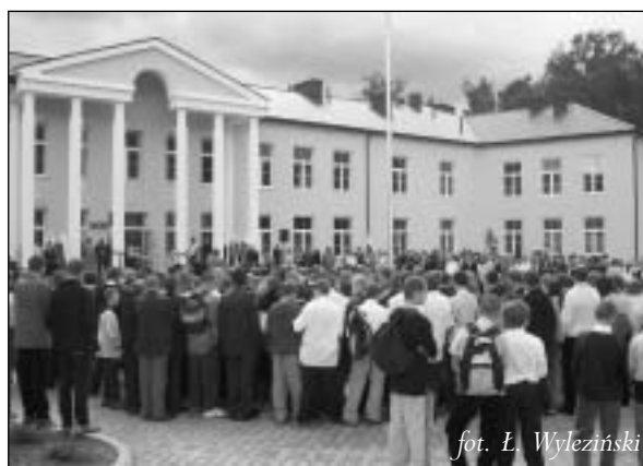
Do nowej szkoły uczęszcza 430 gimnazjalistów z terenu gminy