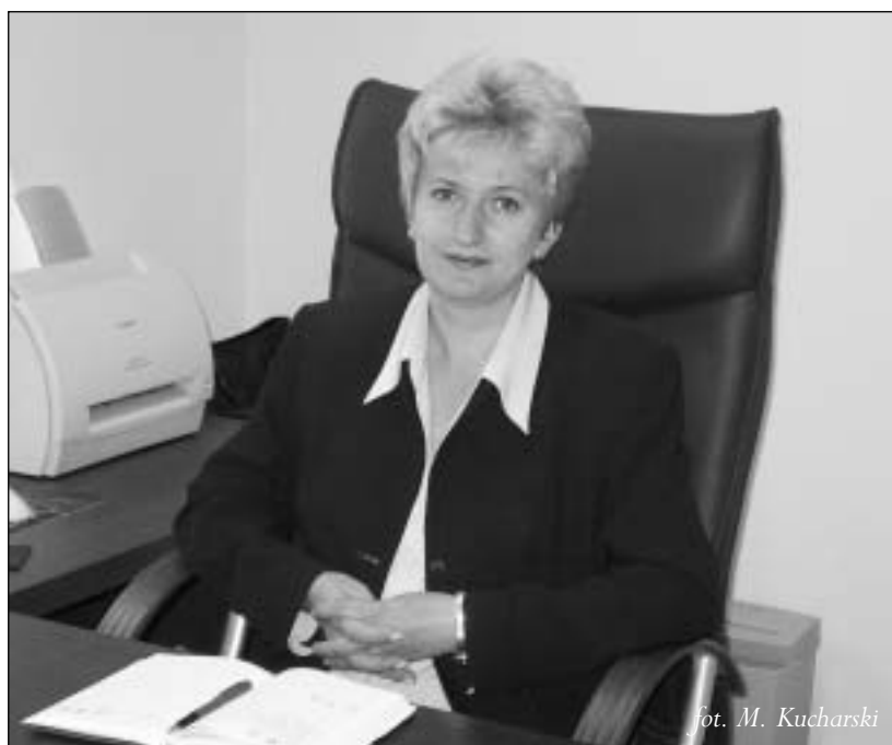
fol. M. Kucharski

Szkoła jest bogato wyposażona. Oprócz tradycyjnych klas, mamy nowoczesnie wyposażone pracownie: informatyczną, multimedialną-językową, fizyczną, chemiczną, biologiczną i techniczną. Do dyspozycji uczniów jest także nowoczesna hala sportowa, siłownia, sala rehabilitacyjna, biblioteka, świetlica, stolówka i zespół boisk. Uczniowie ob-