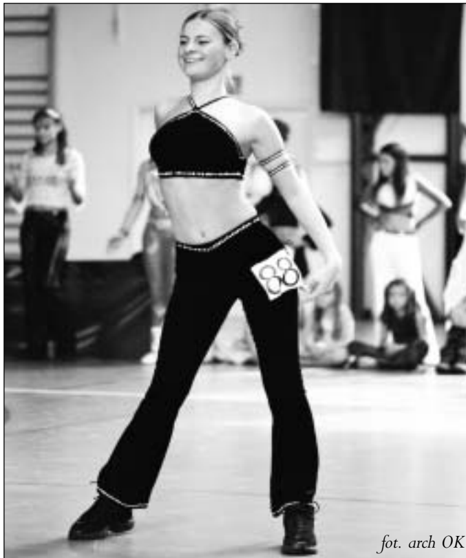
fol. arch OK

Więcej informacji o Grawitacji znajdą Państwo na stronie www.grawitacja.akcja.pl