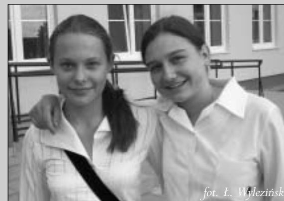
fol. L. Wyleziński

Fajny piknik! Dobrze, że nie zanudzano nas zbyt długimi apelami, tylko zorganizowano grilla, napoje i muzykę dla młodzieży. Niestety, zaraz trzeba będzie zmykać, bo nadciągają chmury i chyba lunie. Szkoła jest w porządku, bardzo ładna. Tylko kolor jakiś taki... Wolalibyśmy szary albo zielony, ale dziewczynom ten się chyba podoba. Mamy też nadzieję, że już niedługo będzie gotowe boisko do nogi, bo na razie nie widzę bramek.