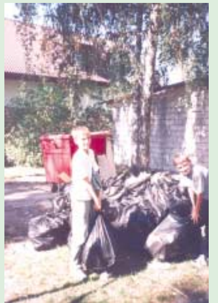
szkoła otrzyma od gminy nagrodę rzeczową - sprzęt audio-wideo.

Najwięcej śmieci w czasie trwania akcji zebrali uczniowie Szkoły Podstawowej z Zalesia Górnego i zgodnie z obietnicą