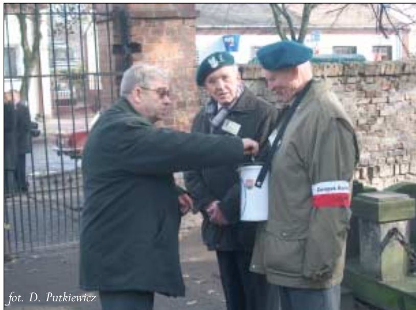
fol. D. Putkiewicz

W trzech minionych latach, dzięki bardzo dobrej ocenie naszej pracy na rzecz przywrócenia porządku i przejawu gospodarności na cmentarzu uzyskiwaliśmy na każdej kweście coraz lepszy wynik, lecz tym razem osiągnęliśmy wynik słabszy, gdyż dwudniowe w tym roku święto rozłożyło możliwości pozyskania środków na dwa dni, a chętnych do kwestowania starczyło tylko na jeden dzień.