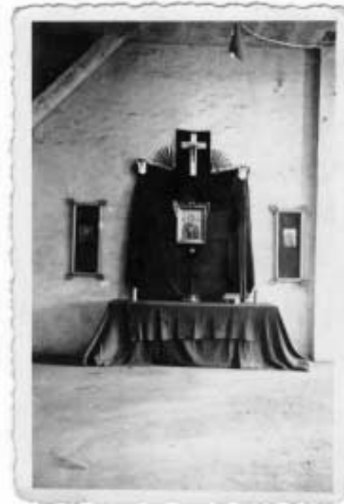
Ołtarz wielkanocny z kocy i papieru. Stalag Mitterberghütten

Zapewniając Cię Ojcie Święty o naszej dalszej służbie Bogu, Ojczyźnie i Narodowi łączymy się z Tobą w modlitwie oraz gorąco prosimy o błogosławieństwo dla całej rodziny 36 pułku piechoty Legii Akademickiej, skupiającej nie tylko żyjących żołnierzy pułku oraz ich rodziny, lecz także rodziny naszych poległych i zmarłych towarzyszy broni.”