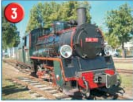
3 Niewątpliwą atrakcją turystyczną gminy jest wąskotorowa kolej, która jeździ na trasie Piaseczno - Głosców - Tarczyn - Grójec. Trasa prowadzi przez malownicze okolice, po równinnym terenie z rozległymi sadami owocowymi, kompleksami stawów, dolinami rzek: Jeziorki, Kraski, Lubiczki i Pilicy.

www.kolejka-piaseczno.com Piaseczno, ul. Sienkiewicza 14 tel: 756-76-38