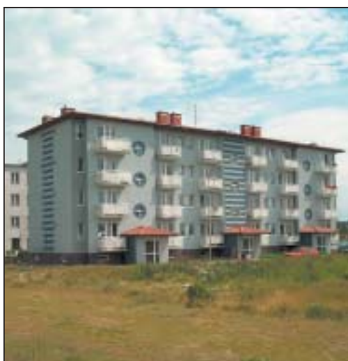
Władze gminy z myślą o najuboższych mieszkańcach oraz rewitalizacji centrum Piaseczna realizują program budowy tanich mieszkań socjalnych na obrzeżu miasta.

Zalesie Dolne i położone bardziej na południe Zalesie Górne to ciekawe przykłady pracy przedwojennych urbanistów. W latach dwudziestych XX wieku pod Warszawą chętnie lokowano osiedla letniskowe. O Zalesiu Górnym pisano nawet, że posiada charakter uzdrowiskowy. W obu osiedlach zachował się resztki dawnych założeń urbanistycznych: duże działki, które nie miały być dzielone, szerokie aleje oraz duża część terenów zarezerwowanych na ogólnodostępne parki leśne i inne cele publiczne.