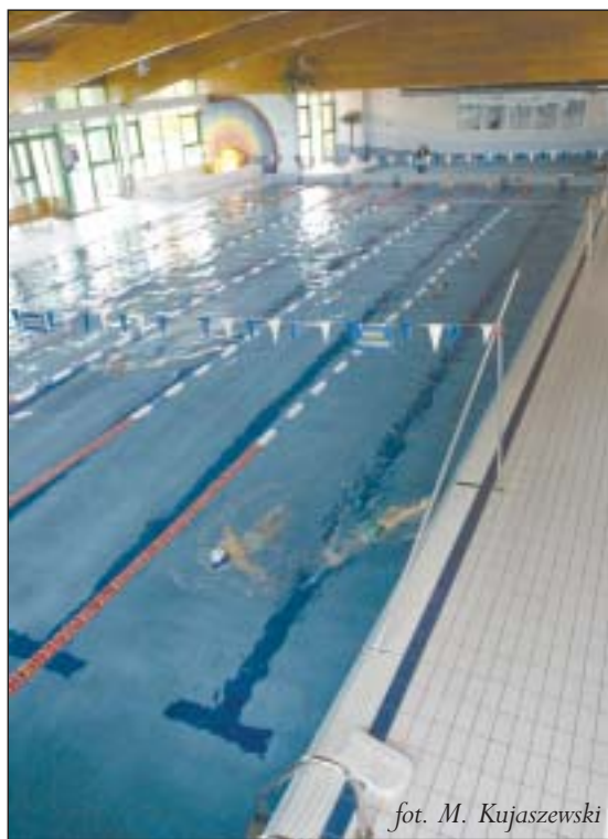
fol. M. Kujaszewski

Piaseczno, ul. Sikorskiego 20 tel. 750 61 30 www.gosir-piaseczno.pl info@gosir-piaseczno.pl