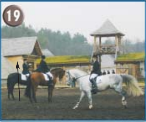
19 Stajnia Chojnów Jazda konna dla początkujących i zaawansowanych, śluby, kuligi, pikniki, przejażdżki powozami, imprezy zlecone, pensjonat dla koni i sprzedaż koni. Kryta ujeżdżalnia 24x80 m, kryta karuzela dla koni, solarium i zaplecze rekreacyjne, restauracja. tel. 736 28 78, 736 28 17, tel. kom. 506 030 150 Solec 72, 05-532 Baniocza

18 Klub Jeździecki „Szumawa” Jazda konna dla początkujących i zaawansowanych, śluby, kuligi, pikniki, przejażdżki powozami, imprezy zlecone, pensjonat dla koni i sprzedaż koni. Bobrowiec, ul. Mazowiecka 79, 05-502 Piaseczno szumawa@szumawa.com.pl, www.szumawa.com.pl tel. 756 81 39, tel. kom. 0 602 709 312