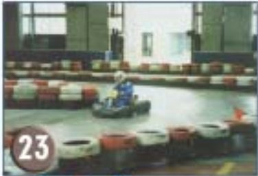
23 Imola - Hala Wycigów Gokartowych kontakt: tel. / fax.: 757-08-92, 757-08-23 adres: ul. Puławska 33, 05-500 Piaseczno www.imola.pl