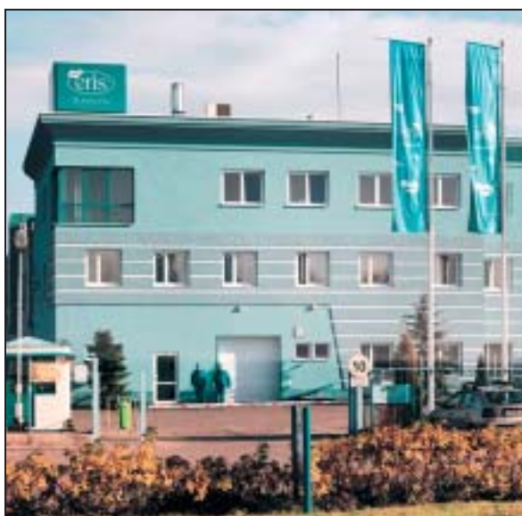
Firma kosmetyczna Dr Irena Eris jest przykładem rodzimego przedsiębiorstwa, które wypromowało swoje produkty na europejskich rynkach.

oraz o największej liczbie przedsiębiorstw, które zainwestowały w Polsce ponad milion dolarów. Dzięki temu gmina Piaseczno ma jeden z najwyższych wskaźników dochodu na mieszkańca wśród miast o podobnej wielkości, a wskaźnik bezrobocia należy do najniższych w kraju.