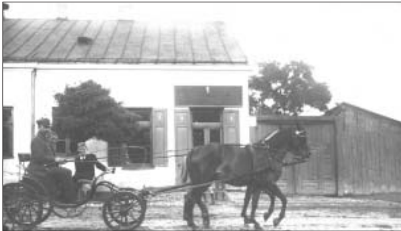
Apteka przy ul. Pulawskiej - 20-lecie międzywojenne

skich, a także faktycznych i symbolicznych mogił uznawanych powszechnie za miejsca pamięci narodowej. Miejsca pamięci narodowej w gminie Piaseczno dotyczą okresów szczególnie ważnych dla dziejów Polski: powstania styczniowego 1863 r., odzyskania niepodległości w 1918 r., II