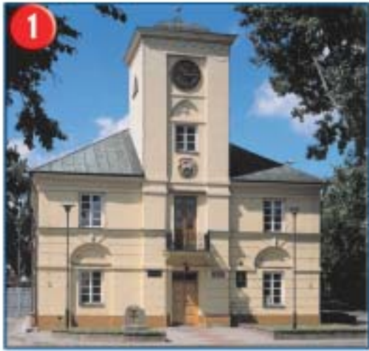
1 Ratusz z poł. XIX w. jest jednym z głównych zabytków architektonicznych centrum miasta.