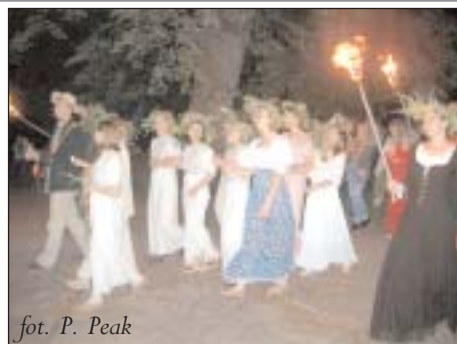
fol. P. Peak

To odbywająca się od kilku lat w czerwcu „mieszanka” plenerowych przedstawień teatralnych i folkowych koncertów muzycznych zakończona świętojankami - inscenizacją nawiązującą do ludowych obchodów nocy sobótkowej.