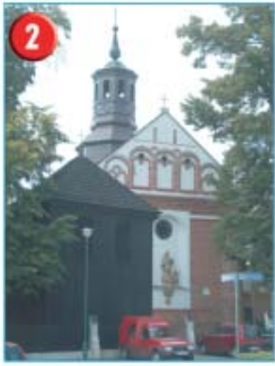
2 Kościół św. Anny wzniesiony ok. 1550 r. odrestaurowany po wojnach szwedzkich w 1736 r. posiada cechy późnogotyckie. Kościół jest najstarszym i najbardziej okazałym zabytkiem architektonicznym Piaseczna. Wewnątrz barokowy wystrój oraz cenne religijne rzeźby i malowidła.