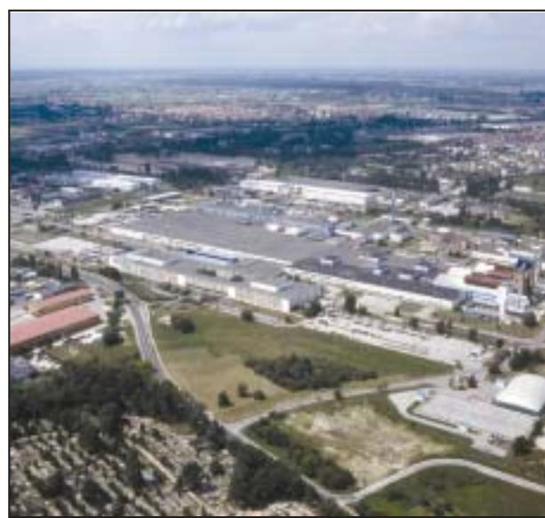
Thomson zatrudniający ponad 3,5 tys. pracowników jest jednym z największych producentów kineskopów w Europie.