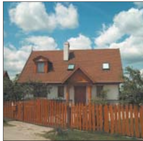
Na południu gminy większość terenów budowlanych przeznaczonych jest pod budownictwo jednorodzinne.

należy do gmin przeznaczających najwięcej funduszy na rozwój infrastruktury, przede wszystkim wodociągów i kanalizacji. W tym roku ponad 30 proc. gminnego budżetu wynoszącego 143 mln zł przeznaczonych jest na zadania inwestycyjne. Przy realizacji części z nich gmina korzysta z funduszy unijnych. Gmina intensywnie rozbudowuje też sieć szkół podstawowych i gimnazjów. Tak więc Piaseczno jest w stanie zaoferować przyszłym mieszkańcom wygodne warunki pracy człowiekowi otoczeniu bez utraty i życia w przyjaznym walorów dużego miasta.