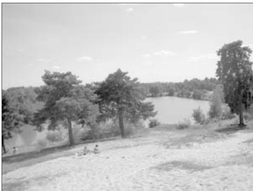
Górki Szymona - teren rekreacyjny w Zalesiu Dolnym

Więcej informacji w dziale przyroda na stronie internetowej www.gmina-piaseczno.pl