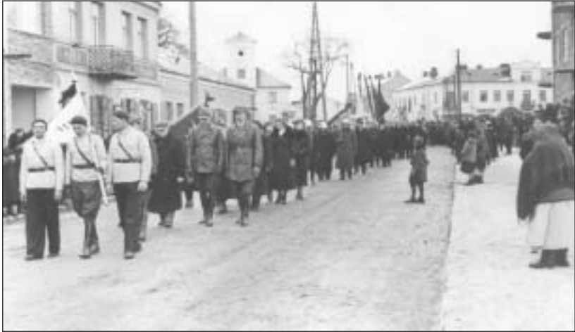
ul. Kościuszki, w tle Ratusz - 20-lecie międzywojenne

Miasto i okolice Piaseczna bogate są w miejsca pamięci ważnych historycznych wydarzeń. Na terenie miasta i gminy Piaseczno znajduje się kilkadziesiąt pomników, tablic pamiątkowych kwater żołnierzy