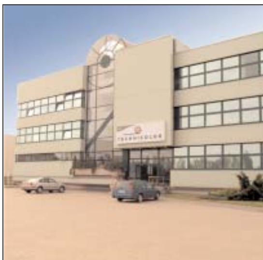
Legendarna firma Technicolor zainwestowała do tej pory w Piasecznie 85 mln euro. Obecność takich firm jak Thomson, Technicolor i Energis sprawia, że gmina staje się centrum produkcji hi-tech.

chu, linii kolejowych i planowanej autostrady A2.