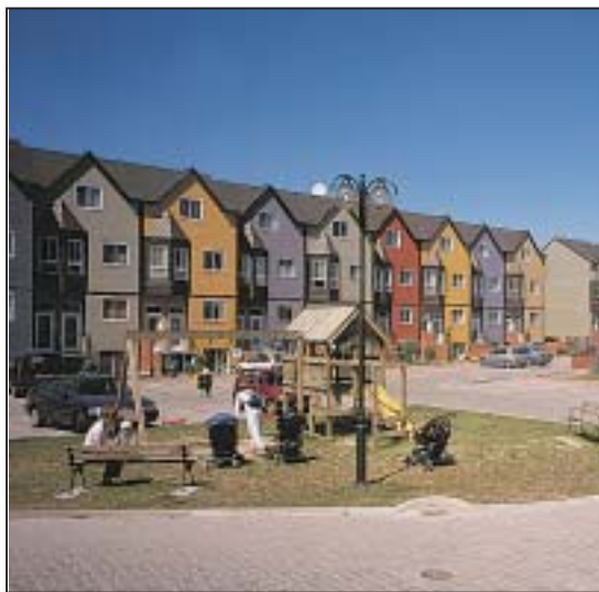
W północnej części gminy powstają nowoczesne wielorodzinne osiedla mieszkaniowe.