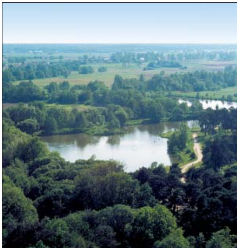
Dolina rzeki Jeziorki

Piaseczno cieszy się ogromną popularnością wśród mieszkańców aglomeracji warszawskiej chcących uciec od zgiełku wielkiego miasta. Na północy gmina graniczy z Lasem Kabackim, a na południu z terenami Chojnowskiego Parku Krajobrazowego, który wraz ze strefami chronionego krajobrazu zajmuje ponad jedną trzecią powierzchni gminy. Dawne tereny rolnicze stopniowo przekształcają się w zespół zacisznych i nowoczesnych osiedli podmiejskich. Władze gminy, przygotowując kolejne plany zagospodarowania przestrzennego, tworzą wygodne warunki dla inwestorów zainteresowanych budową zarówno rezydencji, domów jednorodzinnych, jak i budynków wielorodzinnych. Mieszkańcy Piaseczna i okolic korzystają również z bo-