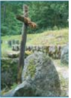
4c Zabytkowy cmentarz parafialny w Piasecznie przy ul. Kościuszki.

www.kolejka-piaseczno.com Piaseczno, ul. Sienkiewicza 14 tel: 756-76-38