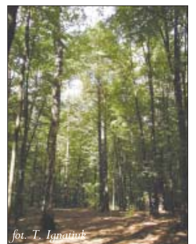
fol. T. Ignatuk

Rezerwat Uroczysko Stephana patrz mapka strony 4,5