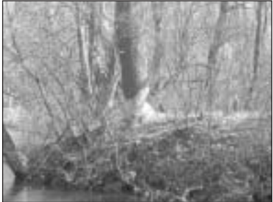
Ostoja bobrów nad rzeką Jeziorką

W południowej części gminy rozciągają się duże kompleksy leśne Chojnowskiego Parku Krajobrazowego, które zajmują wraz ze strefą ochronną 5089,5 ha. Chojnowski Park Krajobrazowy powołany