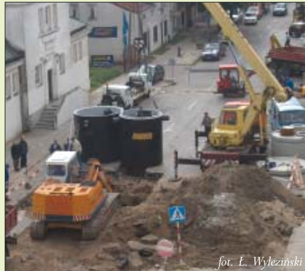
fol. Ł. Wyleziński