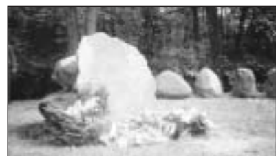
Pomnik upamiętniający walkę żołnierzy NSZ na Zimnym Dole

Modlitwa ta odmawiana była w okresie konspiracji przed każdą zbiórką i akcją.