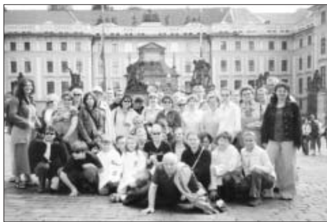
Uczestnicy wyjazdu na Hradczanach

Do jednego z najbardziej znanych polskich sanktuariów wybraliśmy się 30 sierpnia. Wyjazd ten miał charak-