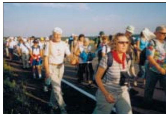
Grupa polsko-ukraińska na trasie pielgrzymki

Dziękujemy również ofiarnym siostrą pasterzankom z Piaseczna za smaczną zupę