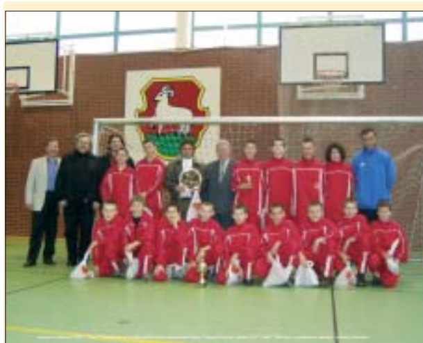
LKS „Perła” Złotokłos, gospodarze turnieju w komplecie