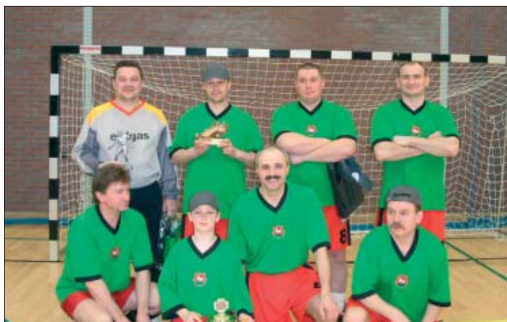
Drużyna radnych i przyjaciół gminy Piaseczno wygrała kolejny turniej w halowej piłce nożnej. Najpierw 14 lutego zdobyła trofeum w Turnieju o Puchar Burmistrza Miasta i Gminy Piaseczno. Tym razem ich łupem padł Puchar Wójta Gminy Nadarzyn. Gratulujemy! Czekamy na kolejne zwycięstwa! Redakcja.

PTTK Oddział w Piasecznie, Plac Piłsudskiego 3. Tel. /fax 756 78 57