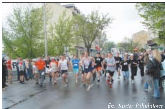
W samo południe rozpoczęła IV Mazowiecka Milla Konstytucyjna