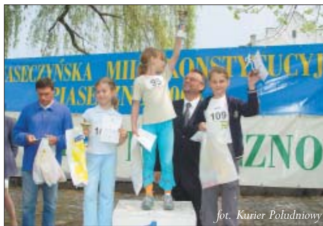
fol. Kurier Południowy

W biegu wystartowało 135 zawodników w różnych kategoriach wiekowych oraz seniorzy w kategorii OPEN.