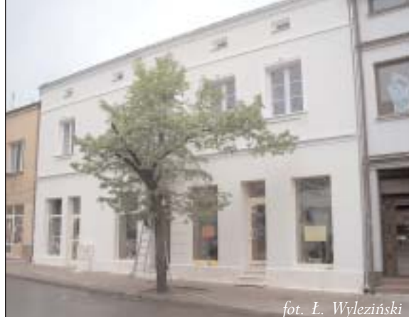
W 2002 roku Rada Miejska podjęła uchwałę, która zwalnia z podatku od nieruchomości na okres pięciu lat właścicieli nieruchomości w centrum Piaseczna przy ulicach: Puławskiej, Sienkiewicza, Kościuszki, Sierakowskiego, Warszawskiej, Kilińskiego i pl. Piłsudskiego w zamian za wykonanie modernizacji elewacji budynków. W zakres prac remontowych wchodzi: wymiana rynien i rur spustowych, wymiana stolarki okiennej i drzwiowej oraz remont ścian elewacji.

Wygląd naszych głównych arterii w mieście w dużej mierze zależy od właścicieli nieruchomości położonych w centrum. Remontując swoje kamienice, mogą oni skorzystać ze zwolnienia z podatku od nieruchomości na okres pięciu lat. Przy ulicy Kościuszki dwie kamienice cieszą oko przechodniów odnowionymi elewacjami. Zachęcamy do naśladownictwa.