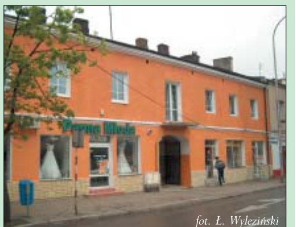
Miasta i Gminy w Piasecznie określając kolorystykę, jak również rozwiązania architektoniczne planowanego remontu, uproszczony kosztorys budowlany określający wartość planowanych robót oraz oświadczenie stwierdzające, że uzyskane fundusze ze zwolnienia podatkowego będą wykorzystane na remont i modernizację elewacji budynku.

Zawieszenie płatności podatku uzyskać można z chwilą przedstawienia uproszczonego kosztorysu powykonalnego i potwierdzenia wykonania robót przez inspektora budowlanego Urzędu Miasta. Wniosek o zwolnienie z podatku od nieruchomości złożyć należy w wydziale finansowym UMiG. Do wniosku załączyć należy: dokument potwierdzający własność nieruchomości, pozytywną opinię wydziału architektury i urbanistyki Urzędu