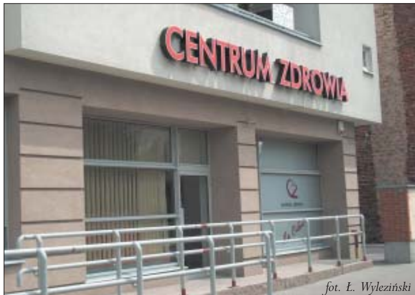
fol. L. Wyleziński

Od zeszłej soboty w Piasecznie przy ulicy Czajewicza 5/7 działa nowa niepubliczna przychodnia lekarska.