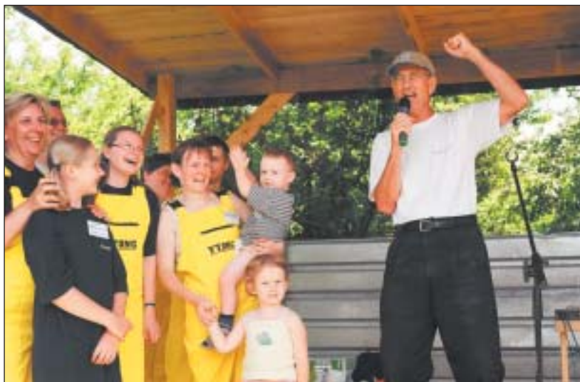
Millard Fuller - założyciel Habitatu - wraz z rodzinami, które w lipcu wprowadzą się do pierwszego domu.