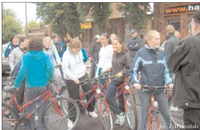
fol. Ł. Wyleziński

W przyszłym roku do Szwecji pojedzie piaseczyńska grupa, jednak szwedzkim trenerom tak spodobało się w naszej gminie, że postanowili przyjechać do nas na zgrupowanie za rok niezależnie od międzygminnej wymiany.