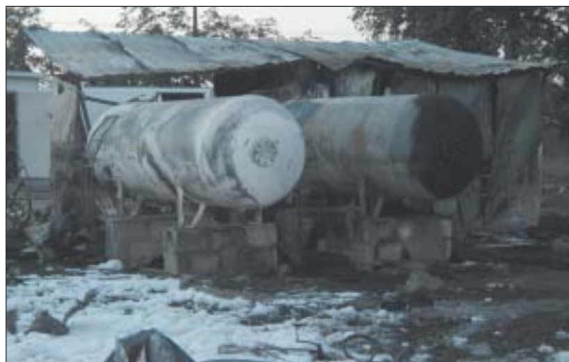
Pogorzelisko po stacji autogazu