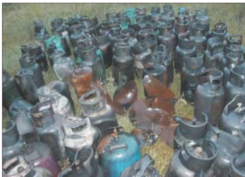
Niektóre butle z propanem-butanem eksplodowały, a ich odłamki przelatowały nad głowami strażaków na odległość 100 metrów.

Pierwszy podmuch wybuchu przewrócił obydwo. Musieli się wycofać, by ponownie podjąć próby gaszenia zbiorników, ale już z działka samochodu, którego zasięg jest większy. W ten sposób, podając pianę gaśniczą, czekali na inne jednostki, które dojeżdżały, by wesprzeć kolegów. Były to jednostki z Ochotniczej Straży Pożarnej gminy i powiatu. Między innymi strażacy z: OSP Wągorodno, OSP Piaseczno, OSP Tarczyn, OSP Chojnów, OSP Jazgarzew, OSP Prace Małe, OSP Czaplina, OSP Bogatki, OSP Czaplina i OSP Wola Wągorodzka. Poza wymienionymi jednostkami przybyło jeszcze wiele za-