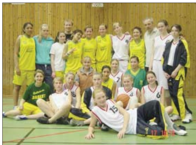
Wspólne zdjęcie dziewczęcych drużyn koszykówki ze Szwecji i Piaseczna