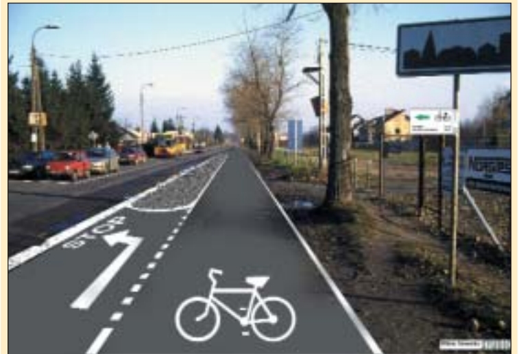
Skrzyżowanie ulicy Chyliczkowskiej, skręt w kierunku ulicy Julianowskiej. Tak wygląda skrzyżowanie dziś (zdjęcie u góry), a tak mogłoby wyglądać (zdjęcie niżej).

Stąd wniossek, że zamiast kosztownych inwestycji wywołujących w dodatku niepotrzebne konflikty na większości ulic wystarczy spokojnie ruch, instalując odpowiednie urządzenia. W tym miejscu od razu muszę zaznaczyć, że oprócz zniechęconych przez wszystkich (i słusznie!) „hopek” istnieje prawie 20 innych sposobów uspokojenia ruchu, nie tak przykrych dla pojazdów i kierowców, za to o wiele skuteczniej ograniczających prędkość. Wybrane urządzenia powinny być przyjazne zarówno dla rowerzystów, jak i autobusów miejskich.