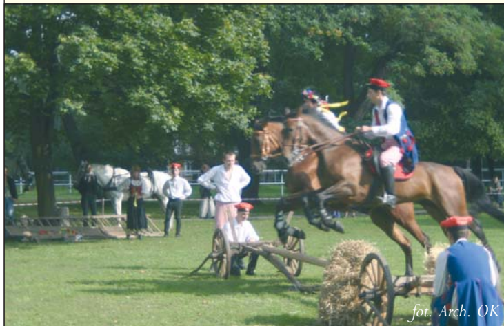
Zeszloneczne pokazy konne TKKF Hubert z Warszawy