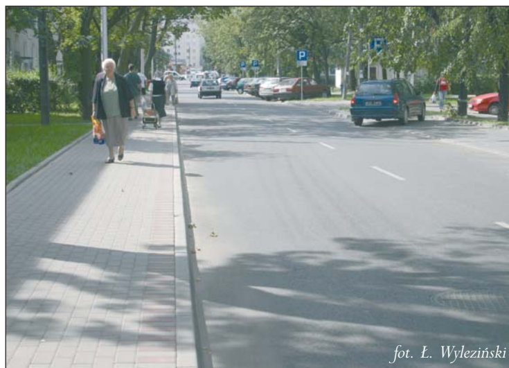
fol. Ł. Wyleziński