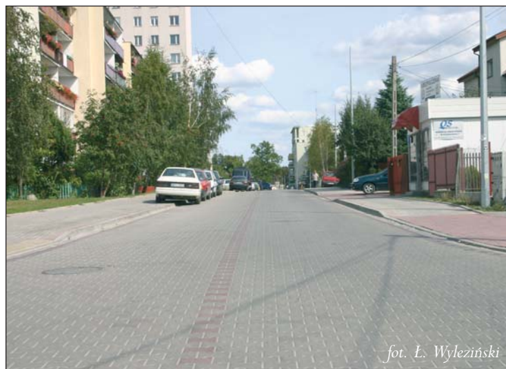
fol. Ł. Wyleziński

► ul. Czajewicza na odcinku od Sienkiewicza do Gerbera - prace o wartości 860 tys. zł wykonywa-