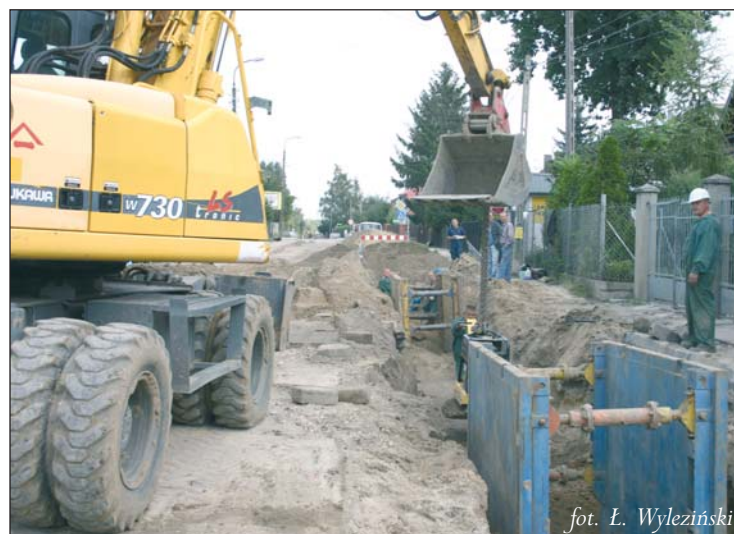
fol. Ł. Wyleziński