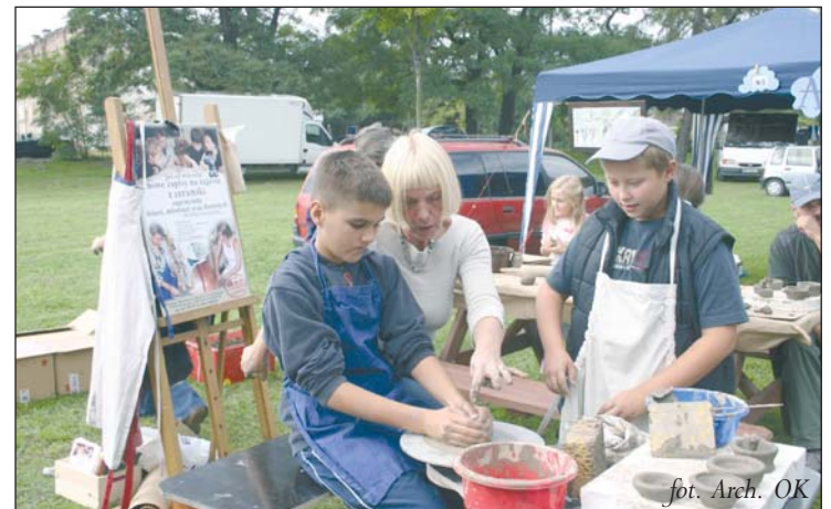
Podobnie jak w zeszłym roku będzie można uczestniczyć w warsztatach ceramicznych