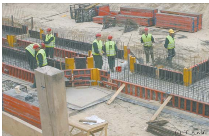
Prace przy budowie oczyszczalni ścieków w Piasecznie

w Ministerstwie Środowiska, Wiesława Ryciak - ekspert w departamencie realizacji przedsięwzięć