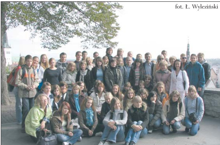
Wspólne pamiątkowe zdjęcie na tallińskiej starówce

W trakcie blisko tygodniowego pobytu gospodarze przygotowali bardzo interesujący program, który obejmował m.in. zwiedzanie nadmorskiej gminy Harku, najciekawszych miejsc w pobliskim Tallinie, a także wycieczkę promową do stolicy Finlandii - Helsinek. Pobyt został zaaranżowany w ten sposób, aby jak najwięcej czasu nasza młodzież spędziła wspólnie ze swoimi rówieśnikami z Estonii. Jednym z punktów programu był konkurs wiedzy na temat Unii Europejskiej zorganizowany w szkole, gdzie przeprowadzone zostały też wspólne zajęcia sportowe na sali gimnastycznej oraz na basenie.