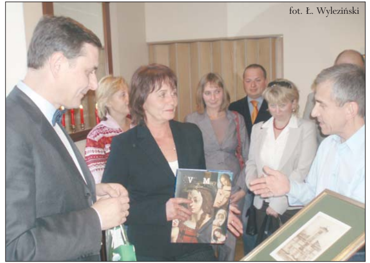
Grupa z Piaseczna złożyła wizytę w Ambasadzie RP w Tallinie

Wizyta młodzieży gimnazjalnej oraz licealnej wraz z oficjalną delegacją z Urzędu Miasta zorganizowana na koszt naszych partnerów z Estonii była współfinansowana ze środków Unii Europejskiej dzięki