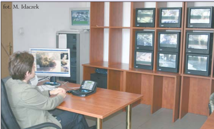
Centrum zarządzania monitoringiem w Komendzie Powiatowej Policji

System umożliwia natychmiastową reakcję na zdarzenia lub odtwo-