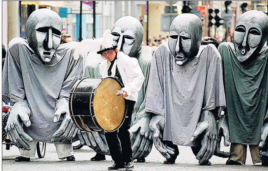
Teatr Klinika Lalek

włóczęgów, nomadów, którzy przemierzając kontynenty, ogrzewają dusze wspomnieniami duchowego czy etycznego, niebiańskiego czy geograficznego, prawdziwego czy urojonego domu. Jego symbolem w spektaklu jest wielki uskrzydłony statek - wielopoziomowa, ruchoma scena, kolejne wcielenie Arki Noego, która, gdy przymkniemy powieki, może przeobrazić się w łódź Eneasa, Mayflower czy skleconą z gumowych pontonów kubańską tratwę dryfującą ku