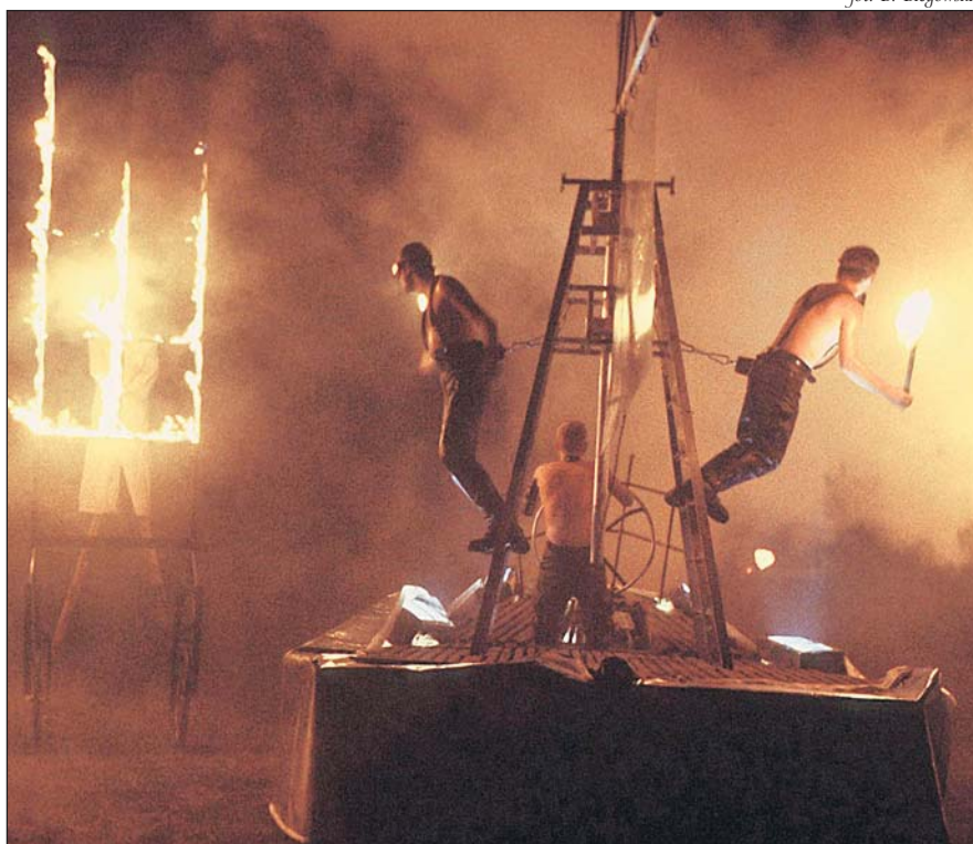
Teatr Ósmego Dnia zaprezentuje w Piasecznie spektakl pt. „Arka”