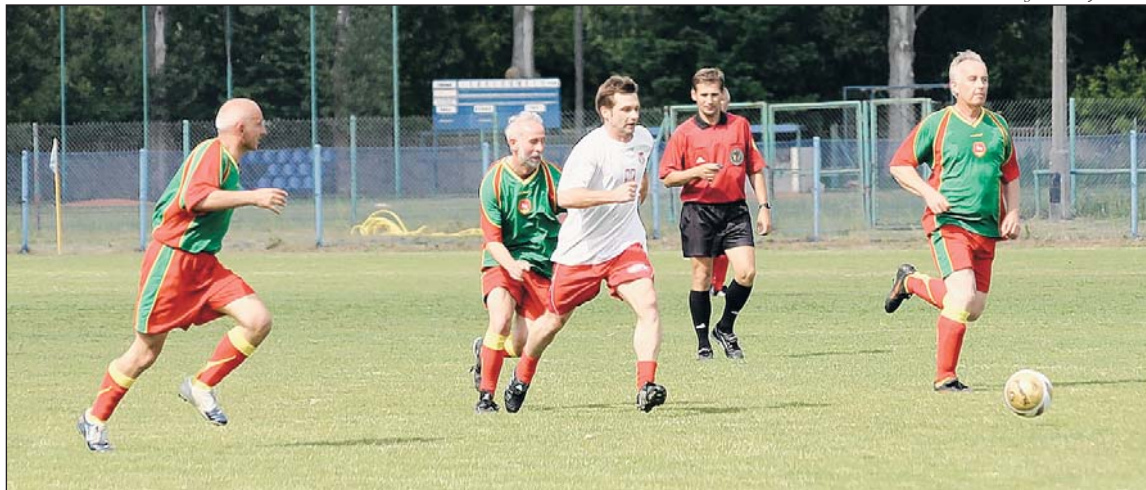
Drużyna Orłów Górskiego wciąż prezentuje znakomity poziom sportowy o czym przekonała się reprezentacja Piaseczna

Spotkanie miało jednak charakter towarzyski i nie ilość straconych bramek ale dobra zabawa miały w tym dniu największe znaczenie. Piaseczyńskiej publiczności przypomnieli się dawni idole kadry Kazimierza Górskiego oraz inni znakomici gracze, którzy walczyli w reprezentacji Polski w mniej odległych czasach.