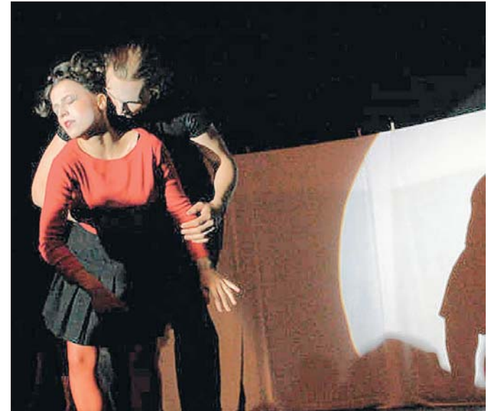
Piaseczyński Teatr Ruchu i Tańca MIN

Istnieje od dwóch lat. Grupa, łącząc w sobie tradycję i nowatorskie pomysły, odkrywa