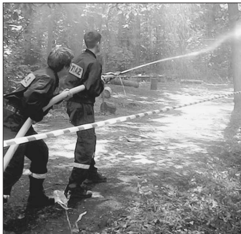
Jedna z drużyn w trakcie zawodów strażackich