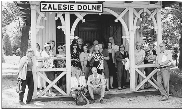
Pamiątkowe zdjęcie przed stacją kolei wąskotorowej w Zalesiu Dolnym

Idea miast ogrodów narodziła się w XIX wieku w Anglii. To koncepcja zakładania miast satelickich - osiedli oddalonych od centrum miasta - charakteryzujących się niską, luźną zabudową, a przede wszystkim znaczącym udziałem terenów zielonych (lasów, ogrodów, parków) w ogólnej powierzchni