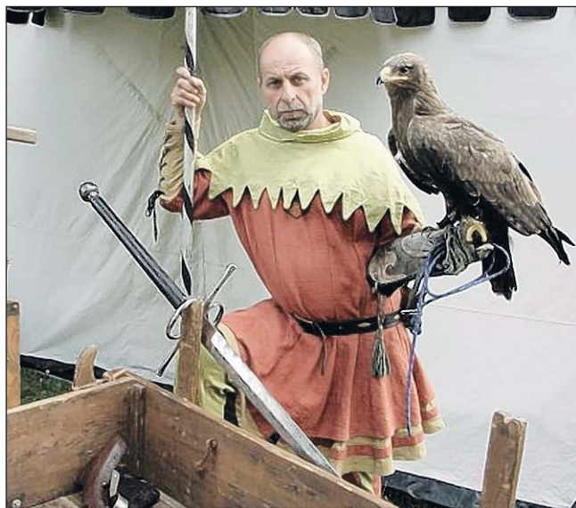
W niedzielę będzie można obejrzeć pokazy sokolników z Czech

W najbliższy weekend Park Miejski opanowany zostanie przez rycerzy. Osada rycerskiej szlachty i dam, pełna powiewających chorągwi i szpiczastych, gotyckich namiotów, drewnianych i stylowych szranków, zaprasza serdecznie do udziału w jarmarku średniowiecznym (około 20 kramów), gdzie oprócz możliwości zakupu rękodziełnictwa i replik, sprzętów charakterystycznych dla epoki średniowiecza, można będzie obserwować animacje wytwarzania licznych przedmiotów użytku codziennego i samemu wziąć udział w takich działaniach.