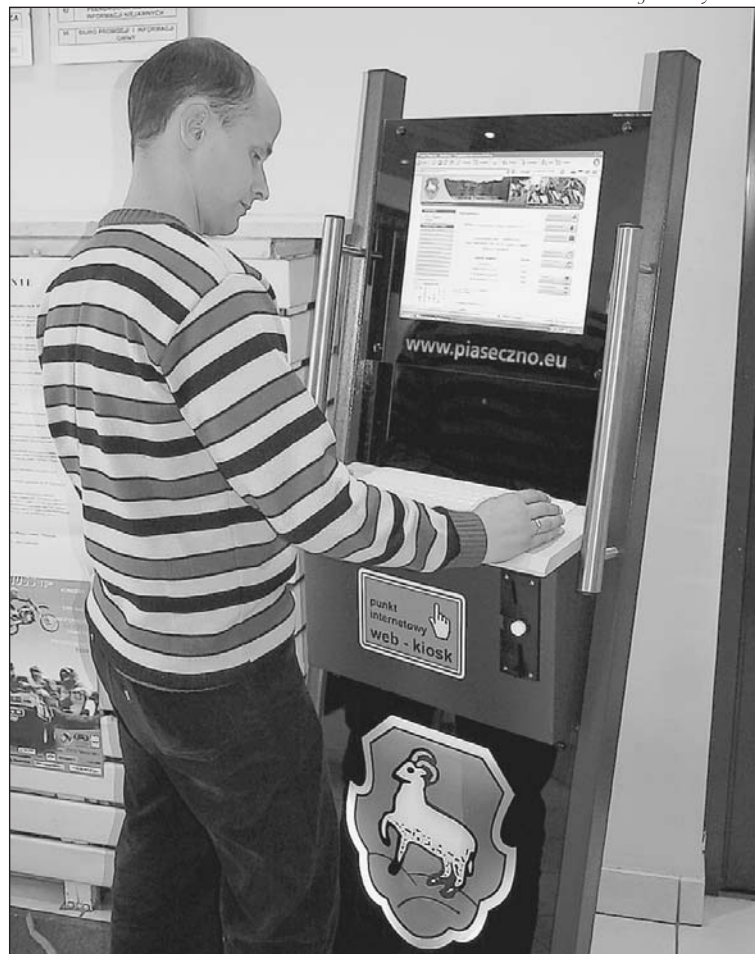
Na terenie gminy uruchomione zostały trzy kioski z bezpłatnym dostępem do internetu

Urządzenie jest wykonane w formie wolnostojącej na stalowym stelażu, który można przytwierdzić do podłoża.