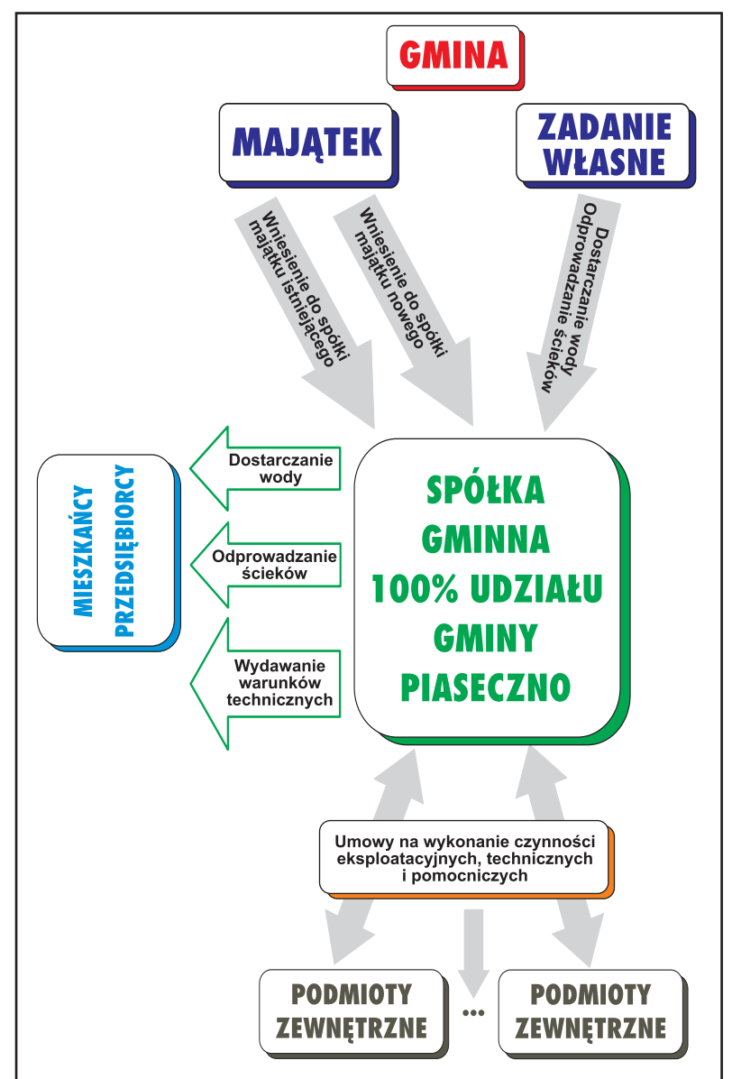
Nowy schemat sektora gospodarki wodno-ściekowej Gminy Piaseczno