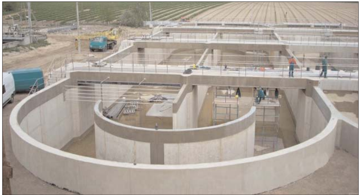
Przebudowa miejskiej oczyszczalni

Kolejną ważną korzyścią będzie możliwość amortyzowania przez spółkę posiadanego majątku i tworzenie przez nią własnego funduszu odtworzeniowego. Dotychczas eksploatacyjni nie mieli obowiązku in-