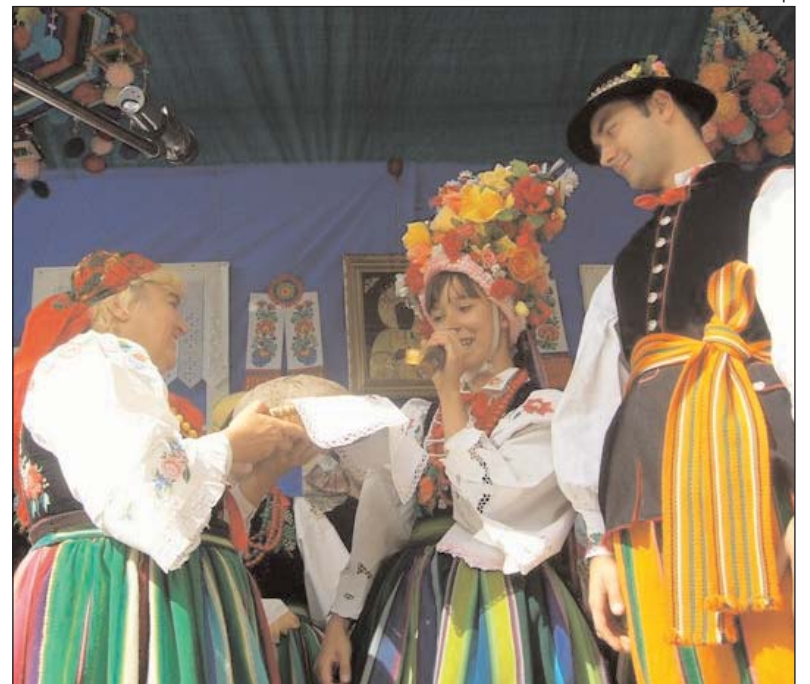
Rozpoczęcie zeszłorocznego Jarmarku