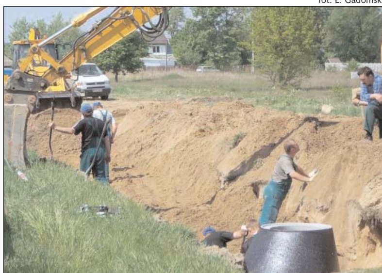
Rozbudowa gminnej sieci kanalizacyjnej