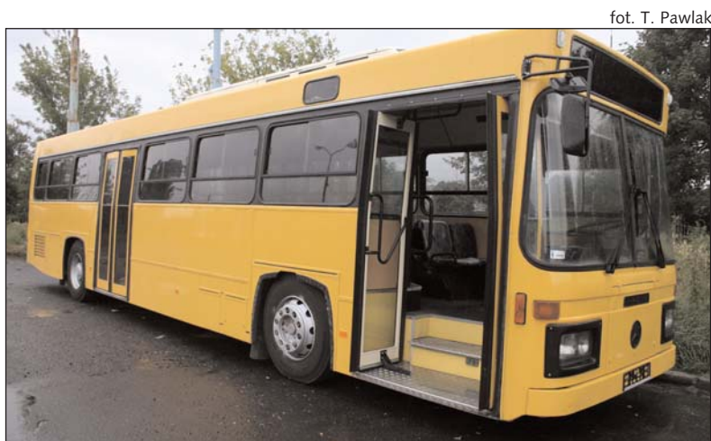
Nowe charakterystyczne autobusy linii Express Piaseczno

Ceny biletów: PKP Piaseczno - Warszawa Metro Wilanowska - 3 zł PKP Piaseczno - Warszawa Centrum - 4 zł Bilet miesięczny - 105 zł