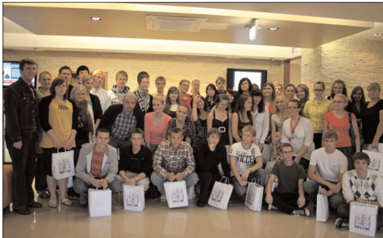
Grupa młodzieży z Harku w Estonii

U nas, mimo braku tak spektakularnych miejsc cennych przyrodniczo, Estończykom przypadły do gustu niebanalne możliwości spędzenia wolnego czasu. Dużych emocji dostarczyło im przejście linowym parkiem przygody, zwanym Małpim Gajem, w Zalesiu Górnym. Czas umilili sobie pływając