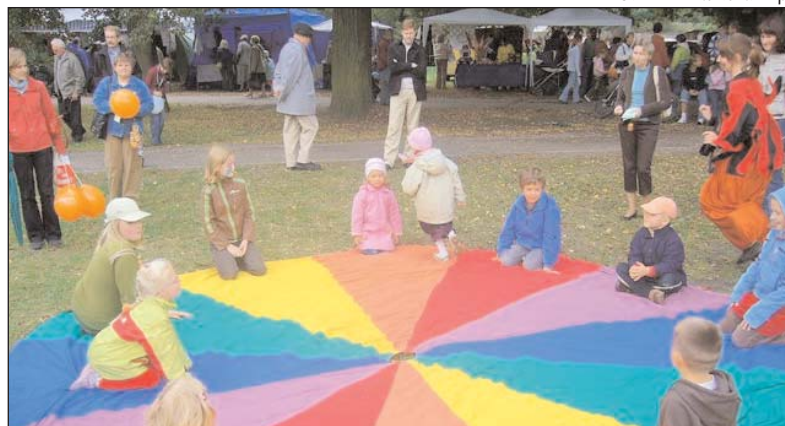
Na dzieci czeka mnóstwo atrakcji