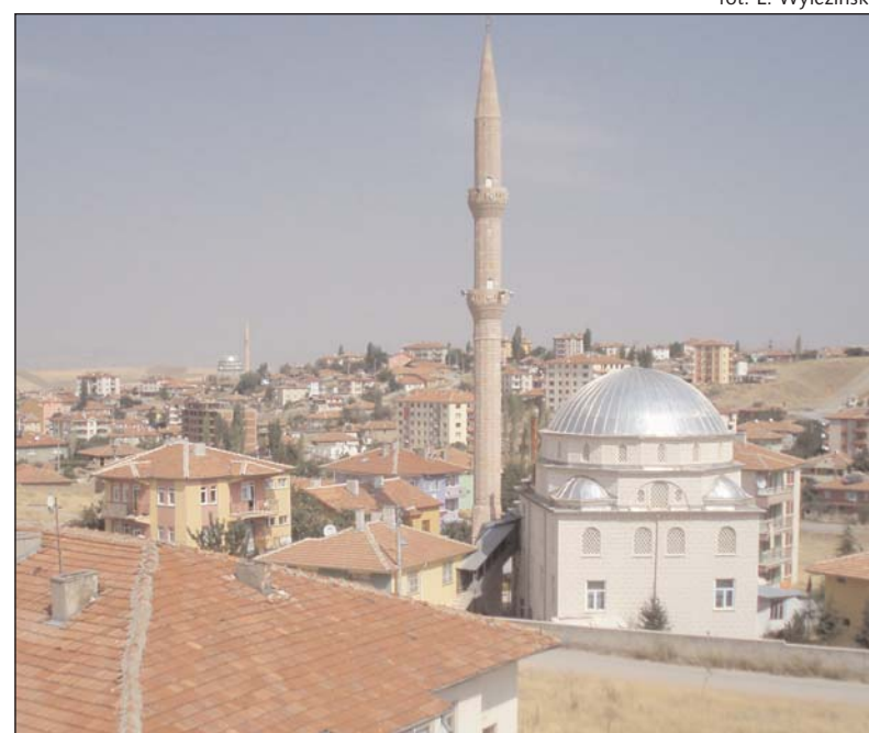
Widok na miasto Akyurt

Akyurt - to ponad 50 tysięczna miejscowość oddalona o 32 km od Ankary - stolicy Turcji. Akyurt pod