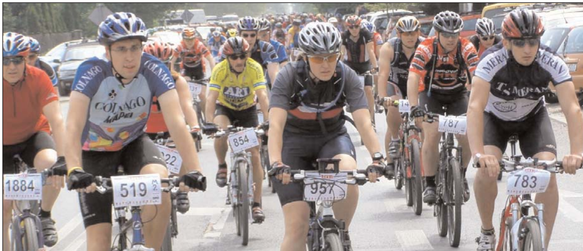
W zeszłorocznym maratonie wzięło udział blisko tysiąc osób

Już po raz czwarty powiat piaseczyński wraz z gminą Piaseczno zaprasza wszystkich amatorów jazdy rowerem na imprezę z cyklu Mazovia MTB Marathon. Zawody odbędą się w niedzielę 21 września. Start z polany położonej nad rzeką Jezioroką w Żabieńcu, skąd uczestnicy wyruszą na trasę biegnącą m.in. przez malownicze tereny Lasów Chojnowskich i powrócą na metę usytuowaną na stadionie KS Piaseczno przy ul. 1 Maja.