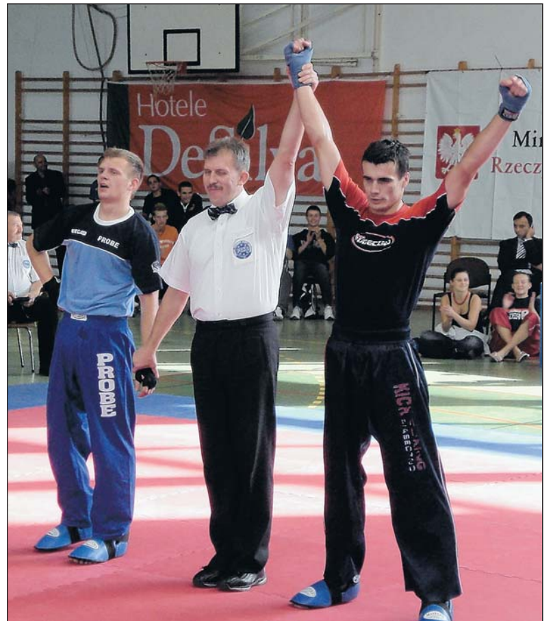
fol. M. Niziolek