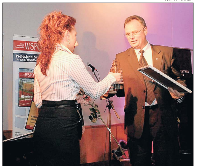
fol. T. Pawlak

Z pieniędzy na inwestycje Piaseczno najwięcej wydaje na budowę sieci kanalizacyjnej i oczyszczalni ścieków, następnie na inwestycje oświatowe oraz drogi. Budowane są także nowe budynki z mieszkańami socjalnymi.