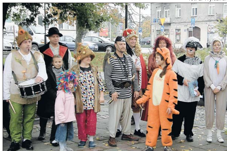
Teatr Rodziców „Gagatki Beatki Ojcowie i Matki”

„Księżniczkę na ziarnku grochu”, „Czarne Złoto”, „Zabawę w podróż”, „Siedmiu krasnoludków” oraz „Bajkę o smoku Niewawelskim”. Teatr Rodziców jest doskonałym przykładem na to, jak pasja może się przemienić w działalność, która przynosi uśmiech wielu chorym dzieciom. Teatr współpracuje z Fundacją Spełnionych Marzeń, która w ramach programu Dom Spełnionych Marzeń gości na tygodniowych turnusach dzieci z oddziałów onkologicznych. Dla uatrakcyjnienia pobytu oraz polepszenia nastrojów odbywają się wtedy przedstawienia przygotowane przez „Gagatki Beatki”.