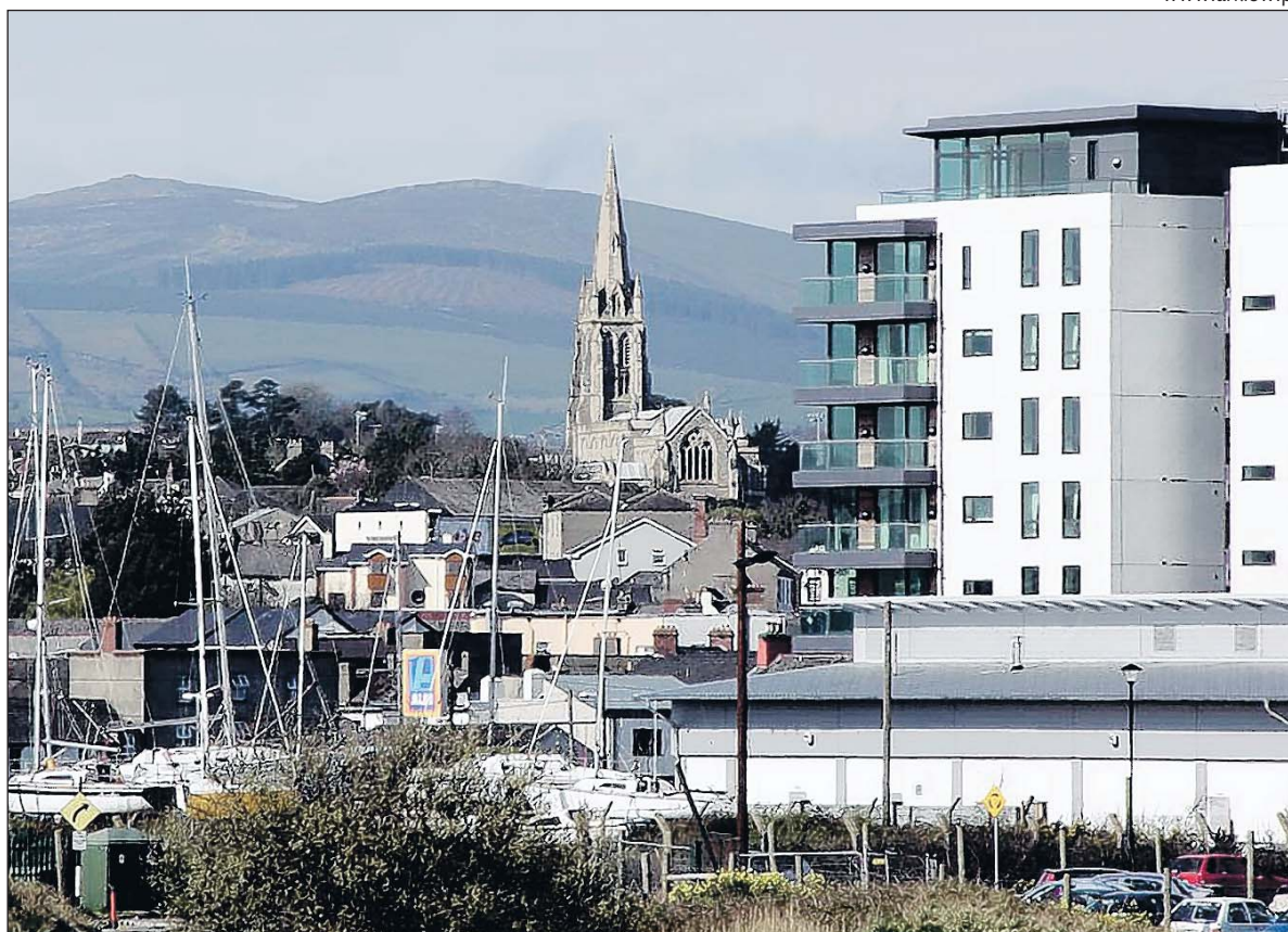
Arklow, miasto położone na wschodnim wybrzeżu Irlandii, należy do hrabstwa Wicklow. Liczbę mieszkańców szacuje się na 11 721 osób (według spisu ludności z 2006 roku), z czego około 700 to Polacy. Miasto przecina największa rzeka hrabstwa - Avoca.