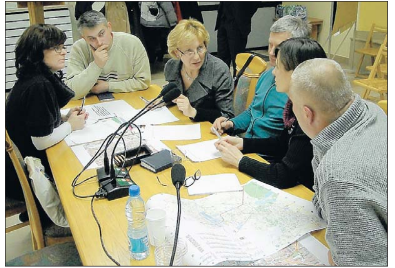
Warsztaty w grupach są jednym z elementów konsultacji społecznych

- Nie sztuką jest czytać raporty i sporządzać coraz to nowe plany, sztuką jest dotrzeć do naszych ambicji, o czym myślimy i jakie są nasze ideały - powiedział prowadzący spotkanie warsztatowe Huub Droogh Prezes RDH Architektki Urbańści, podkreślając tym samym wagę udziału społeczeństwa w procesach decydujących o przyszłości miejsca zamieszkania, pracy czy działalności pozazawodowej.