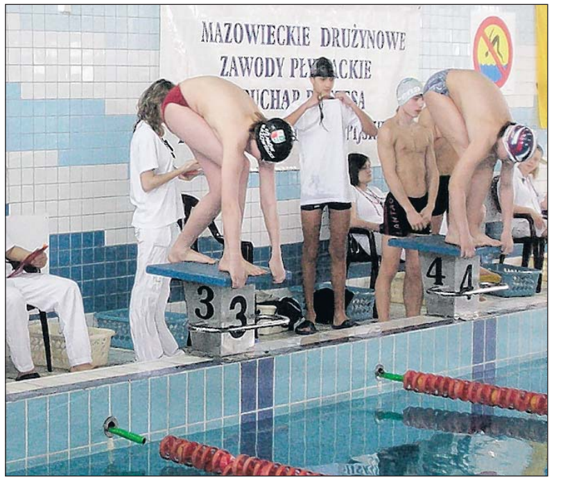
Piaseczno już trzeci raz rozgromiło drużynę z Lwowa

Na zaproszenie sekcji pływackiej Gminnego Ośrodka Sportu i Rekreacji w dniach 12-15 marca przebywała w Piasecznie grupa młodych sportowców, pływaków ze Lwowa. Pobyt przygotowali i zorganizowali rodzice piaseczyńskich zawodników przy wsparciu trenerów, GOSiR-u oraz władz miasta.