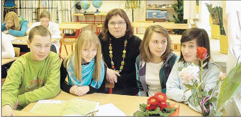
Zwycięska drużyna z Złotokłosu z opiekunem

Zawodnicy mieli do wykonania dwa zadania. Pierwsze, teoretyczne, polegało na rozwiązaniu testu złożonego z 25 pytań. 15 pytań dotyczyło szczegółowej wiedzy ekologicznej, przyrodniczej i geograficznej, natomiast zakres pozostałych obejmował