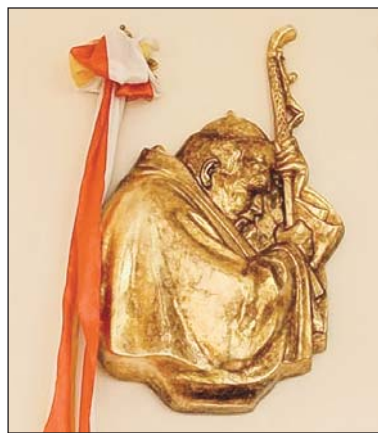
Popiersie Jana Pawła II w Gimnazjum nr 2

W poprzedniej edycji było 75 uczestników konkursu. Ilu gimnazja-