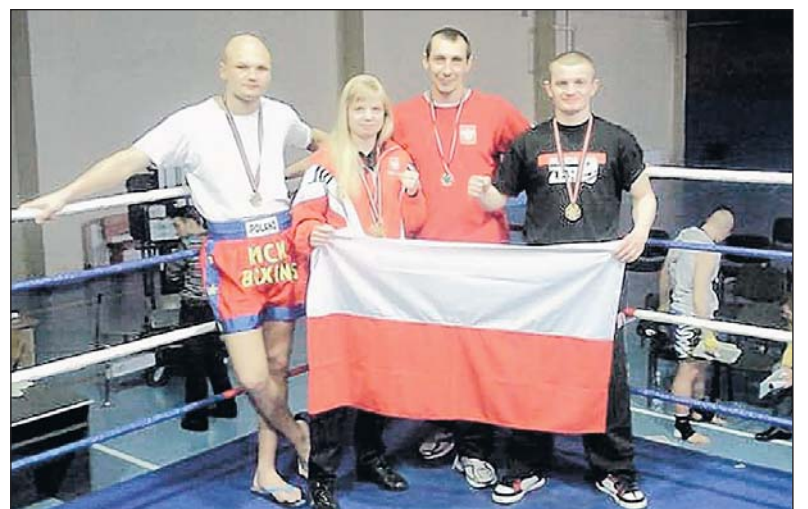
Złoci medalisci z Piaseczna

27 kwietnia godz. 12.00-15.00 - GIM 4 P-NO MISTRZOSTWA GMINY PIASECZNO GIMNAZJÓW W RINGO