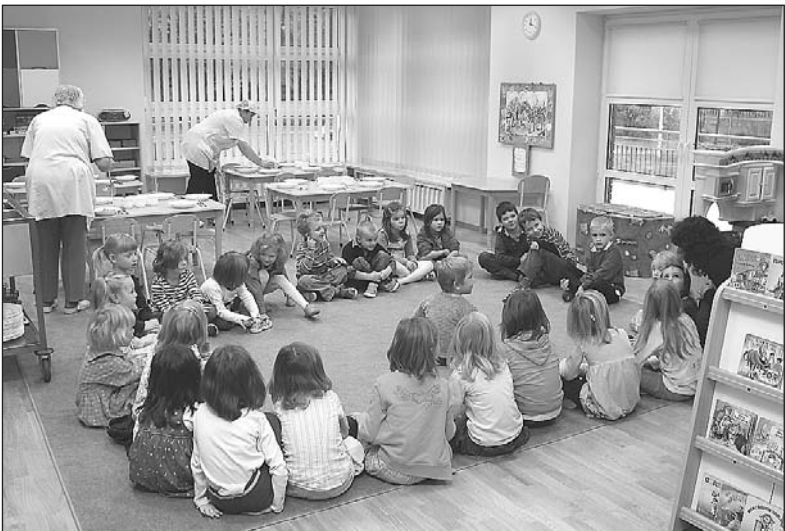
Zajęcia w przedszkolu w Zalesiu Górnym

wcześniej istniejącego obiektu dobudowany został dwupiętrowy budynek z czterema salami zajęciowymi, zapleczem sanitarnym, gospodarczym i magazynami. Znajduje się w nim również nowoczesna kuchnia z zapleczem wyposażonym w windę do transportu posiłków na piętro.