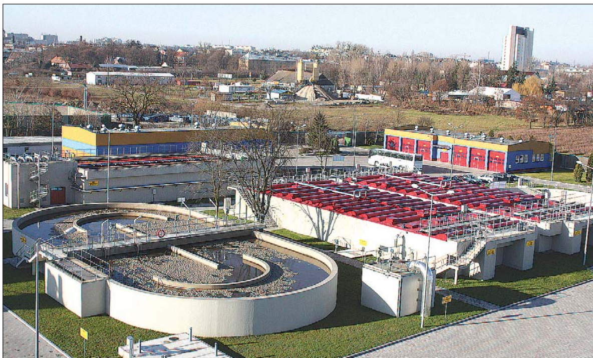
Nowa oczyszczalnia ścieków w Piasecznie

W pierwszej części spotkania przedstawiona została multimedialna prezentacja projektu, ukazująca ogrom inwestycji zilustrowanych zdjęciami. Goście mieli okazję dowiedzieć się więcej o zakresie inwestycji, metodach robót i oczekiwanych efek-