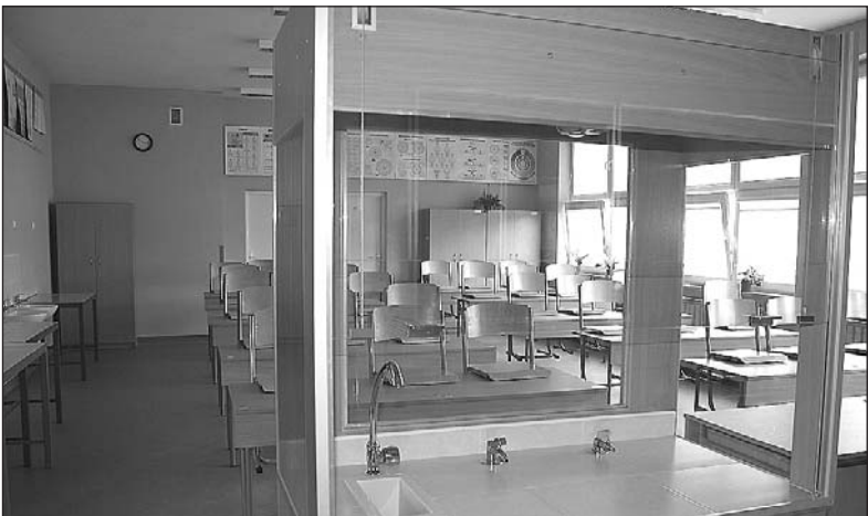
Pracownia chemiczna w gimnazjum w Gołkowie

na od holu składaną ścianką. W części południowej usytuowano 4 sale zajęciowe z łazienkami i magazynkami podręcznymi, a w części północnej znalazły się pomieszczenia