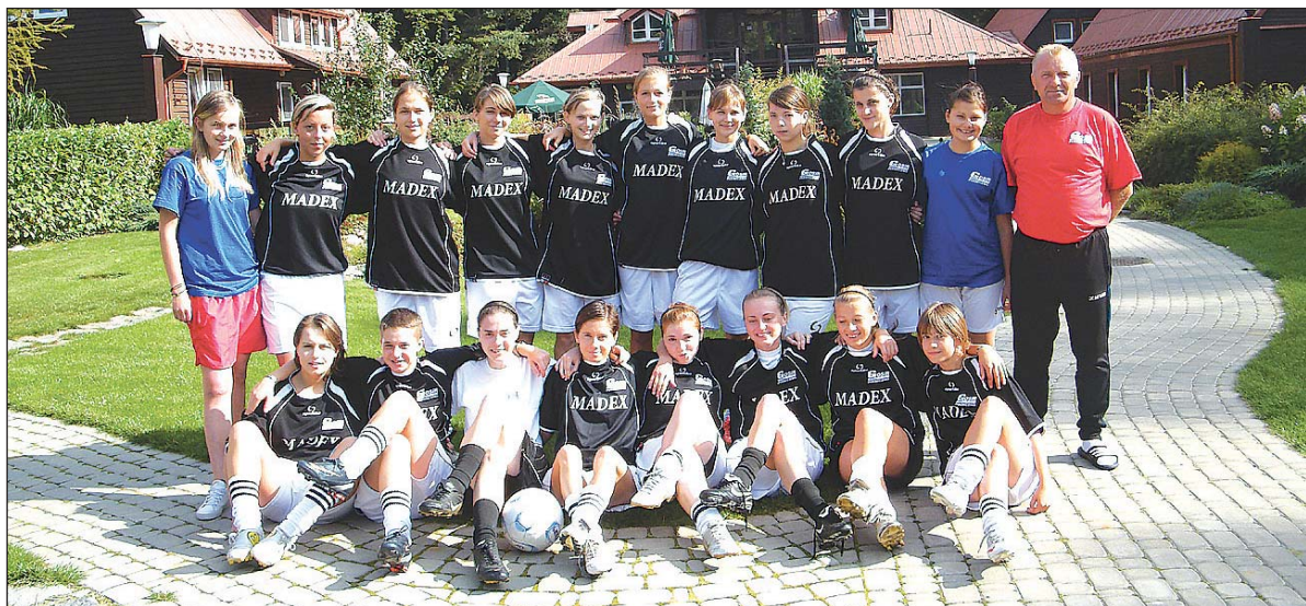
Kadra pierwszego zespołu GOSiR Piaseczno