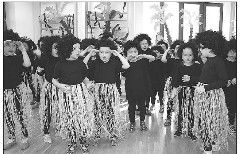
Przedstawienie podczas otwarcia przedszkola w Zalesiu Dolnym

konano przecięcia wstęgi, wypuszczono do nieba dwa gołąbki oraz kolorowe balony.