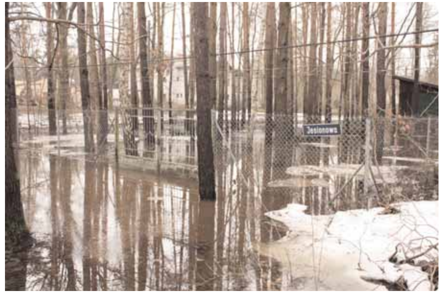
Jedna z podtopionych posesji w Zalesiu Górnym

- W dziedzinie odwodnienia gminy mamy bardzo duże zaległości i zaniedbania - powiedział na poniedziałkowym spo-