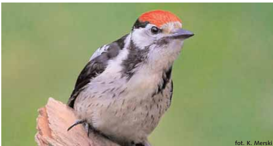
fol. K. Merski

Charakterystyczny stukot dzięcioła często usłyszeć można w Lasach Chojnowskich