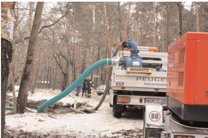
Mobilna pompa PWiK Piaseczno o wydajności 200 m. sześć./h