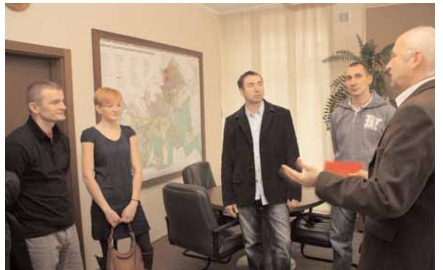
Piaseczyńska elita kickboxingu z wizytą u burmistrza