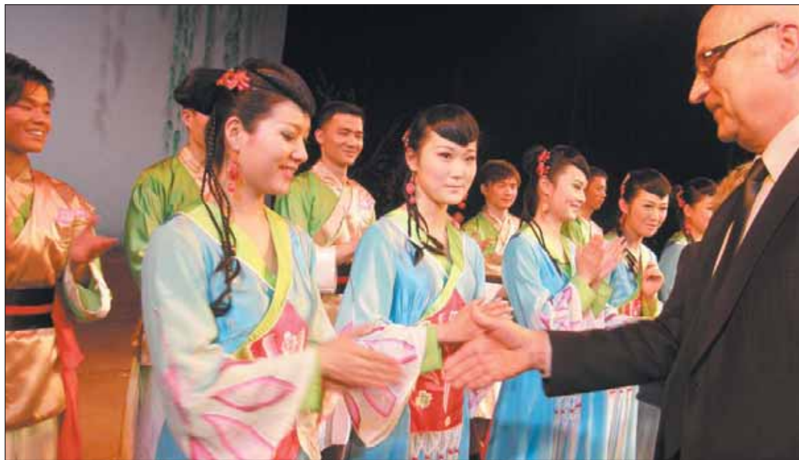
Teatr z Chin będzie jedną z atrakcji pikniku rodzinnego, 29 maja w Parku Miejskim w Piasecznie