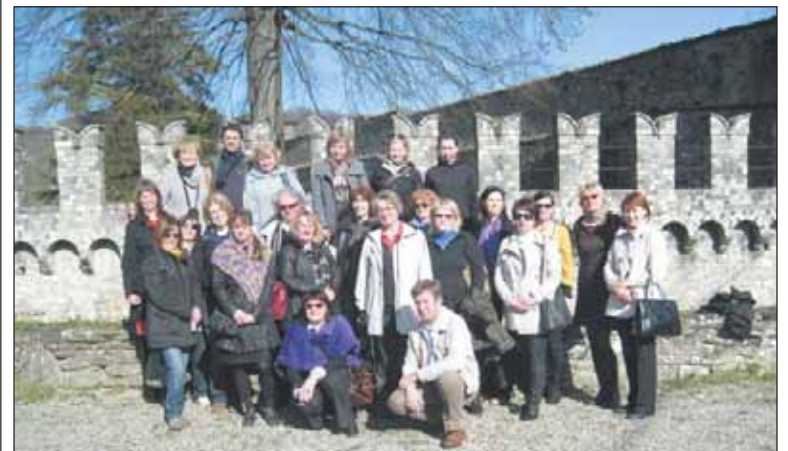
To już trzecia wymiana w ramach Comeniusa, w maju przedstawiciele piaseczyńskiego LO wyjadą na Litwę

W dniach 17-22 marca 2011 roku czworo nauczycieli z Liceum Ogólnokształcącego w Piasecznie wzięło udział w spotkaniu z nauczycielami ze szkół partnerskich programu „Socrates Comenius” w Ponte dell’Olio we Włoszech.