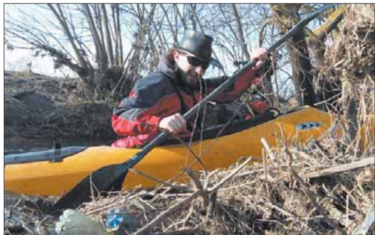
Pierwsza akcja sprzątnięcia Jeziorki przez kajakarzy

Do udziału w kolejnych edycjach sprzątnięcia Jeziorki zapraszamy również