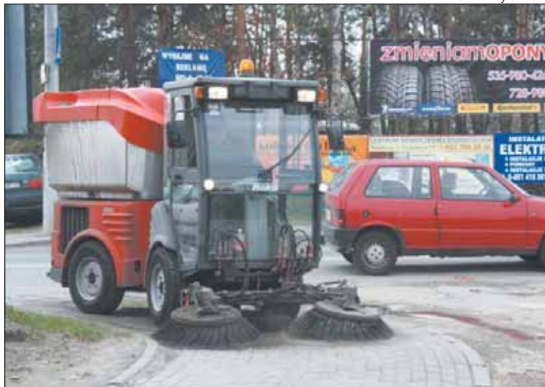
Zmiatarka potrafi w godzinę sprzątnąć 5 km chodnika

Prowadzone jest także przez PUK SITA doczyszczanie pozimowe chodników i ulic w ramach zawartej z gminą umowy. Na terenach nie objętych porozumieniem piasek i brud z chodników i krawężników usuwa wynajęta przez Wydział UTP zmiatarka Citymaster 1200. Pracując na trzy zmiany, praktycznie całą dobę, jest w stanie w ciągu dwóch dni wysprzątać na sucho i na mokro kilkanaście kilometrów chodnika. Oczyszczony został już teren części Józefostawia, a także okolice ulic Żeromskiego, Staszica, Wojska Polskiego, Dworcowej i Sienkiewicza. Za-