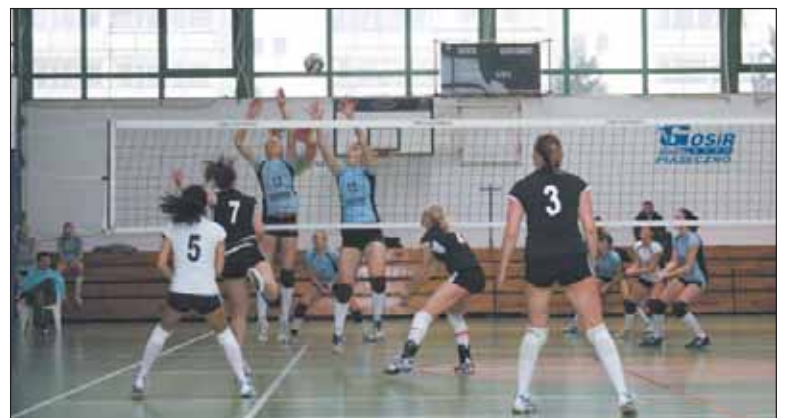
Tegoroczna rywalizacja toczyła się na bardzo wysokim poziomie

W dniu 10 kwietnia, w hali sportowej piaseczyńskiego GO-SiR-u, rozegrany został III Ogólnopolski Turniej Siatkówki Dziewcząt o Puchar Burmistrza Miasta i Gminy Piaseczno.