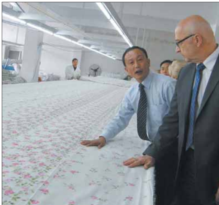
Z wizytą w zakładach produkujących jedwabną pościel

Strona chińska zainteresowana jest również wymianą edukacyjną, a pochwalić może się uczniami, którzy zdobywają najwyższe laury w ogólnooświatowych olimpiadach wiedzy, zwłaszcza z przedmiotów ścisłych. Przedstawiciele Piaseczna mieli okazję odwiedzić dwie szkoły, w tym jedną prywatną, których rozmach i organizacja robią duże wrażenie.