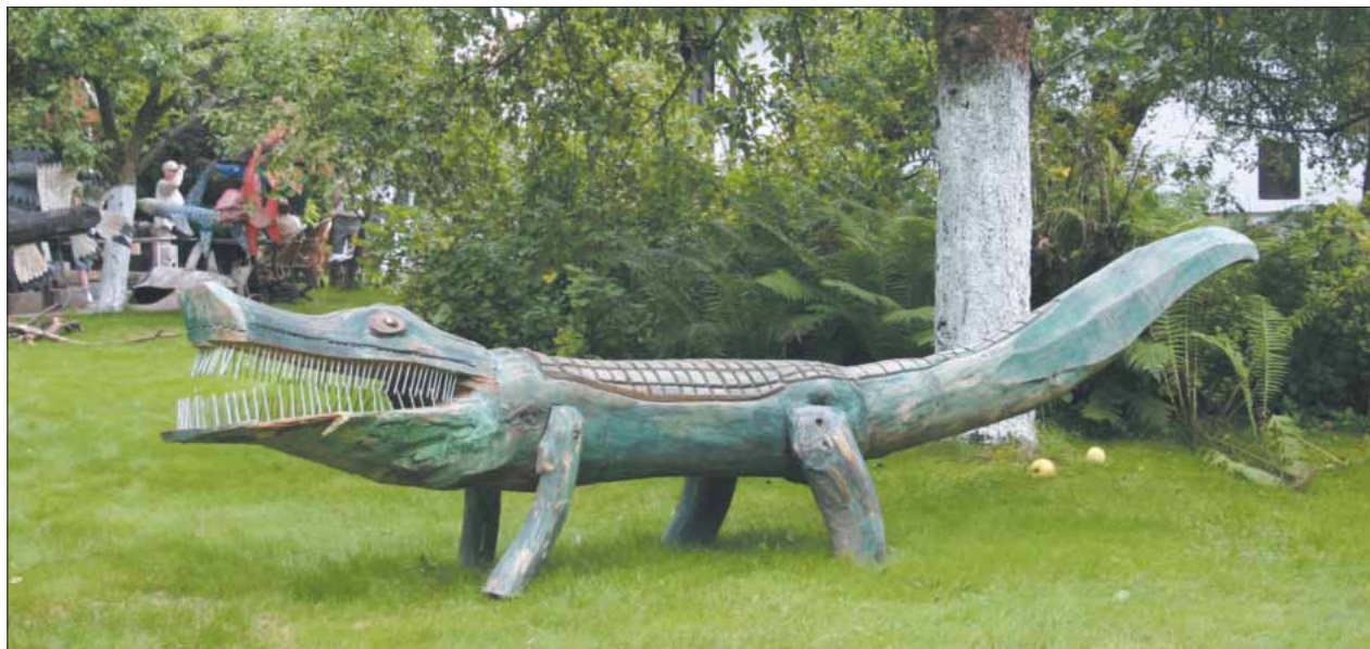
Już 23 września na piaseczyńskim rynku staną rzeźby Józefa Wilkonia