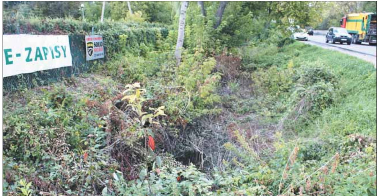
Nieprawidłowo utrzymywany, zaniedbany rów odwodnieniowy przy drodze krajowej nr 79 w miejscowości Żabieniec

Jednym z elementów prawidłowego funkcjonowania odwodnienia pasa drogowego są rowy przydrożne, określone przekrojem poprzecznym, profilem podłużnym dna, ograniczone skarpmi o określonych ściśle pochyleniach oraz podzielone na całej długości na odcinki licznymi przepustami zlokalizowanymi pod zjazdami na posesje prywatne lub pod zjazdami publicznymi, a także pod skrzyżowaniami dróg różnych kategorii.