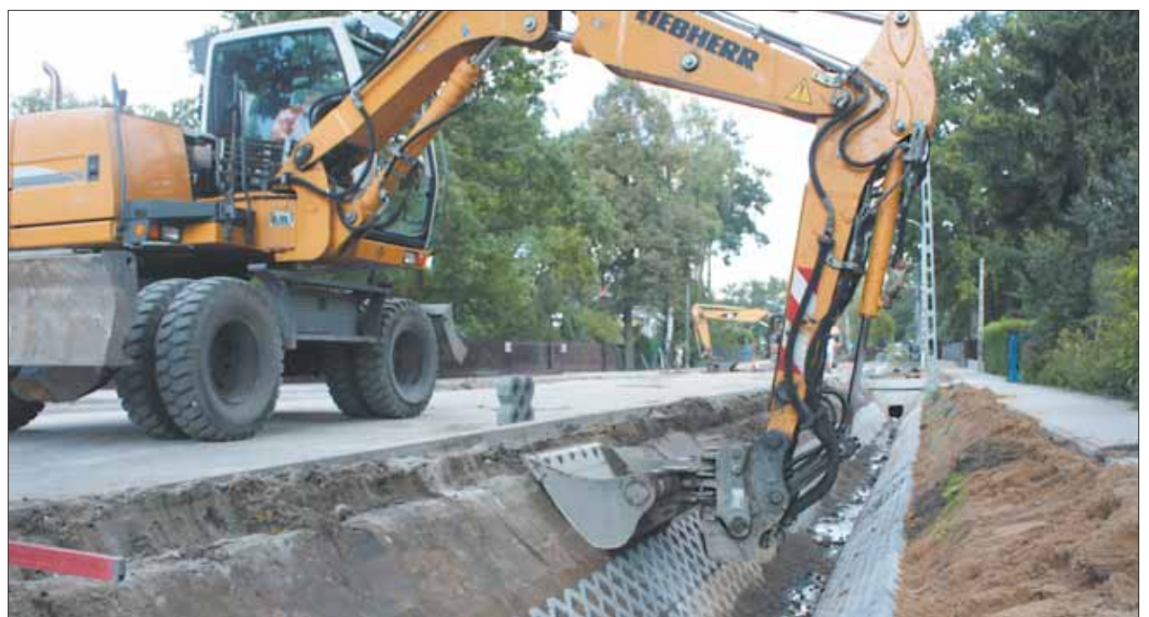
Budowa rowu odwadniającego gminną ulicę Matejki w Zalesiu Dolnym. Prawidłowe ukształtowanie zboczy i odpowiedni przekrój dna mają zapewnić właściwe odwodnienie drogi