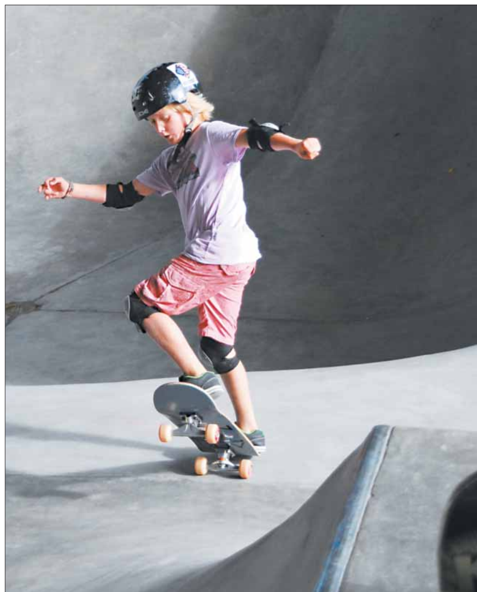
Przy realizacji skate parku w Piasecznie pomocne mogą być skandynawskie doświadczenia

W zeszłym roku Szwedzi otworzyli też nową pływalnię z zapleczem fitness, której bieżącą obsługę powierzyli prywatnemu operatorowi. Takie