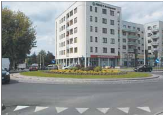
Dobiegły końca prace budowlane związane z budową ronda na skrzyżowaniu ulic Nadarzyńskiej i Wojska Polskiego

18 sierpnia zostało dopuszczone do ruchu pojazdów nowe rondo u zbiegu ulic Nadarzyńskiej i Wojska Polskiego. Termin otwarcia przypadł więc blisko dwa tygodnie wcześniej niż, pierwotnie zakładano. Na nowym rondzie przebudowano system oświetleniowy. W centrum ronda ulokowano centralny maszt z czterema oprawami świetlnymi. Aby ułatwić mieszkańcom przechodzenie ruchliwą ulicą Wojska Polskiego, zainstalowano przyciskową sygnalizację świetlną.