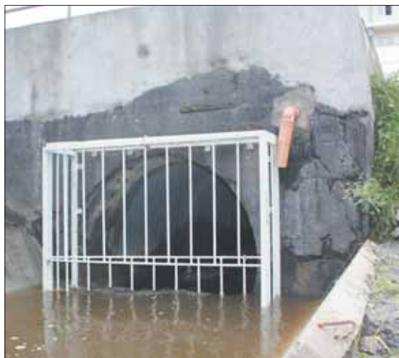
Nowa krata zabezpieczy kanał przed płynącymi wodą wielkogabarytowymi zanieczyszczeniami

Budowa ronda na ul. Wojska Polskiego jest ostatnim etapem przebudowy ul. Nadarzyńskiej. Podzielona na dwie części inwestycja pochłonęła w sumie blisko 3 mln zł. Generalnym wykonawcą była firma „Fal-Bruk”.