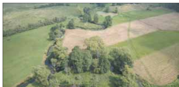
Rzeka Jeziorka w Chojnowskim Parku Krajobrazowym