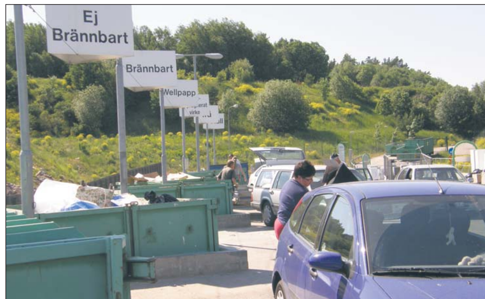
Punkt selektywnej zbiórki odpadów w szwedzkim Upplands Vasby – partnerskiej gminie Piaseczna

Od 1 lipca 2013 r. - nowy system zacznie funkcjonować i uchwały Rady Miejskiej wejdą w życie. Gmina zacznie pobierać opłaty od właścicieli nieruchomości i w zamian zapewni świadczenie usług w zakresie odbierania odpadów. Do tego czasu muszą zostać rozstrzygnięte przetargi na odbieranie odpadów od właścicieli nieru-