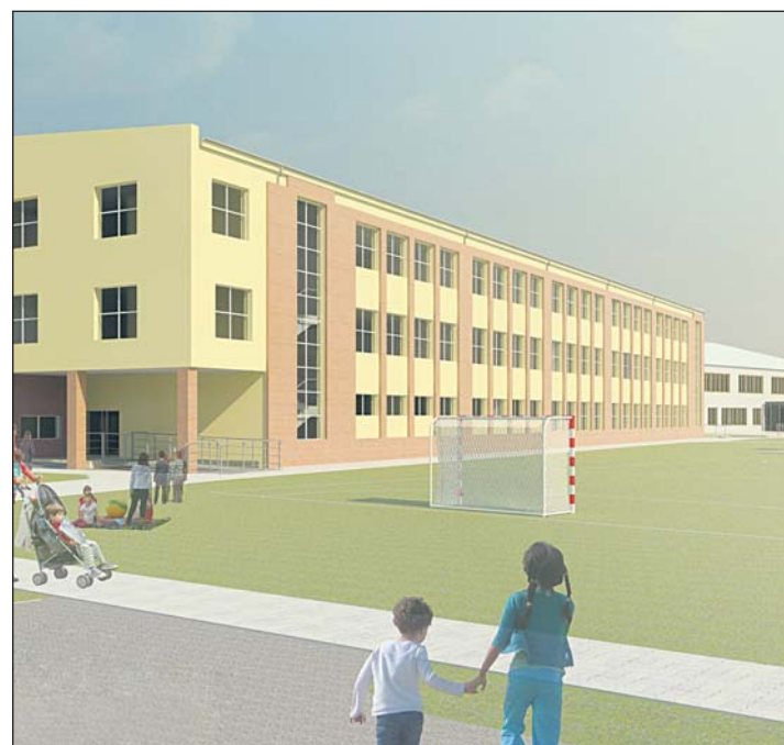
Wizualizacja rozbudowy szkół w Józefosławiu i Zalesiu Górnym

W najbliższych latach gmina planuje przeznaczyć ponad 60 mln złotych na inwestycje oświatowe