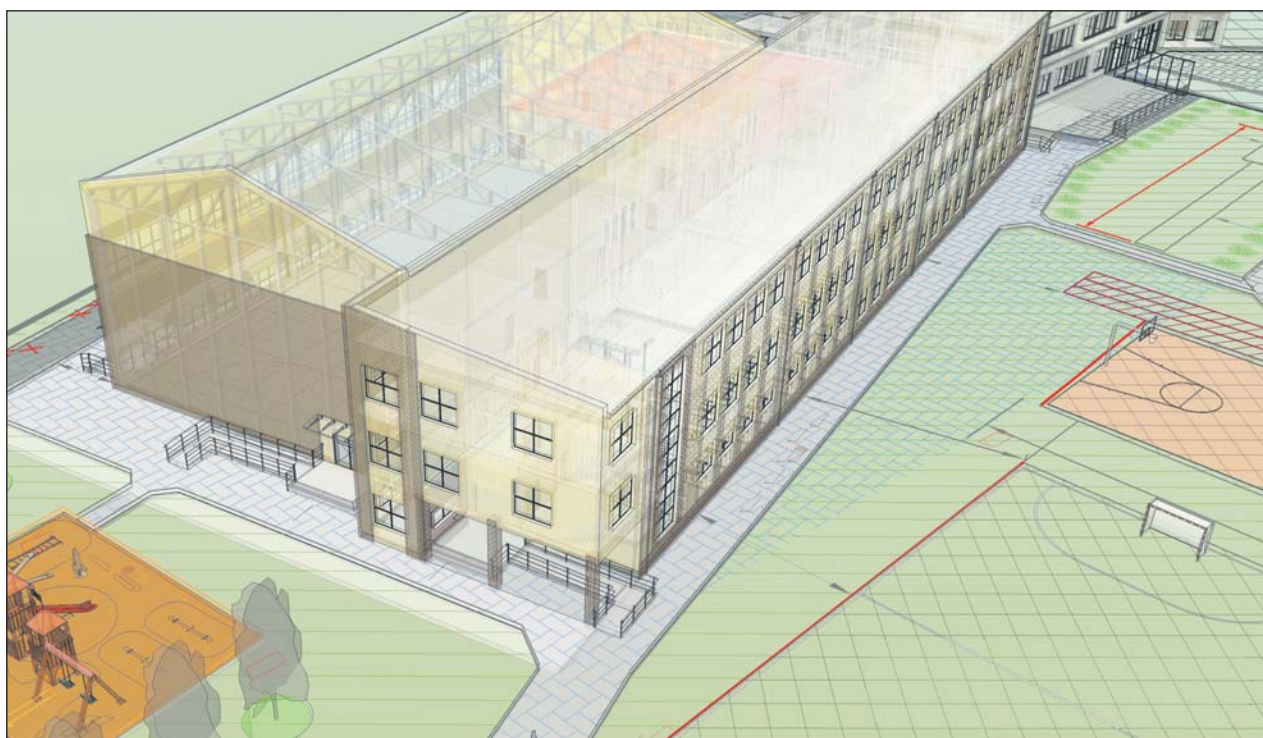
Wizualizacja rozbudowy szkoły