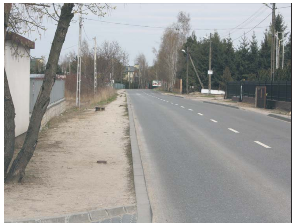
Na całej długości ul. Julianowskiej powstanie ścieżka rowerowa, chodnik i nowe oświetlenie

Jeszcze na tegoroczne wakacje uruchomiony zostanie długo oczekiwany przez najmłodszych plac zabaw w Józefosławiu. Ogólnodostępny dla mieszkańców ogródek jordanowski powstanie na terenie szkoły prawdopodobnie jeszcze w czerwcu. W ramach placu zabaw planuje się wyodrębnienie dwóch przestrzeni i ustawienie jedenastu różnych urządzeń i atrakcji – zarówno dla dzieci małych, jak i starszych. Teren będzie zamykany po godz. 21. Całkowity koszt budowy placu to ok. 120 tys. zł, z czego 60 tys. zł przeznaczona gmina. Pozostała kwota pokryta zostanie z funduszy sołectwa oraz Rady Rodziców przy Zespole Szkół w Józefosławiu.