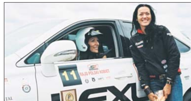
Na pikniku będzie można wykonać bezpłatnie szereg specjalistycznych badań medycznych

Mieszkancki Piaseczna w tzw. wieku skriningowym (50–69 lat), w ramach towarzyszącego Rajdowi pikniku medycznego, będą mogły bezpłatnie wykonać badanie mammograficzne oraz