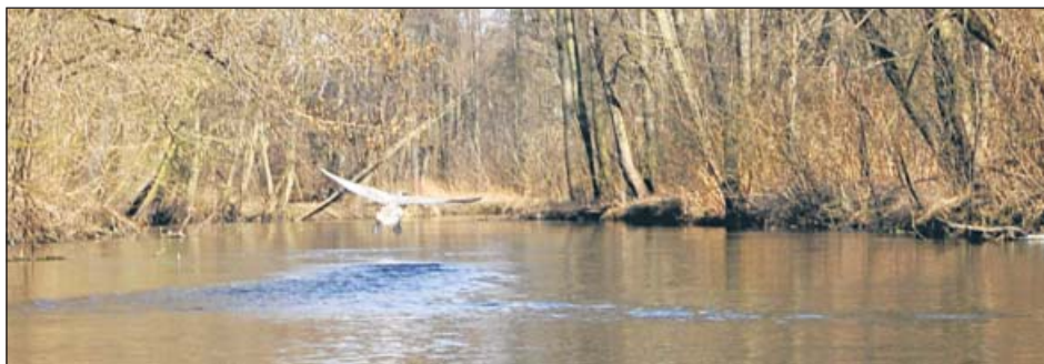
Dolina Jezioroki jest bardzo fotogenicznym skarbem przyrodniczym

Już w czerwcu ruszy konkurs fotograficzny, którego tematem przewodnim będzie rzeka Jezioroka