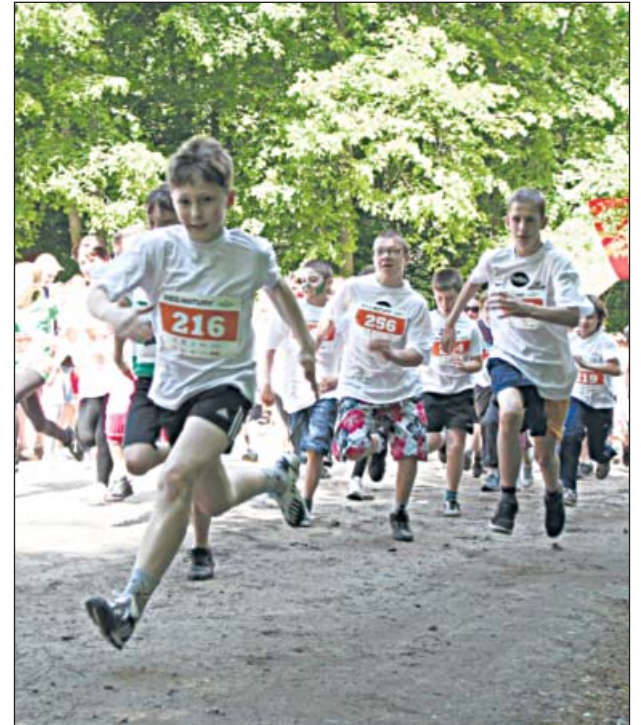
Imprezę biegową przygotowuje sama młodzież

Polska Fundacja Sportu i Kultury łączy w swoich projektach kulturę i sport, biznes