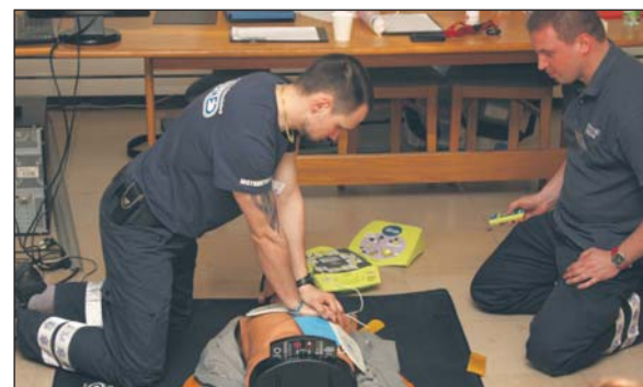
Ćwiczenia praktyczne z użyciem defibrylatora