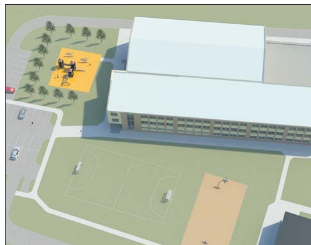
Wizualizacja zagospodarowania terenu wokół szkoły

Rozbudowa szkoły w Józefosławiu jest jednym z elementów oświatowego programu inwestycyjnego, który w ciągu kilku najbliższych lat może pochłonąć nawet 60–70 mln zł z gminnego budżetu. Oprócz inwestycji w Józefosławiu ma zostać wybudowane duże, nowoczesne centrum edukacyjne ze szkołą w centrum Piaseczna przy ul. Jana Pawła II. Program obejmuje również przeprowadzenie modernizacji szkoły w Zalesiu Dolnym, rozbudowę szkoły w Zalesiu Górnym oraz dokończenie rozbudowy Szkoły Podstawowej Nr 1 w Piasecznie.