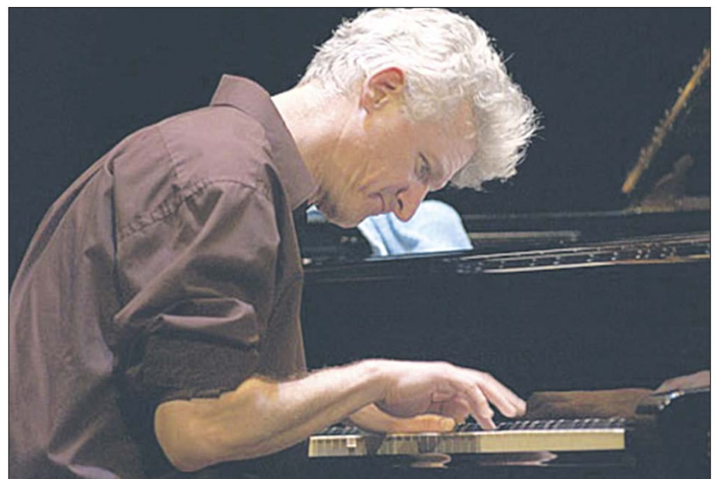
Dave Kikoski – amerykański pianista współczesnego jazzu

David Kikoski urodził się w 1961 r. w Milltown w stanie New Jersey. Artysta pojawia się zarówno w zespołach wielkich innowatorów jazzu, jak i w projektach innych, młodych muzyków. Doskonale wykształcony pianista (m. in. absolwent prestiżowej uczelni jazzowej Berklee College of Music), początkowo pojawiał się w zespołach tworzonych przez studentów, absolwentów oraz pedagogów bostońskiej