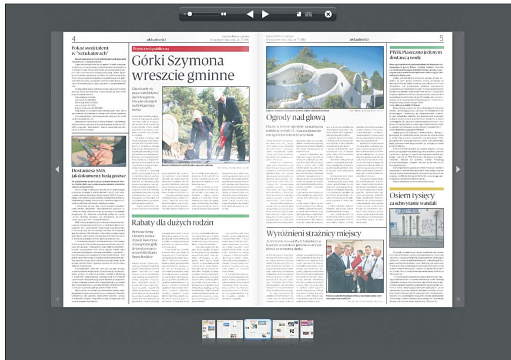
Teraz nawigacja po internetowym wydaniu gazety jest znacznie łatwiejsza

Mamy nadzieję, że nowy sposób prezentacji oraz udostępnienie on-line elektronicznego wydania przypadną do gustu naszym czytelnikom i zachęcą