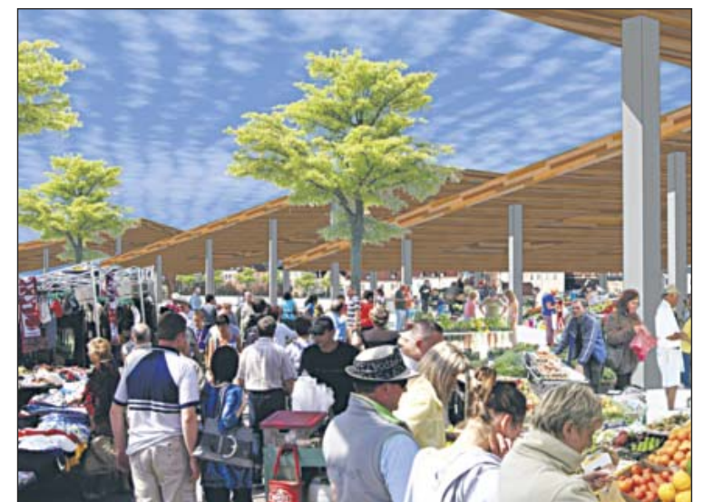
Propozycja zagospodarowania miejskiego targowiska

Główne wejście prowadzić ma do centrum multimedialno-bibliotecznego, stanowiącego samodzielny moduł, z którego korzystać można by również wówczas, kiedy szkoła będzie zamknięta. Podobnie hala sportowa – będzie miała zapewnione wejścia zarówno bezpośrednio ze szkoły, jak i z zewnątrz. Na terenie szkoły przewidziano ponad 100 miejsc parkingowych, a liczba ta może wzrosnąć nawet do 280, jeśli uda się gminie wykupić dodatkowe tereny. *