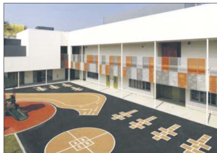
Wygląd zewnętrzny szkoły jest sprawą otwartą. Na zdjęciu jeden z przykładów nowoczesnej placówki oświatowej