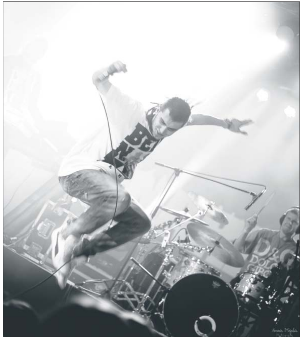
W Centrum Kultury zapowiada się niezwykle energetyzujący koncert