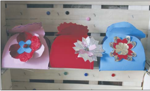
Zrób eko-prezent na warsztatach