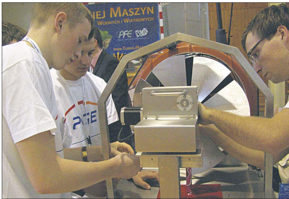
Montaż jednej z konstrukcji na stanowisku pomiarowym

Wszystkie zgłoszone turbiny były testowane na stanowisku pomiarowym zbudowanym przez Firmę Unilogo z Piaseczna. Na wiatrak skierowany był strumień powietrza wytwarzany przez wentylator o wydajności 3500 m 3 /h. Najlepsze osiągnięcia uzyskał wiatrak wykonany przez