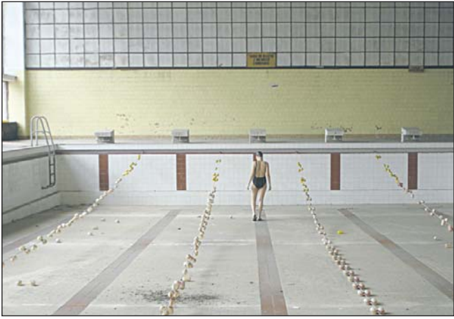
Jedna z prac na wystawie – Ola Buczkowska-Przeździk „Basen”