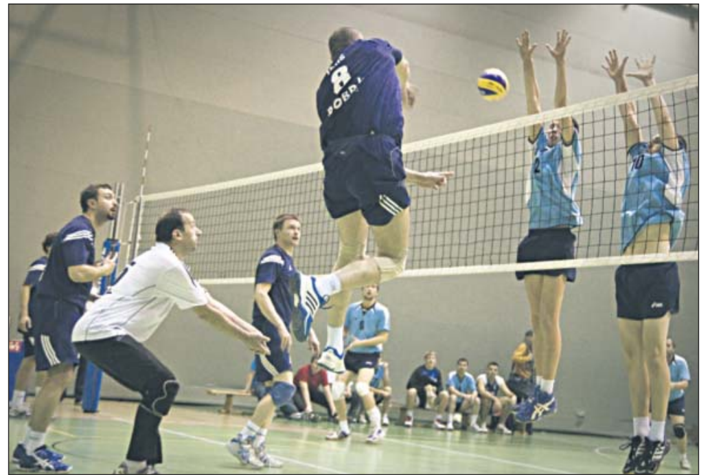
Bobry Piaseczno po raz kolejny zorganizowały jeden z najlepszych amatorskich turniejów na Mazowszu

W tym roku w turnieju udział wzięło szesnaście drużyn podzielonych na cztery czterozespołowe grupy. Pierwszego dnia grupy walczyły systemem każdy z każdym. Zwycięzcy i ekipy z drugich miejsc przeszły dalej tworząc dwie czterozespołowe grupy. W niedzielę mecze ponownie rozgrywane były systemem każdy z każdym. Następnie ekipy z drugich miejsc walczyły w finale B o trzecie miejsce, a zwycięzcy w finale A o pierwszą pozycję w turnieju. Zwyciężyła drużyna Wilanów Warszawa pokonując w finale 2:0 KS Mogielankę Mogielnicę.