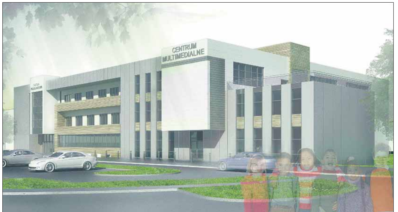
Jedna z wizualizacji projektu nowej szkoły w centrum Piaseczna.

Pełny protokół z sesji Rady Miejskiej oraz uchwały dostępne są na stronie internetowej www.piaseczno.eu