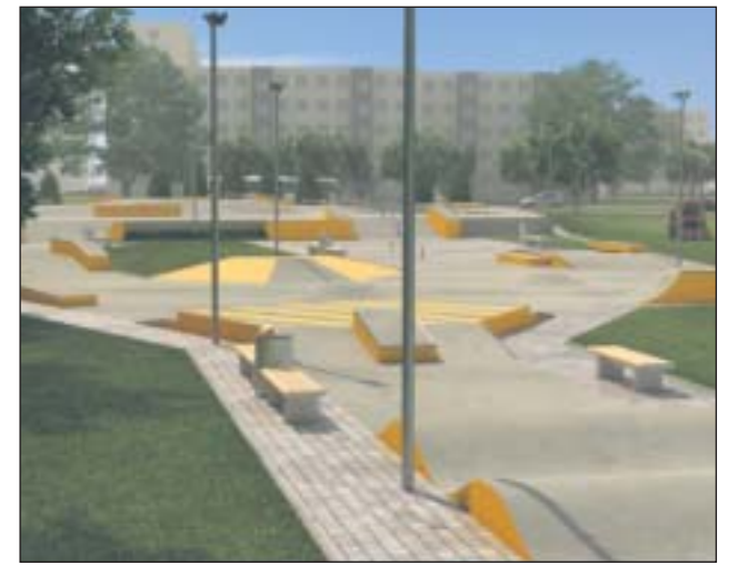
Wizualizacja skate parku w centrum Piaseczna

duje się uporządkowanie miejsca na ogniska wraz z budową wiat i wkomponowanie tam boiska do piłki plażowej. Na cyplu jednego ze stawów powstaną z kolei wiaty widokowe. Wszelkie obiekty kubaturowe po zmianie planu zagospodarowania przestrzennego będą mogły powstać przy parkingu od al. Brzóz. Zakłada się wprowadzenie tam małej gastronomii z systemem tarasów kawiarnianych łączących stawy i Jezioro. Najpierw jednak musi zostać zmieniony plan zagospodarowania dla tego terenu. Rozważana jest także możliwość stworzenia parku linowego.