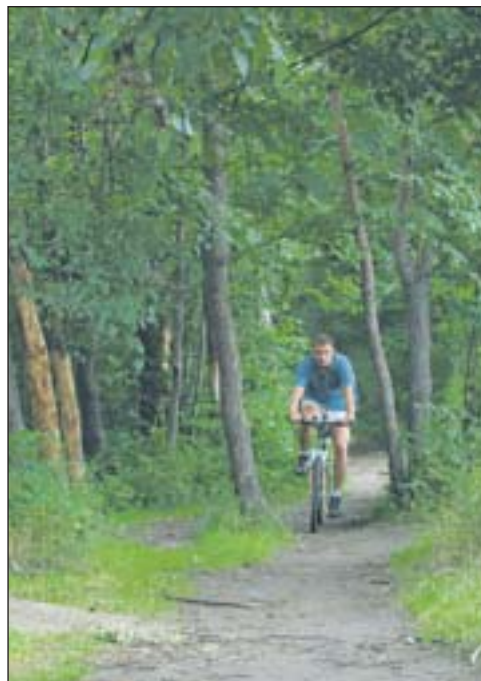
Na terenie powiatu piaseczyńskiego i grójeckiego dostępnych jest ponad 350 km tras rowerowych

Stowarzyszenie Gmin i Powiatów Zlewni Rzeki Jeziorki, którego gmina Piaseczno jest członkiem, po kilku latach starań i działań oddaje miłośnikom dwóch kółek ponad 200 kilometrów nowych, oznakowanych szlaków rowerowych wraz z małą infrastrukturą. Szaleć na jednośladach będzie