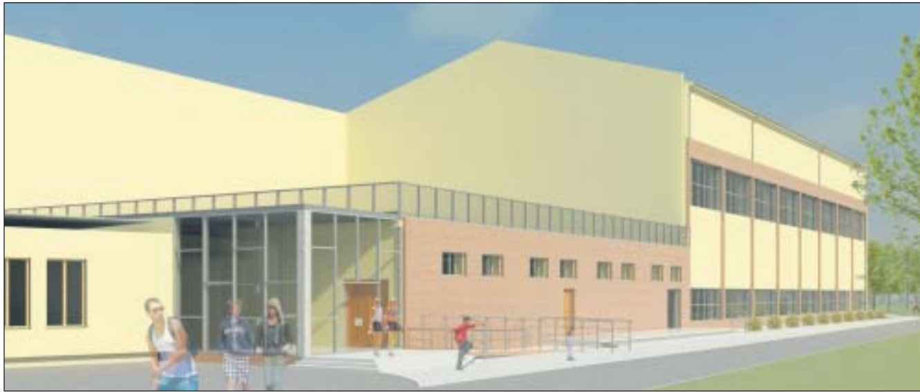
Wizualizacja nowej hali sportowej w ramach rozbudowy Zespołu Szkół Publicznych w Józefosławiu

Ponad 11 mln złotych w tegorocznym budżecie przewidziano na inwestycje związane ze sportem w placówkach oświatowych.