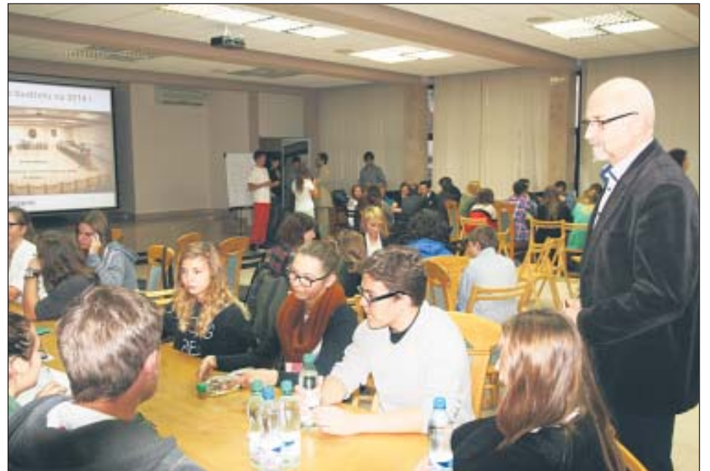
W debacie wzięło udział ponad sto osób reprezentujących różne środowiska młodzieżowe

Debata była ostatnią i najważniejszą częścią trójstopniowych konsultacji zorganizowanych przez piaseczyńską MRG. Młodzież w pierwszym kroku zebrała we wszystkich gimnazjach z naszego terenu oraz szkołach średnich różne propozycje. Swoje pomysły zgłosić mógł każdy uczeń w dowolny sposób: mailem, esemesem czy na piśmie. W drugim kroku wybrano