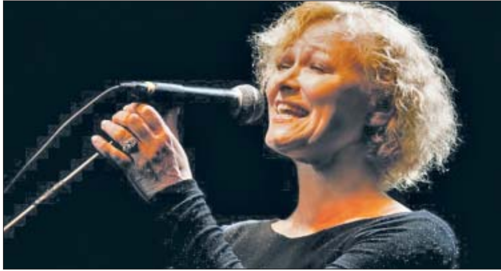
Edyta Geppert zaśpiewa 8 listopada w Piasecznie swoje największe przeboje

Edyta Geppert tworzy swój własny, nieporównywalny z innymi wykonawcami, teatr piosenki. Nie lubi, gdy się mówi o niej „wokalistka”. Nie chce też określać tego, co robi, słowami „poezja śpiewana”. Po prostu śpiewa piosenki. Najbardziej odpowiada jej zapomniana już definicja francuskich encyklopedystów: „Piosenka – rodzaj wiersza, krótkiego, do którego dodaje się muzykę, aby był śpiewany przy okazjach