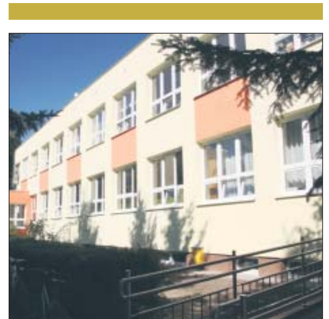
Nowa elewacja Gimnazjum Nr 1

Rozkład jazdy jest dostępny na stronie www.ztm.waw.pl .