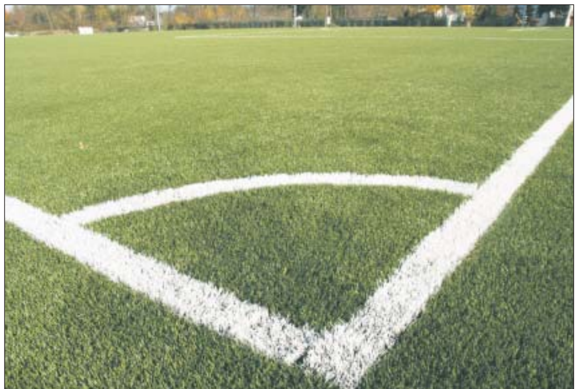
Najwyższej jakości murawa otrzymać ma dwugwiazdkowy certyfikat od Międzynarodowej Federacji Piłkarskiej FIFA

Boisko o długości 105 metrów i szerokości 68 metrów spełnia wymogi Międzynarodowej Federacji