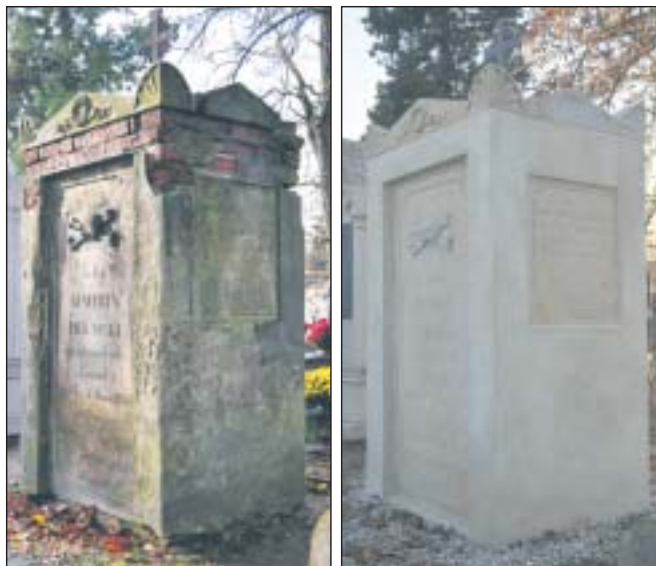
Najstarszy pomnik rodzinny na Cmentarzu Parafialnym przed renowacją i po niej.

W imieniu Komitetu, przewodniczący Zbigniew Mucha, tel. 602184511, e-mail: jamu-cha@o2.pl *