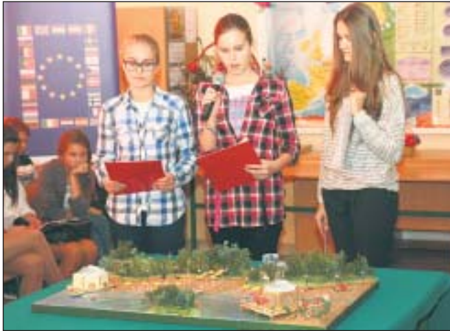
Jedna z prac konkursowych prezentowana przez uczennice gimnazjum

Ogłoszenie wyników konkursu i wręczenie nagród dla wszystkich jego uczestników odbędzie się 6 listopada podczas spotkania z panią prof. Danutą Hübner w ramach Forum Młodych Europejczyków „Unijne barwy naszego regionu” w Gimnazjum Nr 1 im. Powstańców Warszawy w Piasecznie.