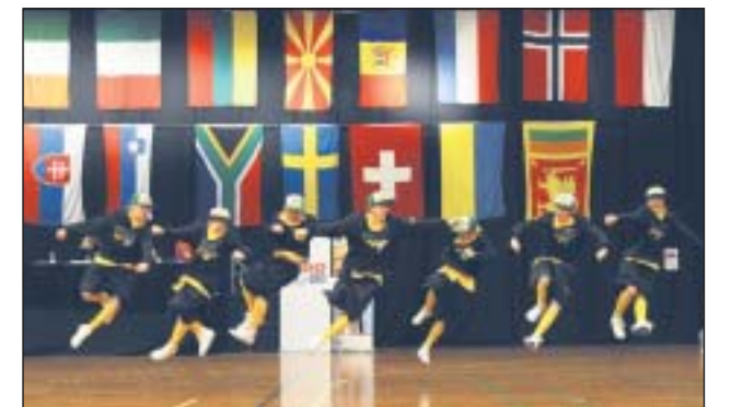
Złota Mini Formacja podczas zwycięskiego tańca

Zachęcamy również do świętowania niepodległości w duchu sportowym. W sobotę 16 listopada będzie można wziąć udział w Biegu Niepodległości, organizowanym przez Stowarzyszenie „Kondycja” w Parku Miejskim w Piasecznie. Do wyboru będą dwa dystanse: 1 km (Bieg Rodzinny) oraz 5 km (Bieg Rekreacyjny). Informacja o opłatach oraz rejestracja on-line dostępne są na stronie www.kondycja.com.pl .