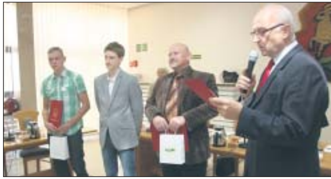
Sportowcy wyróżnieni na sesji