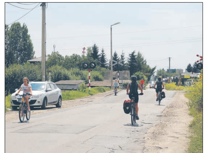
Przebudowa ulicy poprawi komfort i bezpieczeństwo ruchu

Gmina w najbliższym czasie planuje zwrócić się do Urzędu Wojewódzkiego o dofinansowanie budowy. – Istnieje duża szansa na uzyskanie blisko 50-procentowego wsparcia z funduszy Narodowego Programu Przebudowy Dróg Lokalnych, tzw. Schetynówki –