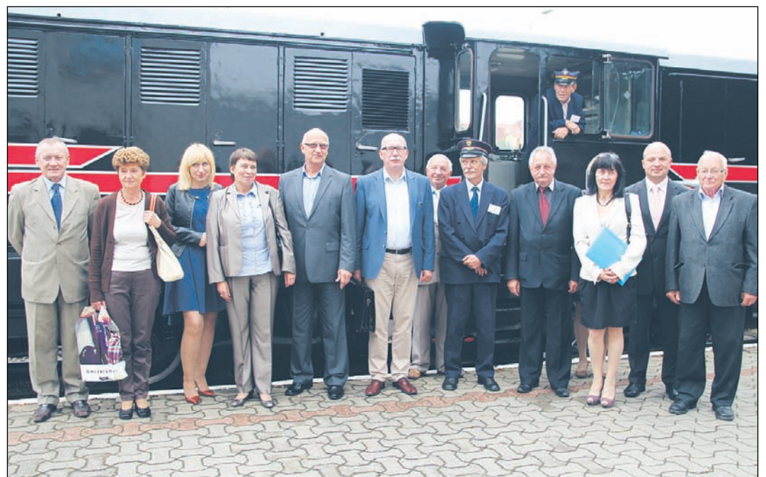
Przedstawiciele czterech samorządów oraz spółki PKP po podpisaniu aktu notarialnego

Dzięki determinacji samorządów, z gminą Piaseczno na czele, Piaseczyńsko-Grójecka Kolej Dojazdowa – cią-