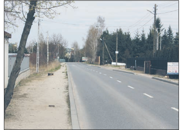
Wzdłuż całej ulicy Julianowskiej powstanie chodnik oraz ciąg pieszo-rowerowy

– Zakres prac na ul. Julianowskiej obejmie tylko tereny przyległe do jezdni, więc nie powinien powodować dużych utrudnień w ruchu pojazdów – tłumaczy nadzorujący prace