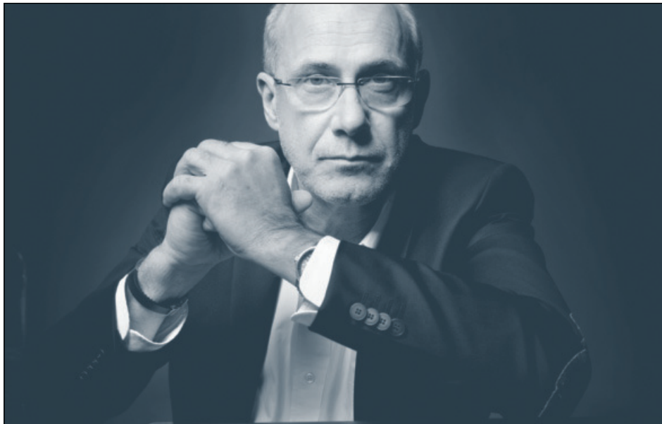
Koncert Piotra Machalicy zobaczyć będzie można w piaseczyńskim Domu Kultury

Recital rozpocznie się o godz. 20.00 w sali Domu Kultury w Piasecznie, ul. Kościuszki 49. Bilety