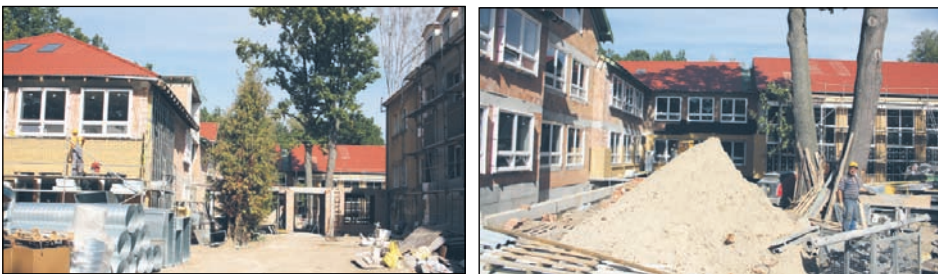
Prace budowlane przy nowym skrzydle szkoły podstawowej w Zalesiu Górnym