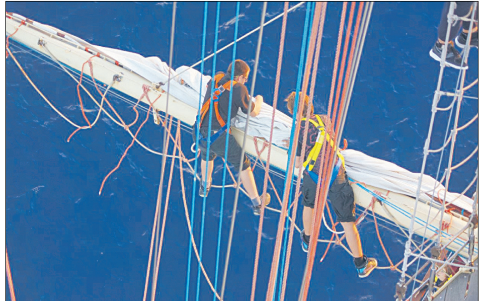
W nagrodę za wolontariat uczniowie popłyną w rejs żaglowcem STS Pogoria po Morzu Śródziemnym

Tradycyjnie, co miesiąc, uczestnicy spotykają się w wybranej parafii. 27 września 2014 o godzinie 15.00 odbędzie się kolejne spotkanie. Tym razem w kaplicy Specjalnego Ośrodka Wychowawczego siostr Miłosierdzia w Ebiskach. Dlaczego tam? Wolontariusze, którzy zakwalifikują się na rejs, zabiorą ze sobą wybranych uczniów właśnie ze szkoły w Ebiskach. Ważne, by i podczas rejsu pamiętali o tym, że zawsze jest ktoś obok, kto może