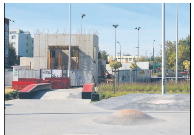
Nowy pawilon wkomponuje się w otoczenie skate parku

Obok pawilonu powstaje również zewnętrzna zadaszona klatka schodowa do zaplanowanego na dachu tarasu widokowego. Aranżacja przestrzeni da-