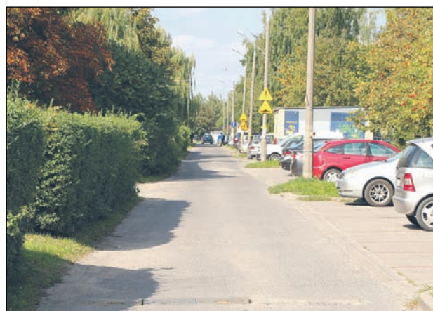
Samorząd przejął osiedlową drogę łączącą ul. Szkolną z ul. Sikorskiego

Ewentualne prace będą sprzężone z rewitalizacją sąsiedniego terenu zielonego, o przejęcie którego do spółdzielców wystąpiła gmina. – Rozmawiamy ze spółdzielnią o przejęciu odpowiedzialności za teren zielony pomiędzy gimnazjum a przedszkolem tuż przy alei Róż. Plan zagospodarowania i obecny projekt zmiany studium zabezpiecza ten teren jako teren zieleni. W tym roku zarezerwowaliśmy 400 tys. zł na do-