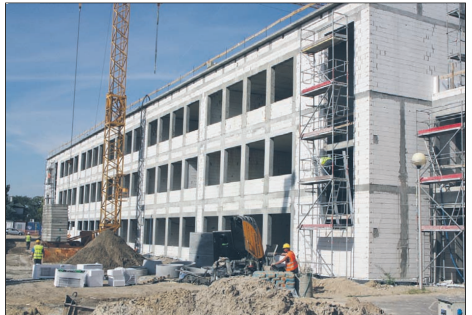
W Józefosławiu powstaje nowa część szkoły oraz hala sportowa