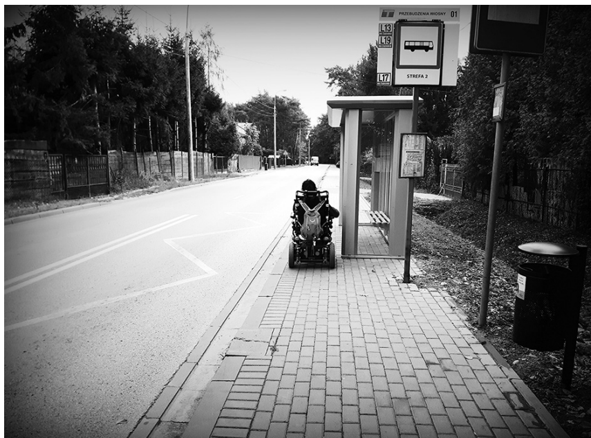
W niektórych miejscach odległość między krawężnikiem, a przystankiem z ledwością wystarcza, aby można było przejechać

Kolejnym, myślę że dość dużym problemem jaki dostrzegam w naszej miejscowości, jest brak dostosowanego gabinetu dentystycznego. Każdy ma prawo do leczenia. Wiem, że jest możliwość prywatnego leczenia, jednak żaden gabinet nie świadczy usług np. bez przesadzania pacjenta na fotel. Czy wózek naprawdę aż tak bardzo różni się od fotela dentystycznego?