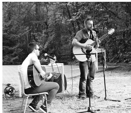
Atrakcją dnia był występ zespołu Podejrzani o Współudział, fot. P.Kowalski

Do pieczonego ziemniaka zagra The Warsaw Dixielanders