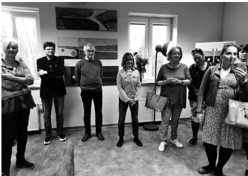
Biżuteria zachwyciła nie tylko płęć piękną

– Najczęściej wycinam poszczególne elementy ręcznie brzeszczotem, zakładając na oczy lupę. To wiele godzin pracy,