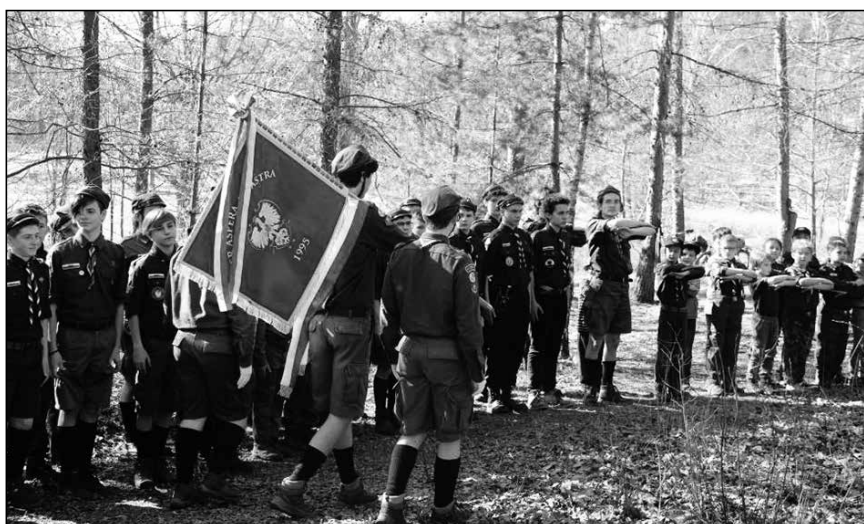
Sztandar Szczepu Watra

2 MDW-ów – pwd. Mateusz Grzyb, tel. 603 252 800 (klasy III gim./I LO<)