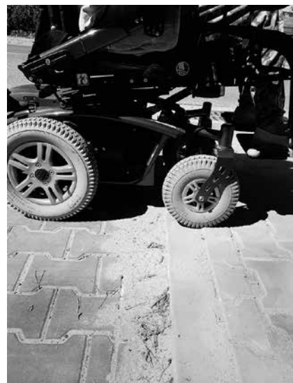
Po poprawkach można spokojnie podjechać na chodnik, fot. A. Andziak

Naszą gazetę można przeczytać również na stronach: zalesie-gorne.eu ; zalesie-gorne.pl ; powiat-piaseczynski.info ; naszepiaseczno.pl ; piaseczno4u.pl . Aktualności z Piaseczna można obejrzeć na stronie: itvpiasieczno.pl . Informacje z Zalesia również na www.tvzalesie.pl