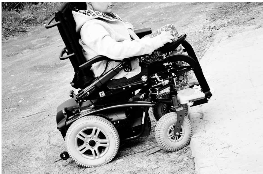
Nawet wózek inwalidzki o napędzie elektrycznym nie był w stanie pokonać takiego krawężnika

Kilka dni temu wybrałam się na spacer, aby podziwiać nasze piękne Zalesie wiosną, a także zerknąć na nowe chodniki: przy ulicy Parkowej oraz Jesionowej. Trzeba przyznać, że na pierwszy rzut oka wszystko wyglądało idealnie, jednak niektóre miejsca mnie rozczarowały. Zamiast łagodnych zjazdów przy ulicach Fijołków, Calineczki oraz Balladyny były