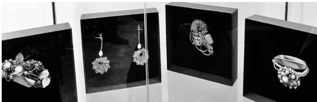
Biżuteria wykonana przez Monikę Czubę-Dobień