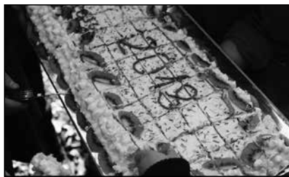
Tort, fot. archiwalne zdjęcia ZHR „Watra”

Niedawno, 7 IV obchodziliśmy 23 urodziny Szczepu Watra z Zalesia Górnego. Z tej okazji harcerze i harcerki stawali się w wyznaczonych miejscach na grę, która polegała na zdobywaniu „kart wpływu” poprzez wykonywanie zadań. Każda grupa składająca się z kilku patroli i miała wyznaczony teren - tak zwaną frakcję. Poszczególne frakcje należały do grup z niebieskimi, czerwonymi bądź białymi proporcami. Utrudnieniem było