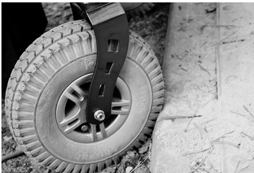
Zjazd z chodnika przed interwencją – ulica Fijołków