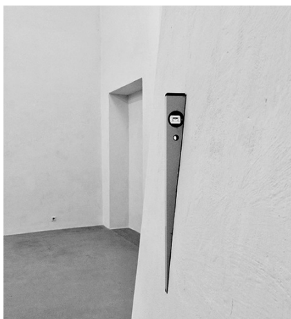
„scouting”, 2015, Galeria Weltecho, Chemnitz (D), zdjęcie dzięki uprzejmości artysty

niszczą lub unieważniają się nawzajem. Punktem wyjścia jest istniejąca, znaleziona - przestrzeń jako taka, a także źródła światła, drewniane panele, szkło i inne materiały. Praca sama w sobie jest procesem - rozkładem całości na poszczególne jej części i tworzeniem od nowa. Wynik końcowy nie jest ukierunkowany i zdefiniowany, co stanowi wystar-