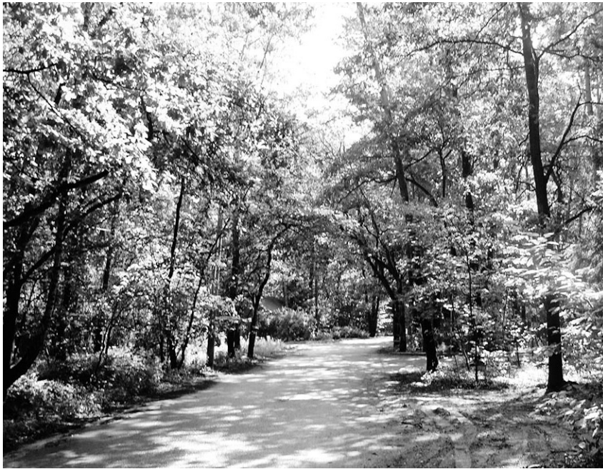
Co nowego z Planem Miejscowym dla Zalesia Górnego

ku lasów Państwowych) lub Starosta (w przypadku lasów prywatnych). W obu przypadkach cały proces, w pierwszym etapie, musi zostać zaaprobowany przez Radę Gminy oraz wszystkich właścicieli poszczególnych działek leśnych. Zdjęcie ochronności nie może się odbyć bez zgody właścicieli nieruchomości. Kolejnym etapem jest uzyskanie decyzji Starosty oraz Ministra Środowiska.