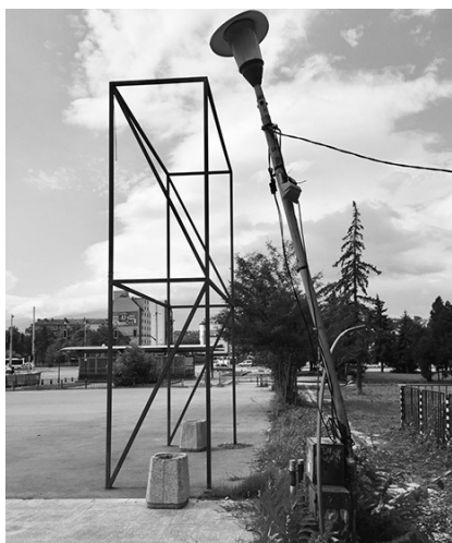
Bułgaria, 2018, zdjęcie dzięki uprzejmości artysty