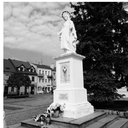
Figura Matki Bożej z Łęczycy

Państwo polskie odrodziło się dzięki ofiarności całego społeczeń-