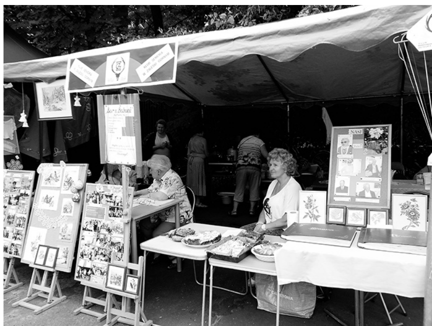
Seniorzy na Hubertusie

• od roku 2008 regularne spotkania z dziećmi i młodzieżą w Ośrodku Szkolno-Wychowawczym w Łbiskach, dziećmi i młodzieżą w Szkole Podstawowej i Gimnazjum w Zale-