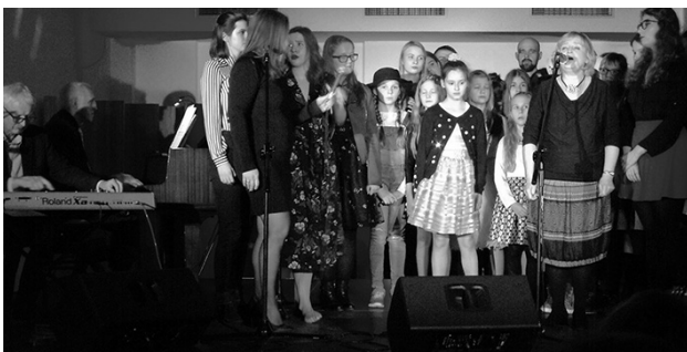
Artyści i uczestnicy śpiewają razem piosenkę „Wolność” Marka Grechuty