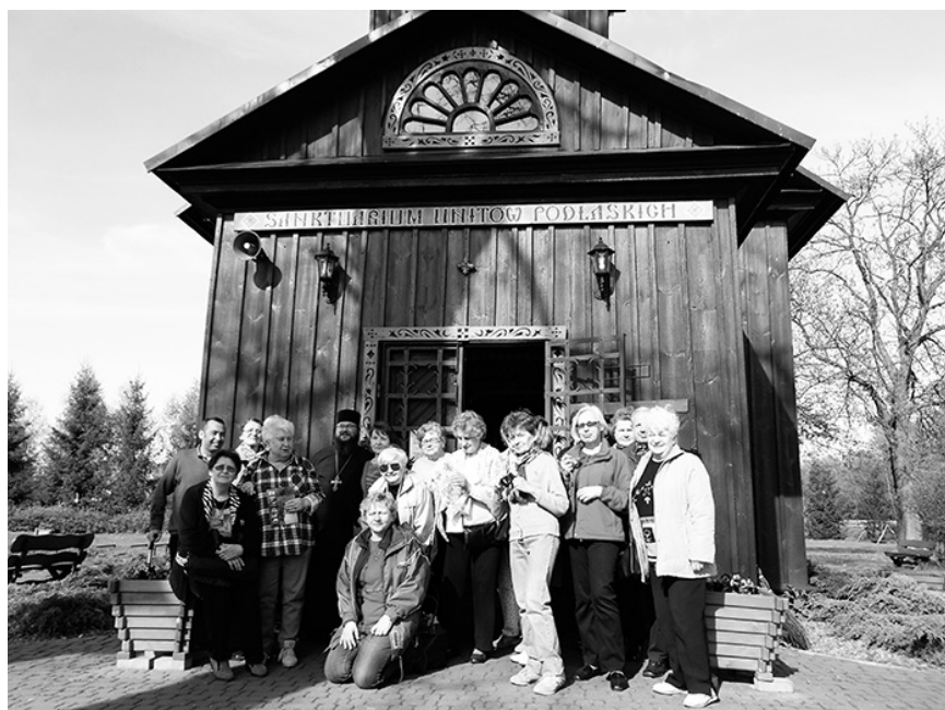
W Kostomłotach

• od roku 2010 udział w corocznych jarmarkach i piknikach w Zalesiu Górnym i w Piasecznie, współpraca z Radą Sołecką, Sołtysem, SPZG,