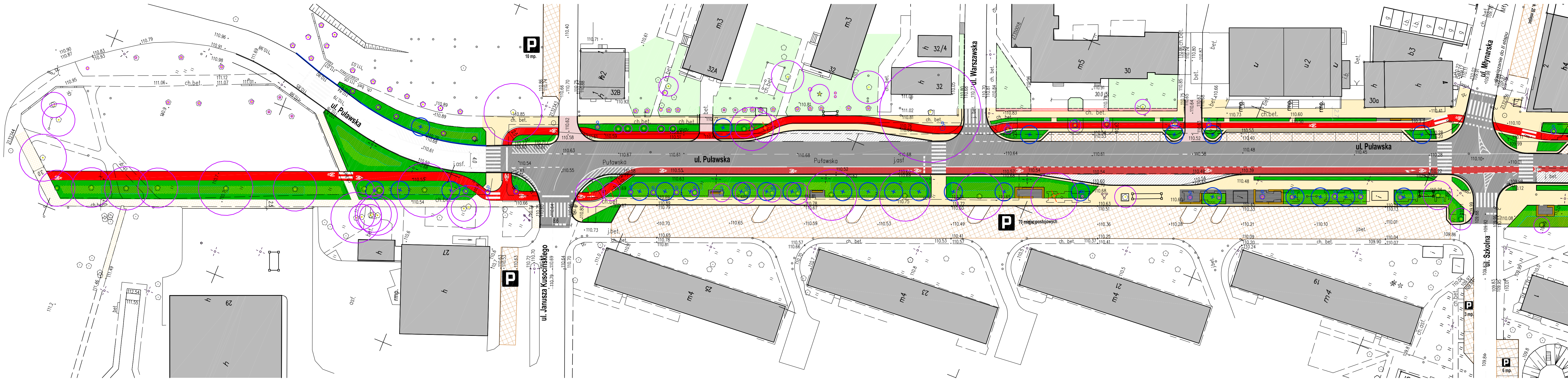
RZUT SKALA 1:500