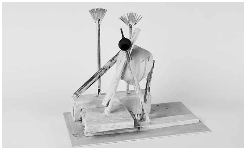
Waldemar Umiastowski, „trzy gracie”, 2001, technika mieszana