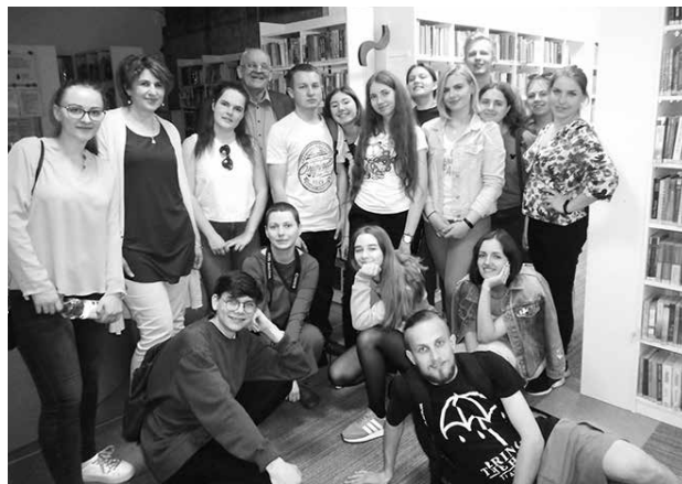
Wizyta studentów w bibliotece