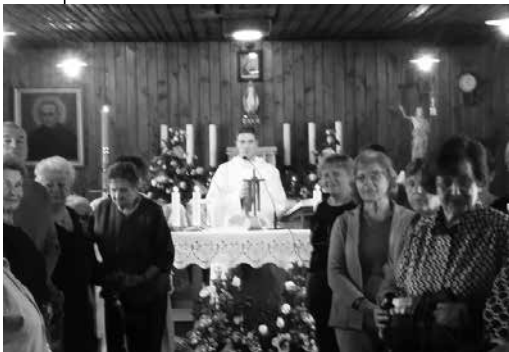
W Kaplicy Św. Maksymiliana Kolbe