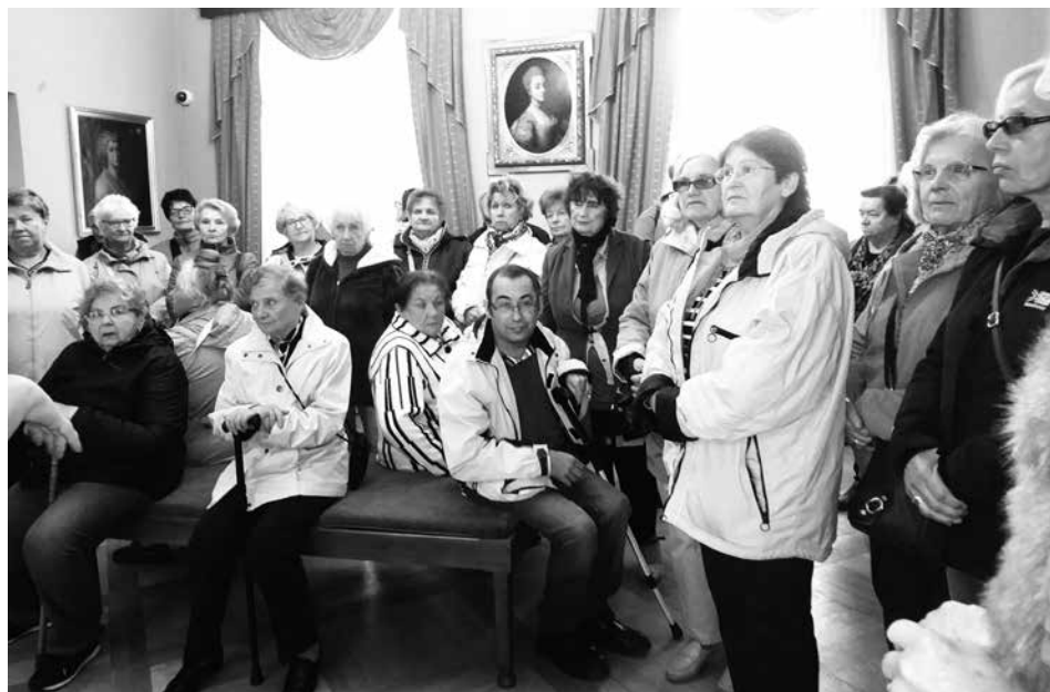
W Muzeum w Opinogórze