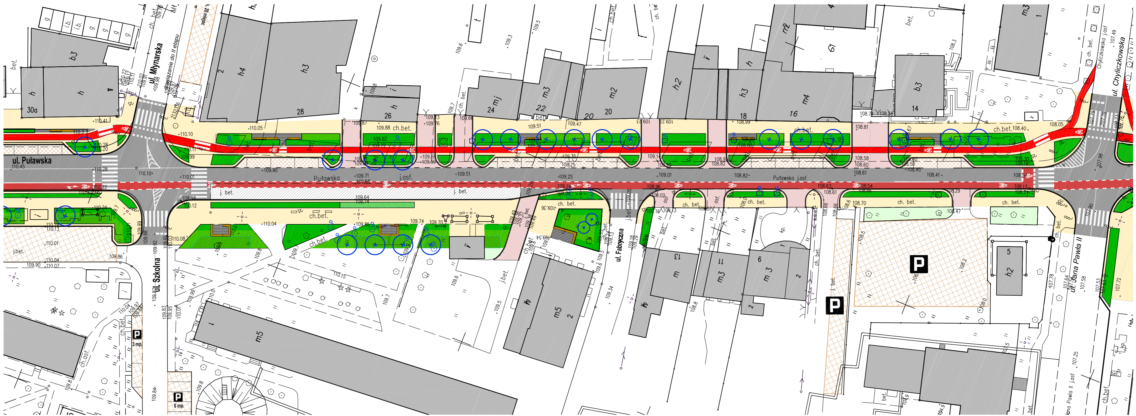
RZUT SKALA 1:500