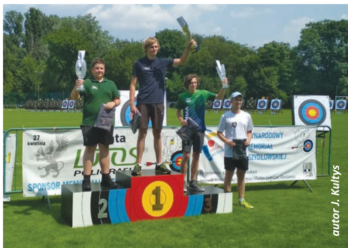
autor: J. Kultys