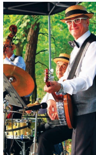
Sąsiedzka integracja odbywała się przy dźwiękach tradycyjnego jazzu serwowanego przez The Warsaw Dixielanders fol. Pablo

Fundusze przesunięte ze Święta Pieczonego Ziemniaka przeznaczaliśmy też na uszczelnienie balkonu, który przeciekał do przedsionka wejściowego do budynku powodując niszczenie parapetów i zawilgocenie pomieszczenia. Czekamy także na wycenę naprawy schodów do piwnicy, które zmurzały stanowią zagrożenie dla użytkowników. Tak więc środki finansowe z Majówki i Święta Pieczonego Ziemniaka nie przepadną.