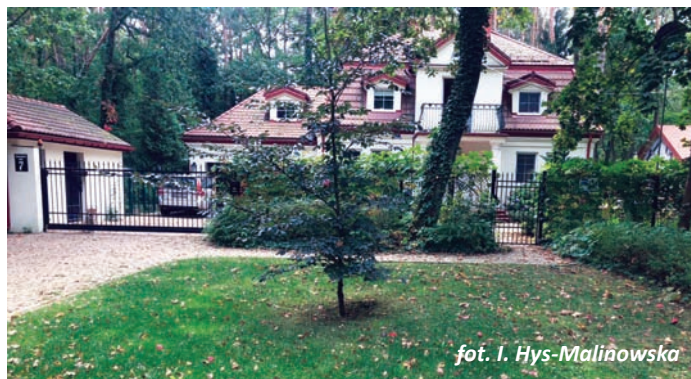
fol. I. Hys-Malinowska