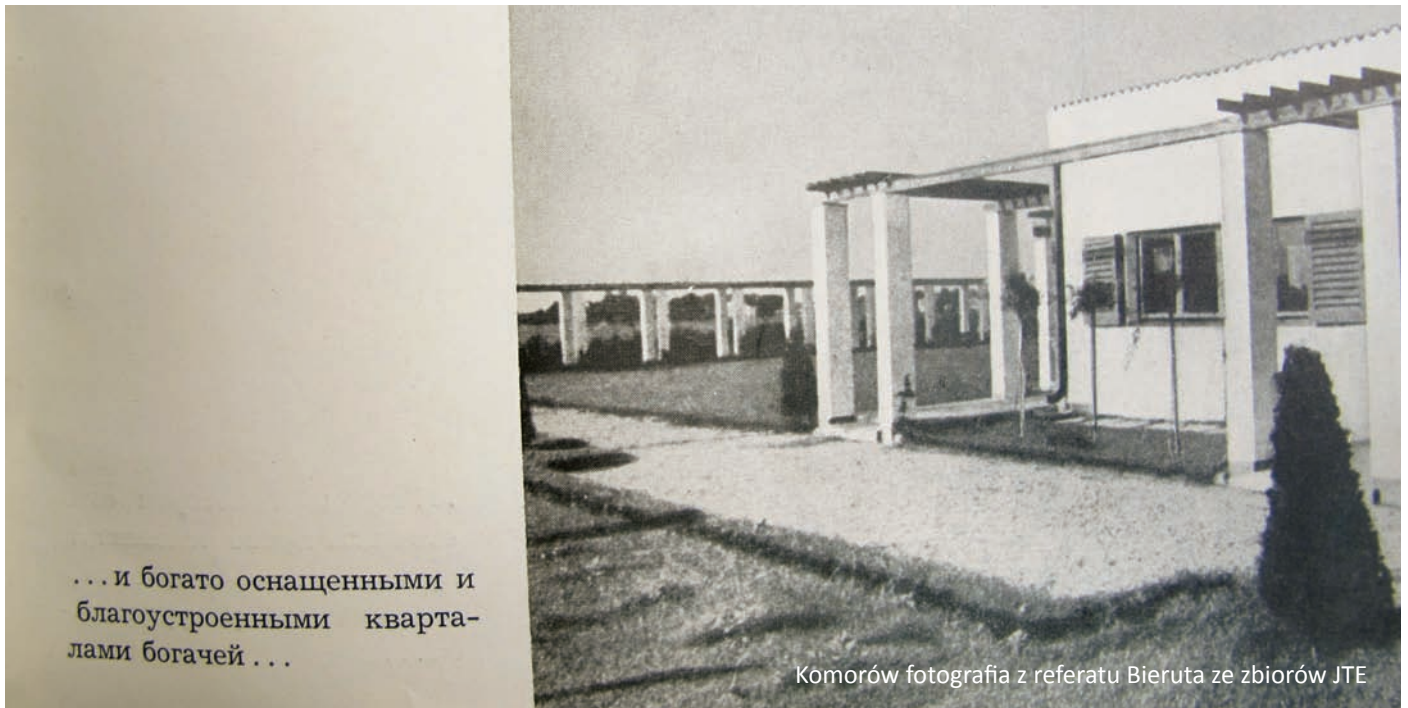
Komorów fotografia z referatu Bieruta