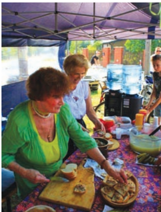
Domowe specjalności serwował Klub Seniora „Złota Jesień” z Zalesia Górnego

Na tym małym placu mieściło się jeszcze kilka zaproszonych straganów. Dzieci co roku wprawiały w podziw czarodziej wyciągający sznurek z ucha, warsztaty bębniarskie, gry i zabawy Muzeum Baśni z Czarnowa itp. atrakcje.