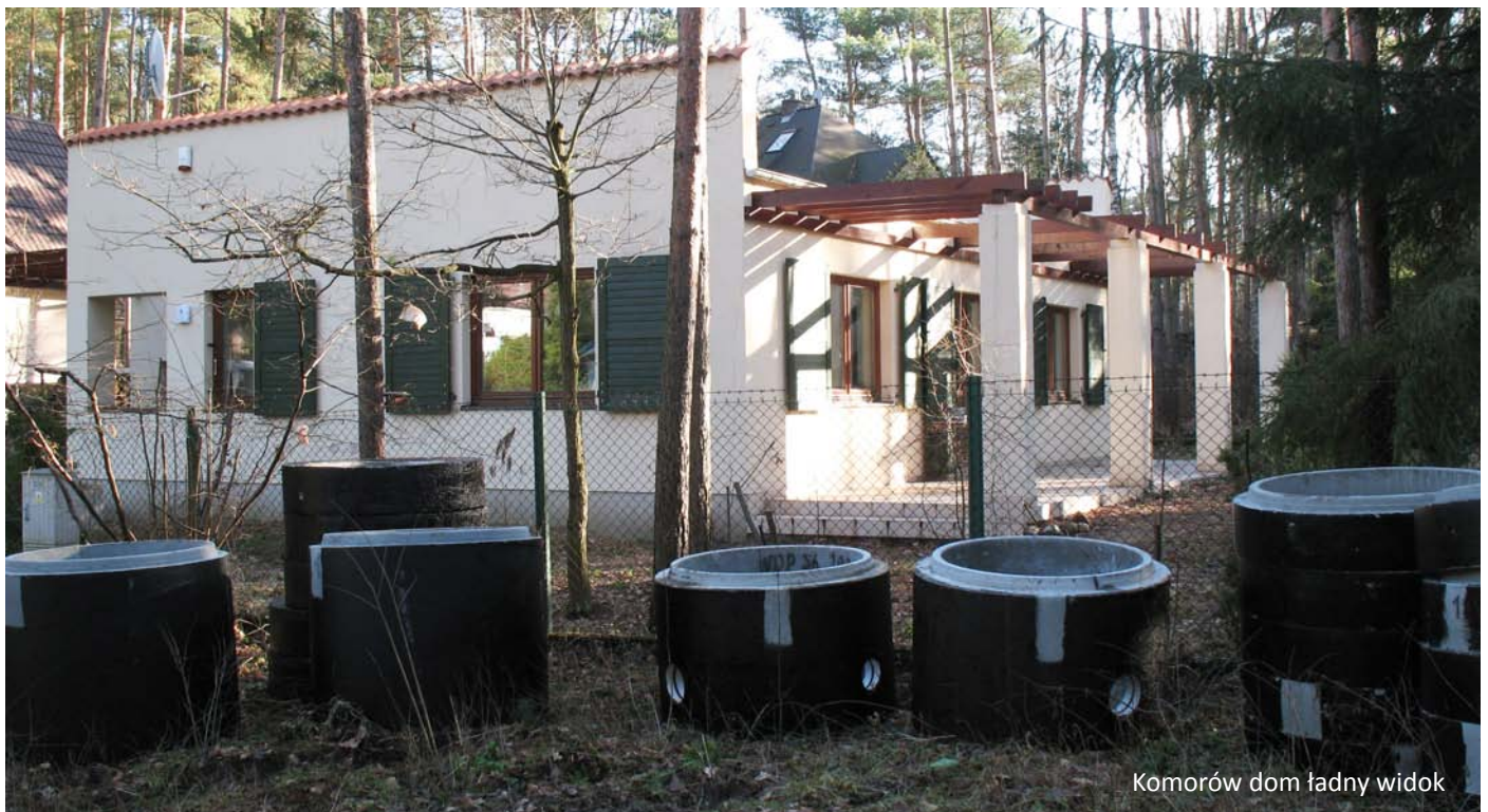
Komorów dom ładny widok