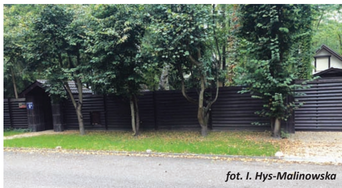
fol. I. Hys-Malinowska