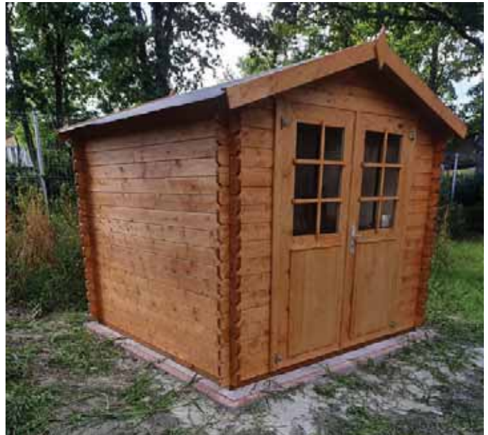
Jedna z inwestycji zrealizowana z Funduszu Sołeckiego 2020