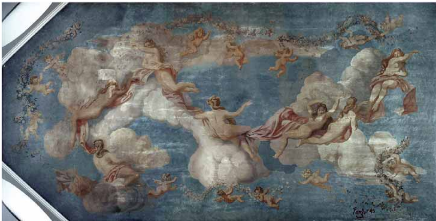
Plafon W. Fangora, Plejady, 1943

Talent i możliwości artystyczne Wojciecha Fangora przerosły najśmielsze oczekiwania jego nauczycieli. Na bogaty dorobek artysty składają się między innymi: nagrodzone na ogólnopolskich wystawach kanony sztuki socrealistycznej, realizacje z zakresu sztuki monumentalnej, plakaty, prekursorskie instalacje przestrzenne czy wreszcie prace związane z op-artem. Kierunek ten zapoczątkował ponad trzydziestoletnią karierę Fangora w Stanach Zjednoczonych. Tam m.in. prowadził zajęcia na najważniejszych uczelniach: Farleigh Dickinson University, Madison w Nowym Jorku (1966–1983) oraz Graduate School of Design, Harvard University, Cambridge, Massachusetts. W 1970 roku miał, jako jedyny polski artysta, indywidualną wystawę w nowojorskim Muzeum Guggenheima. Do Polski wrócił w roku 1999.