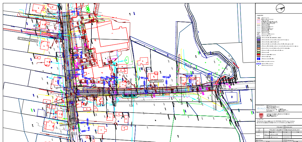
Propozycja rozwiązań drogowych w obszarze skrzyżowania ul. Szkolnej z ul. Millennium w Głoskowie. Rysunek w formacie PDF dostępny jest na stronie http://bip.piaseczno.eu/artukul/407/8434/poprawa-bezpieczenstwa-ukladu-komunikacyjnego-wokol-szkoly-podstawowej-w-gloskowie

Biorąc pod uwagę powyższe aspekty, zaprojektowano przejazdowy przystanek na ul. Szkolnej i wspólny przystanek dla 727 i L12 w ul. Milenium, przy założeniu zmiany trasy linii 727. Jest to znaczące udogodnienie dla obsługi pasażerskiej, pomimo przeniesienia przystanku przed skrzyżowanie z ul. Szkolną. Dodatkowo rozwiąże to problem ograniczonej widoczności przed skrzyżowaniem ul. Szkolnej z ul. Millennium i problemów z wykonaniem manewru skrętu przez kierowców pojazdów ciężarowych, gdy w zatoce stały autobusy.