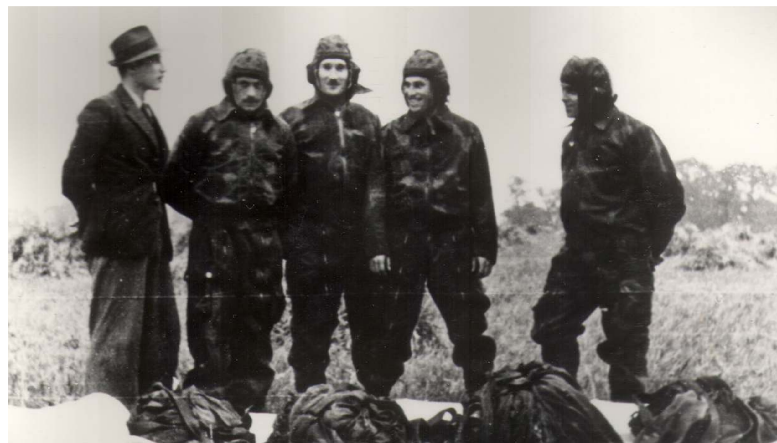
Grupa „Cichociemnych” ubrana w kombinezony bojowe skoczków SOE przed swoimi wiczebnymi skokami spadochronowymi w czasie kursu spadochronowego w Wielkiej Brytanii

W kilkudziesi ciu specjalnych i tajnych polskich, brytyjskich oraz polsko-brytyjskich o rodkach szkoleniowych znajduj cych si na terenie Anglii i Włoch przechodzili oni kursy dywersyjne i szkolenia specjalne, na których uczono ich mi dzy innymi: skoków ze spadochronem, walki wr cz, „cichego” zabijania nieprzyjaciela za pomoc gołych r k, no a lub pałki, celnego i szybkiego strzelania z ró nych pozycji strzeleckich i rodzajów broni palnej oraz prze ycia w ekstremalnych warunkach atmosferycznych i terenowych. Ponadto przyszli kandydaci na „Cichociemnych” szkoleni byli z rozkuwania kajdanek, umiej tnego wybijania szyby głów i wyskakiwania z pi tra, nauki brawurowej i szybkiej jazdy samochodem i motocyklem oraz zapoznawano ich z realiami ycia w okupowanej Polsce. Oprócz tego niektórzy „Cichociemni” przechodzili równie specjalistyczne szkolenia z zakresu ł czno ci radiotelegraficznej, fałszowania ró nych dokumentów i pieni dzy oraz wywiadu lotniczego i morskiego. Stanowili oni pó niej doskonale wykształcon kadr dowódcz i instruktorsk Zwi zku Walki Zbrojnej i Armii Krajowej.