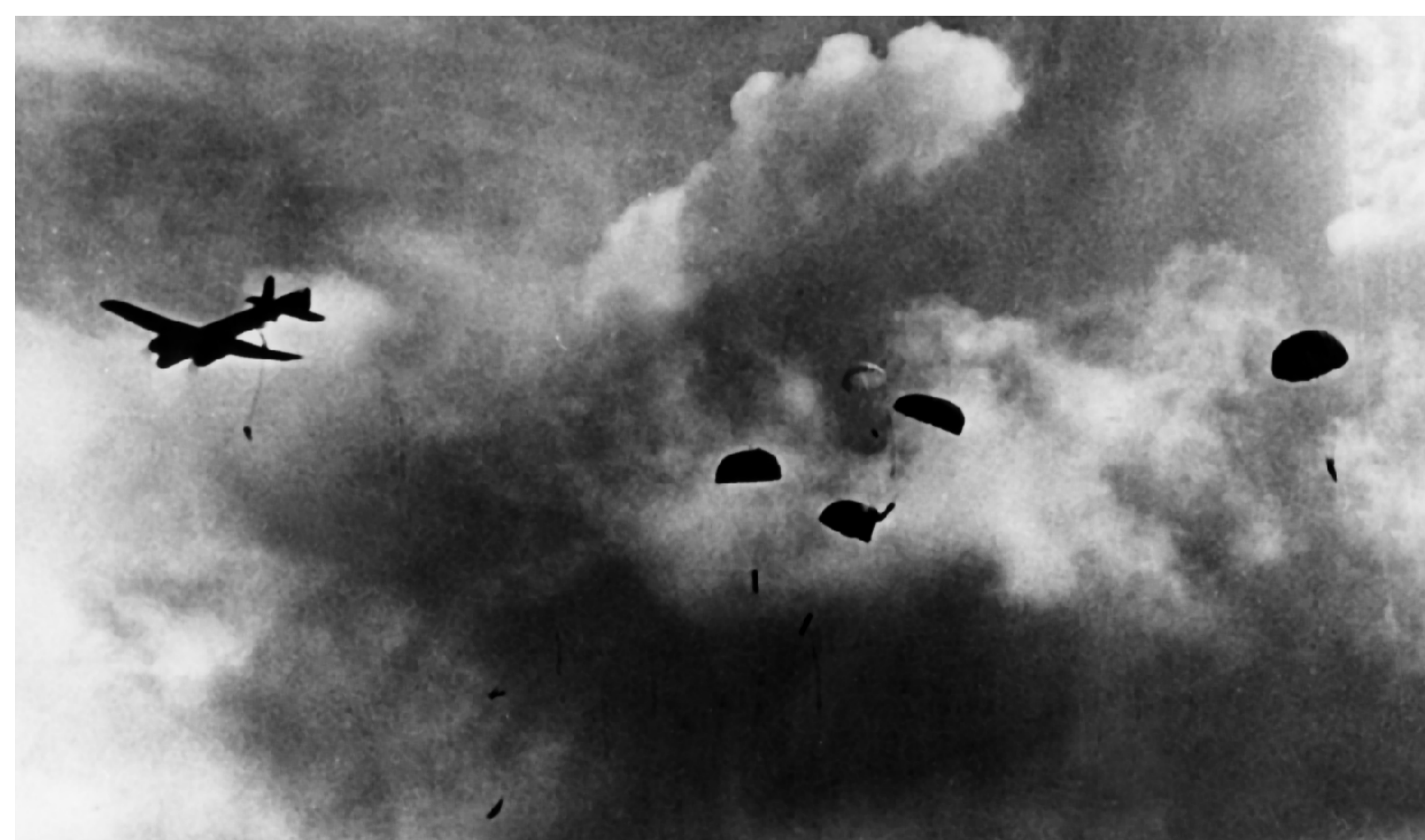
wiczebne skoki spadochronowe „Cichociemnych” w czasie szkolenia spadochronowego w Ringway koło Manchesteru w 1943 r.

W latach 1941-1944 do okupowanej Polski wysłano 316 „Cichociemnych” (w ród nich znalazła si jedna kobieta). Z tej liczby trzech skoczków zgin ło mierci spadochroniarza, a sze ciu w trakcie bezpo redniego przelotu do okupowanego kraju. Z r k niemieckich i rosyjskich organów bezpiecze stwa oraz w wyniku działań funkcjonariuszy Urz du Bezpiecze stwa komunistycznej Polski zgin ło 112 „Cichociemnych”. Dzi ki inicjatywie p. gen. bryg. Sławomira Petelickiego (1946-2012) chlubne tradycje bojowe „Cichociemnych” prze j ł a i godnie kontynuuje od 1995 r. elitarna jednostka wojskowa „GROM”.