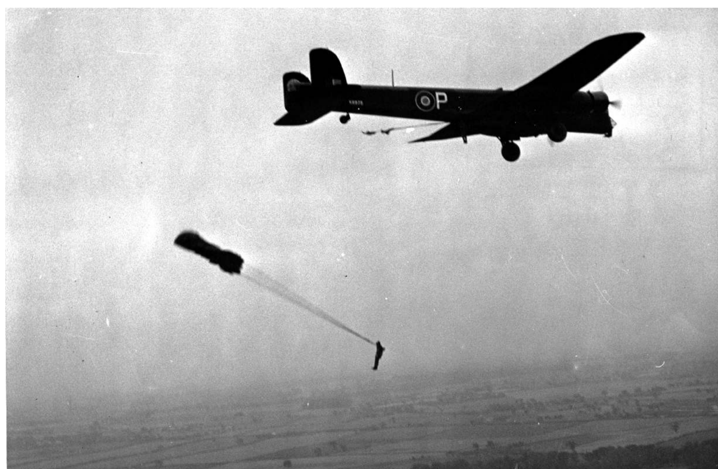
wiczebne skoki spadochronowe „Cichociemnych” w czasie szkolenia spadochronowego w Ringway koło Manchesteru