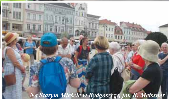
Na Starym Mieście w Bydgoszczy

Drugi dzień naszej wycieczki to zwiedzanie Ciechocinka. Upał jeszcze większy niż dnia poprzedniego, ale my zaprawieni w pokonywaniu trudności, zaczęliśmy od zwiedzania Muzeum Warzelnicy Soli i Lecznictwa Uzdrowiskowego, w którym było chłodno i bardzo