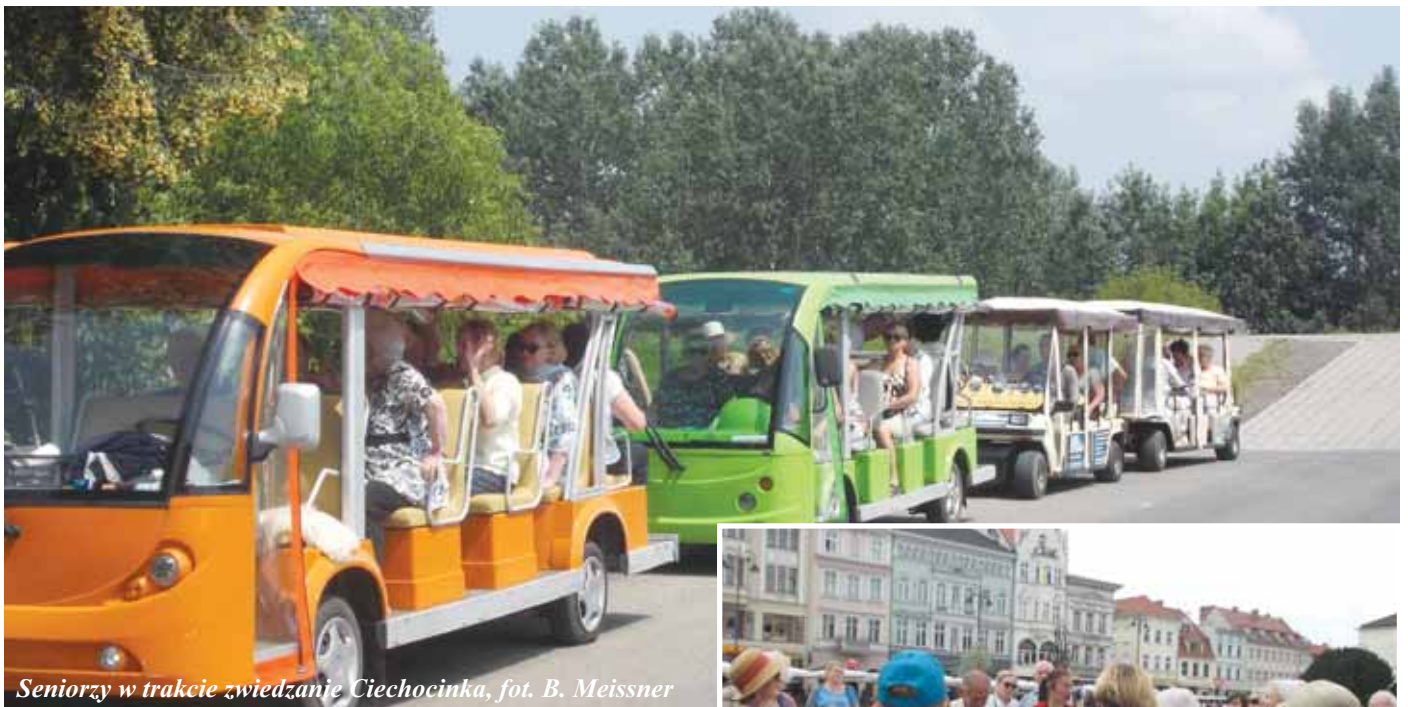
Seniorzy w trakcie zwiedzania Ciechocinka

Drugi dzień naszej wycieczki to zwiedzanie Ciechocinka. Upał jeszcze większy niż dnia poprzedniego, ale my zaprawieni w pokonywaniu trudności, zaczęliśmy od zwiedzania Muzeum Warzelnicy Soli i Lecznictwa Uzdrowiskowego, w którym było chłodno i bardzo