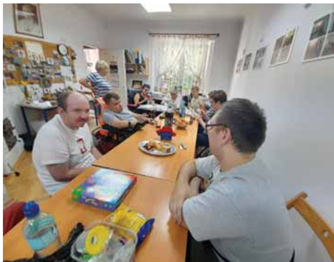
Spotkanie integracyjne

W Zalesiu Górnym odbywa się wiele działań dla społeczności lokalnej i ze społecznością lokalną, część wydarzeń inspirowana jest przez pracowników Ośrodka Pomocy Społecznej. Przykładem jest działalność Klubu Seniora i grupy „Razem Lepiej”. Klub Seniora na bieżąco w „Przystanku Zalesie” zdaje relacje ze swoich działań, wyjazdów, spotkań. Grupa „Razem Lepiej” sporadycznie informuje o swoich działaniach, wydarzeniach, osiągnięciach. Na początek więc trochę historii: Grupa ta powstała w roku 2010 z inicjatywy pracowników socjalnych /po wielu spotkaniach z osobami z niepełnosprawnościami/, przy współdziałaniu i wsparciu osób, którym nie jest obojętny los i temat niepełnosprawności, które również widziały potrzebę stworzenia możliwości rozwoju i zmiany w życiu osób niepełnosprawnych. Decyzję o stworzeniu grupy podjęli sami zainteresowani na spotkaniu w dniu 15.05.2010 r. Grupa przyjęła nazwę „Razem Lepiej” i działa więc od 2010 roku, skupia osoby z różnego rodzaju niepełnosprawnościami ich rodziny, opiekunów, osoby zaprzyjaźnione. Przez ten 12 letni okres istnienia zmieniał