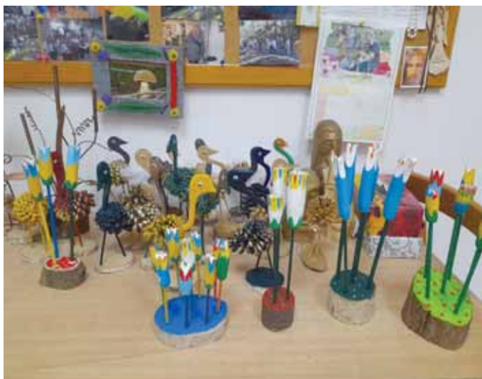
Nasze dzieła