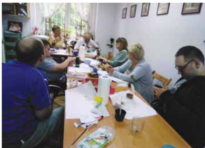
W trakcie warsztatów